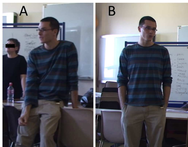
Figure 3 : Le paradoxe de la nonchalance rigide (Corpus 1, 2009)

Au moment de l'autoconfrontation (corpus 3), Philippe commente cette posture et met en évidence son caractère inapproprié, comme le montre l'extrait suivant :