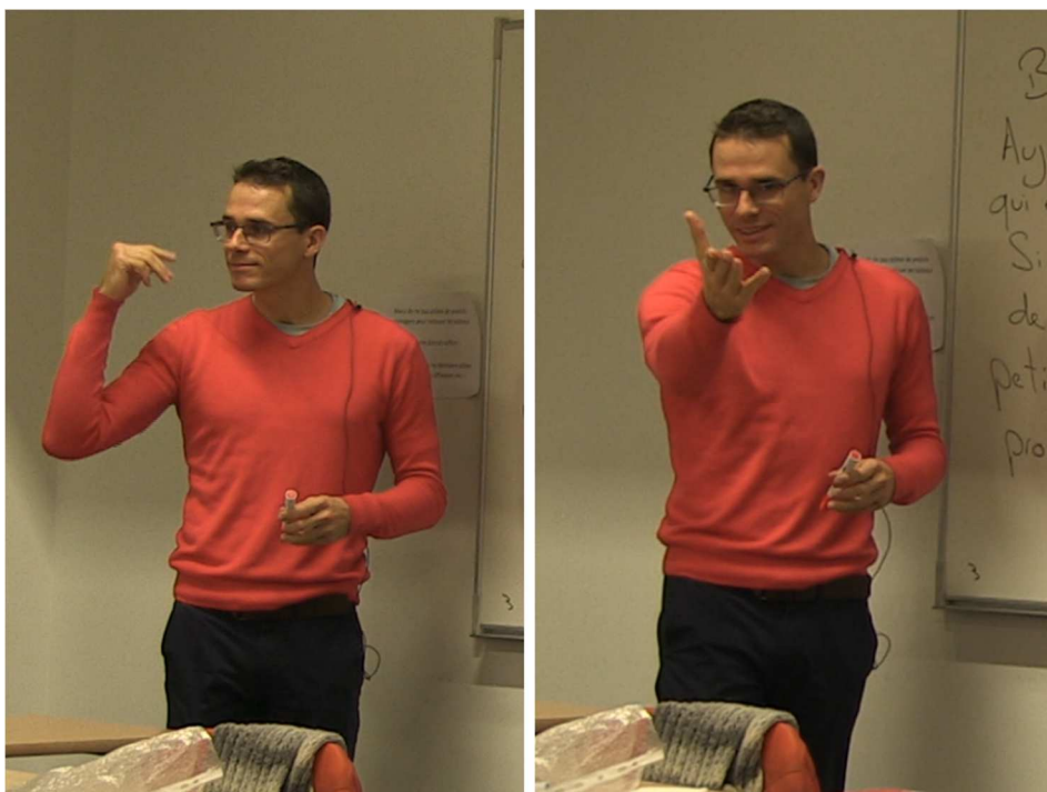
Figure 5 : La détente volontariste

certains enseignants et enseignantes cherchent à atteindre. Cette détente se situe au point d'équilibre entre une attitude « relaxe » qui facilite la communication avec les élèves tout en gardant une certaine autorité corporelle (voir Figure 5).