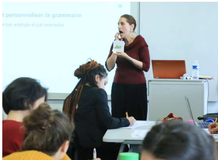
Figure 6 : La figure du clown

Dans une situation où le corps est vecteur de sens (avec des petits enfants en acquisition de la langue ou dans le cadre de l'apprentissage d'une langue étrangère), cette exagération de l'expressivité du corps fait souvent dire aux enseignantes et aux enseignants qu'ils font les clowns (Figure 6).