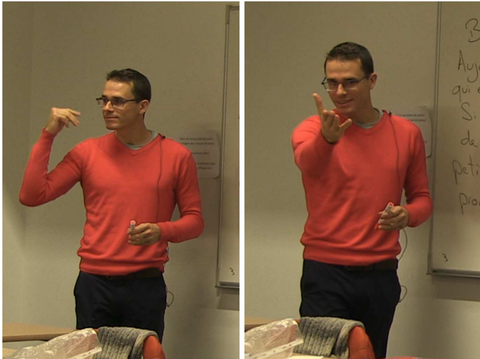
Figure 5 : La détente volontariste

certains enseignants et enseignantes cherchent à atteindre. Cette détente se situe au point d'équilibre entre une attitude « relaxe » qui facilite la communication avec les élèves tout en gardant une certaine autorité corporelle (voir Figure 5).