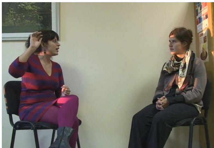
Figure 9 : Explication du verbe grimper en début de formation

En fin de première année, en expliquant le même mot à une autre apprenante avec sensiblement le même accompagnement verbal, elle commence par produire le même geste (première image de la Figure 10) puis se lève et mime l'action en engageant tout son corps et en faisant semblant d'escalader le mur. Pour incarner le sens de ses propos, elle sort complètement du cadre de l'expérimentation (et de la caméra) qui nécessitait d'être assis. On voit ici, une certaine prise de confiance dans son rôle d'experte, prête à mettre son corps en scène pour illustrer son discours. Cette mise en scène est d'ailleurs efficace puisque son apprenante lève la main vers elle pour lui signifier qu'elle a compris.