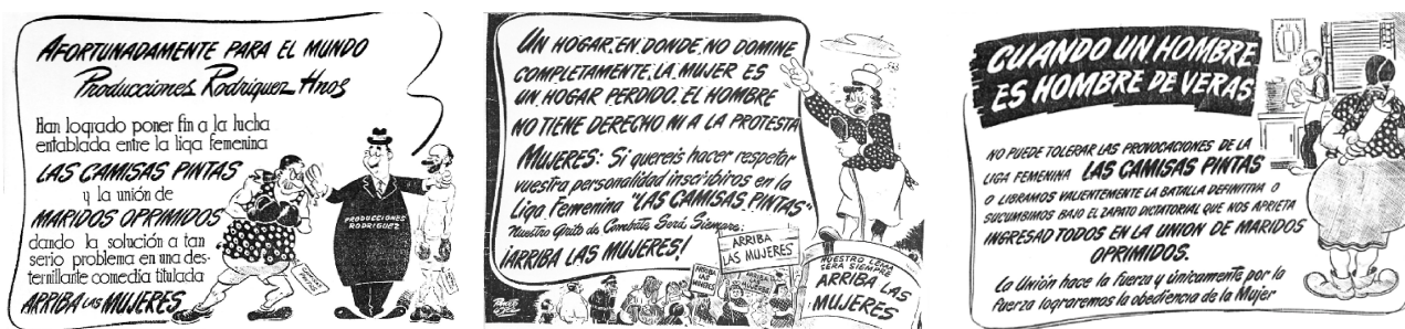
Figura 2. — Ciertamente la burla abarca también la publicidad, que por sí misma ridiculiza las demandas feministas.

Así las cosas, el intento queda tan solo en denuncia. ¿Es una denuncia suficiente? ¿Puede permitir pensar las cosas? Quizás, sin embargo en este corpus las protagonistas más que hablar de feminismo lo gritan, pero no lo actúan en sus conductas ni al tomar sus decisiones. El sistema de género se conforma y —sólo puede modificarse— mediante actos. ¿Puede considerarse acaso una “resistencia” a un sistema de género hegemónico? ¿Logra despertar la inquietud?