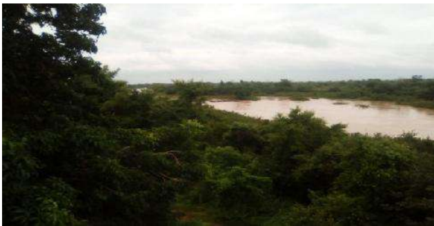
Photo 2 : La rivière Oti à la frontière Togo – Ghana dans la préfecture de l'Oti-sud