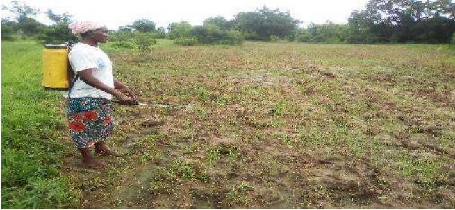
Photo 1 : Une femme dans la culture du riz à Gando, Djé djabou (Préfecture de l'Oti-Sud Togo)