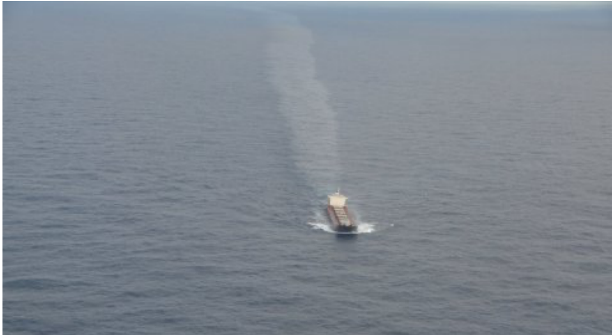
Pollution navire Thisseas

La cour d'appel de Rennes avait considéré que l'article 228 de la Convention soumettait la poursuite en France à un certain nombre de conditions préalables, dont il appartenait au juge répressif de déterminer si elles ont été ou non remplies, ce qui impliquait l'analyse de la réponse donnée par l'Etat français à la demande émanant de l'Etat étranger.