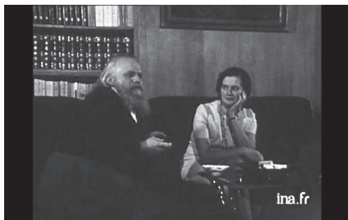
FIGURE 1 • « Portrait de deux musicologues », Micros et caméras, 14 mars 1970, première chaîne de l'ORTF.