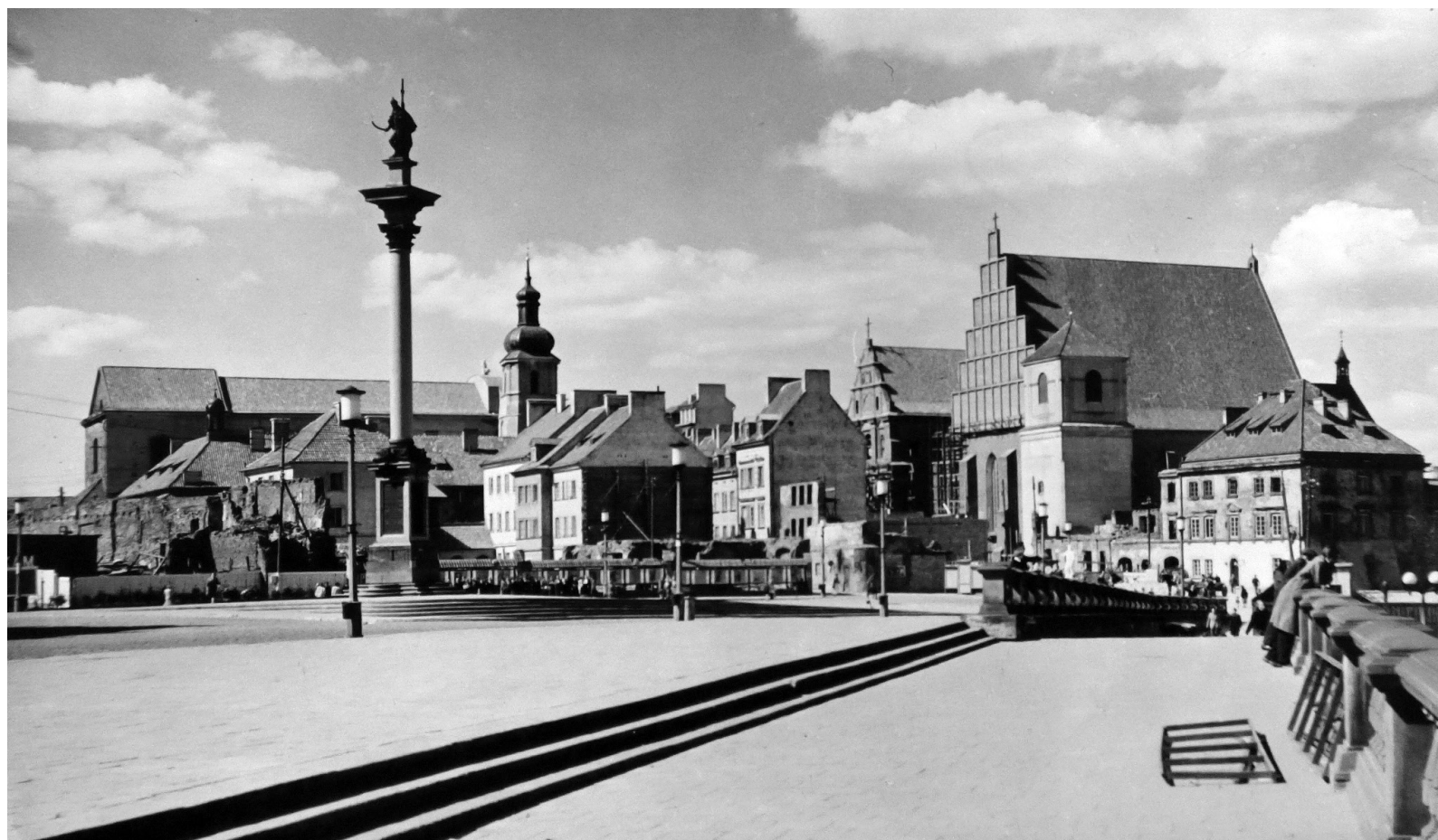
Fig. 10 - Place du château, état en 1954