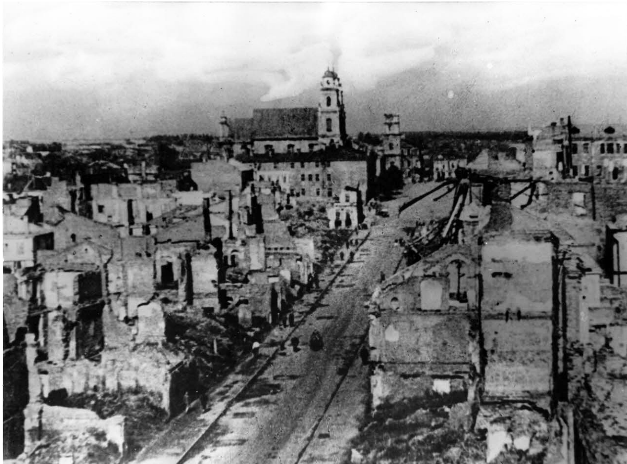
Au fond la cathédrale, encore intacte.

l'identique cet édifice moderne des années 1920 qui devient le siège de leur administration : une croix gammée vint simplement recouvrir l'emblème soviétique. En revanche, les efforts soviétiques de modernisation de Minsk firent l'objet de railleries racistes alimentant une politique de disqualification de l'adversaire russe. L'ensemble de la Maison des Spécialistes (bâti en 1934, largement détruit en 1941) fut stigmatisé par l'occupant comme un habitat trop misérable selon les standards allemands. Dans un raccourci de propagande, les immeubles minskoï furent opposés au schéma d'une « rue résidentielle allemande pouvant être vue partout dans le Reich , construction modeste et saine pour des travailleurs brillants et en bonne santé 3 ». Cette opposition entre fonctionnalisme soviétique et régionalisme nazi révèle à quel point deux idéologies antagonistes utilisèrent chaque domaine pour servir leurs objectifs, l'architecture rejoignant elle aussi cet arsenal.