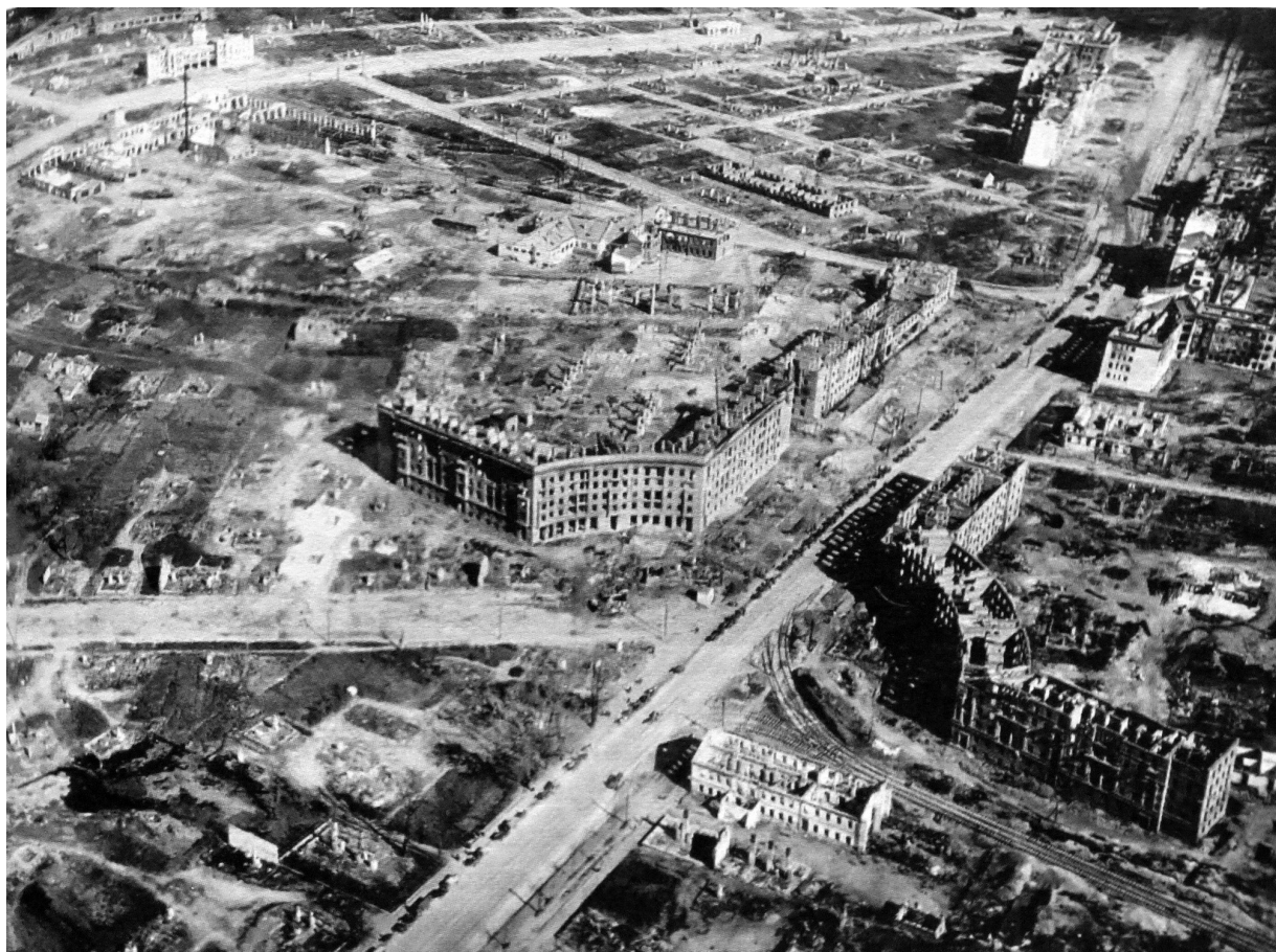
Fig. 2 - Actuelle Place de la Victoire, état à la libération de la ville, 1944