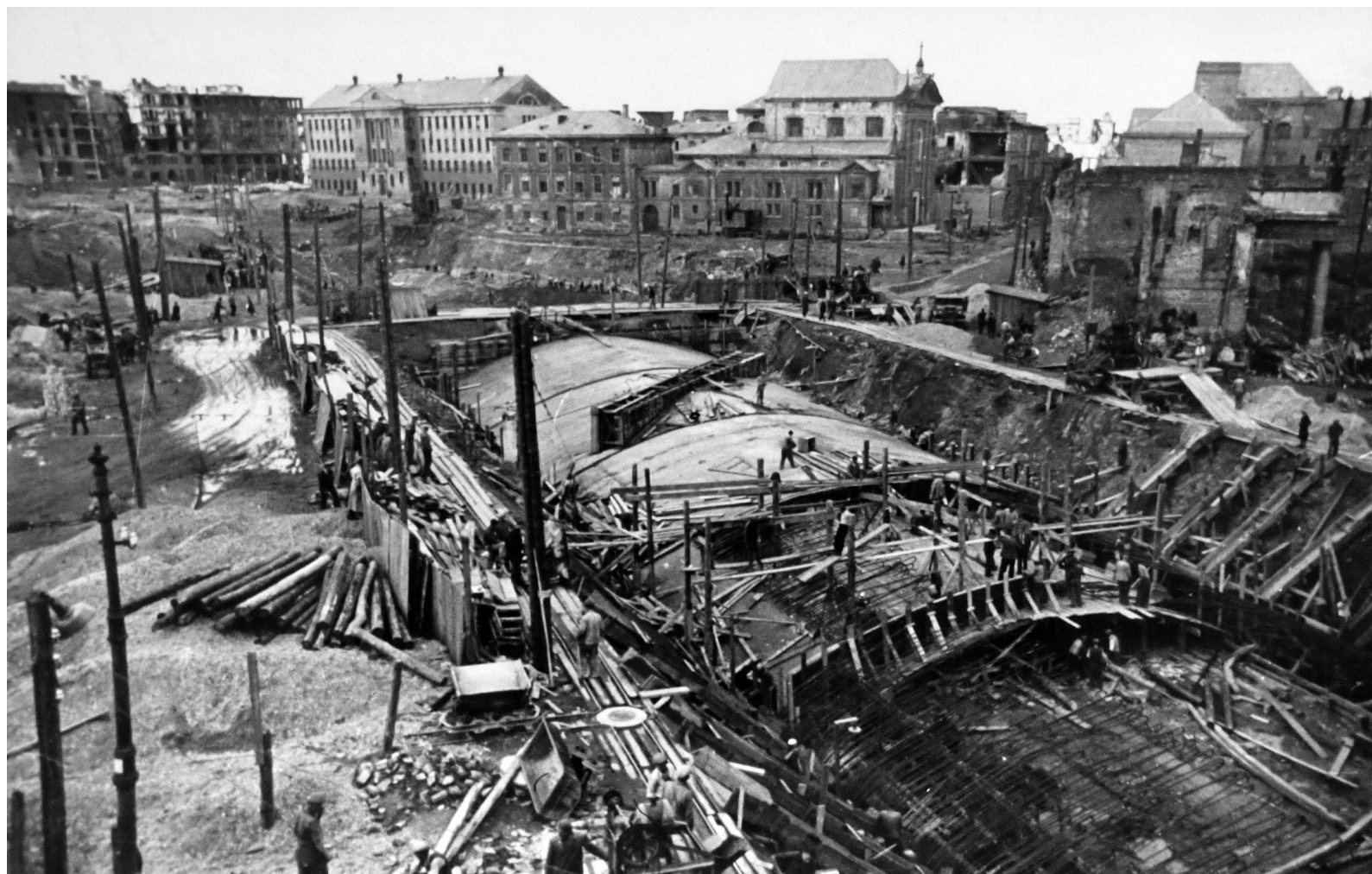
Fig. 7 - Jozef Sigalin, chantier du tunnel de la Trasa W-Z, 1948