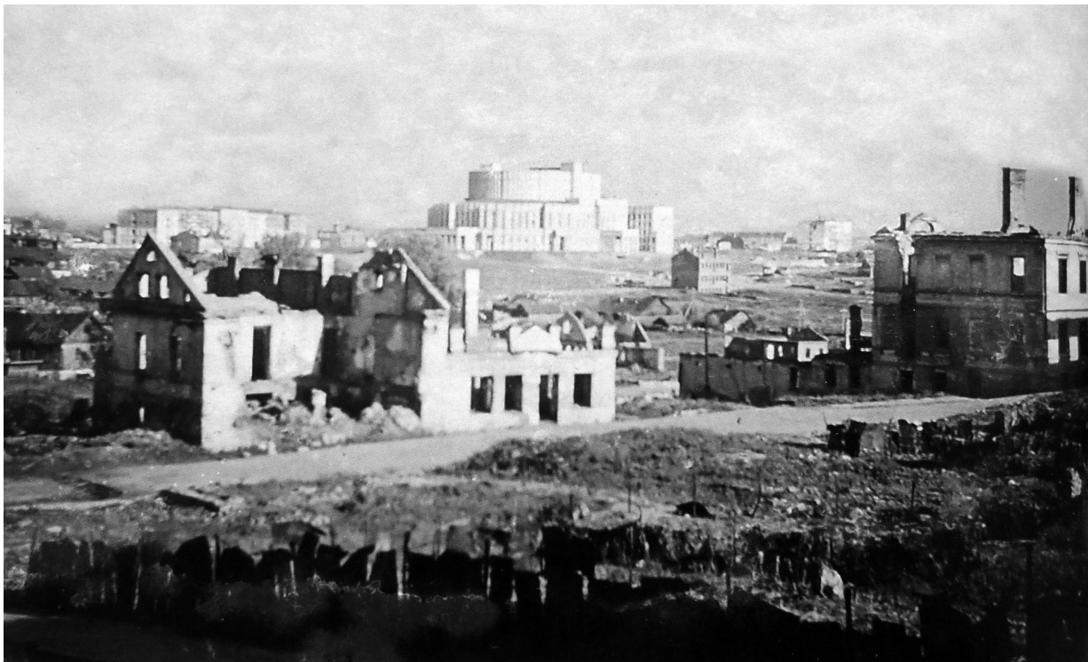
Fig. 4 - Les ruines de Minsk en 1945

Au fond l'Opéra, parmi les rares édifices peu abîmés par la guerre.