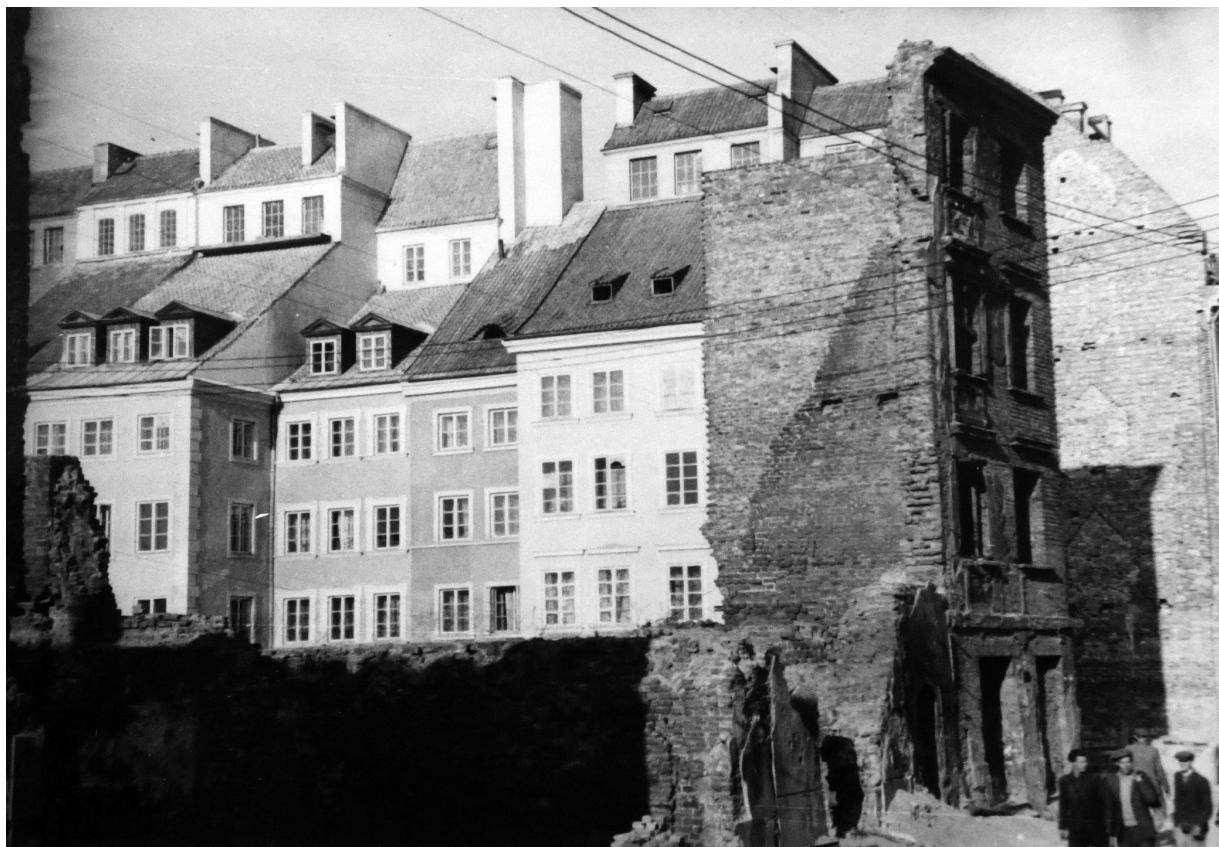
Fig. 8 - Façades arrière des maisons reconstruites de la place du Marché, 1953