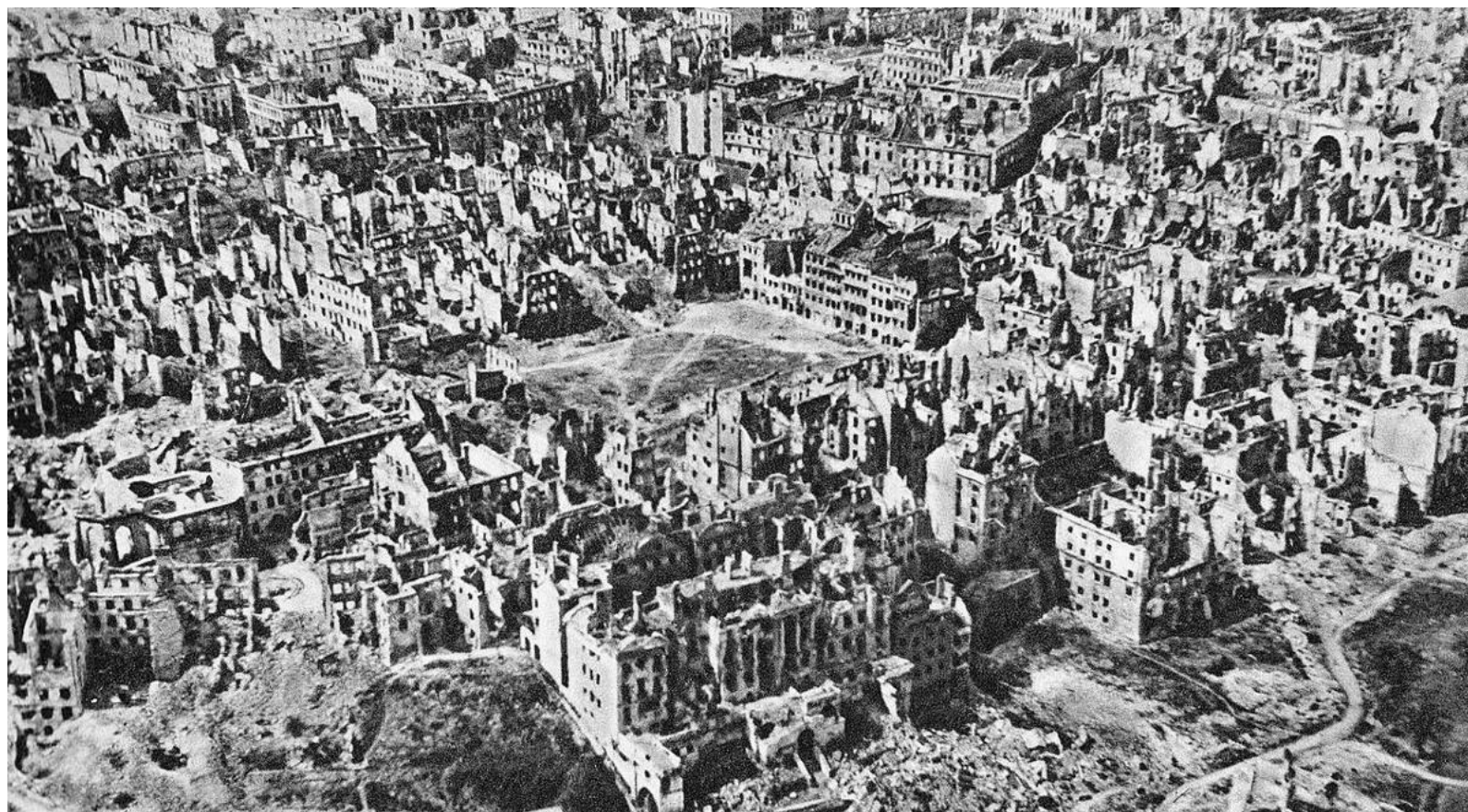
Fig. 6 - Vieux centre, état à la libération de la ville, 1944