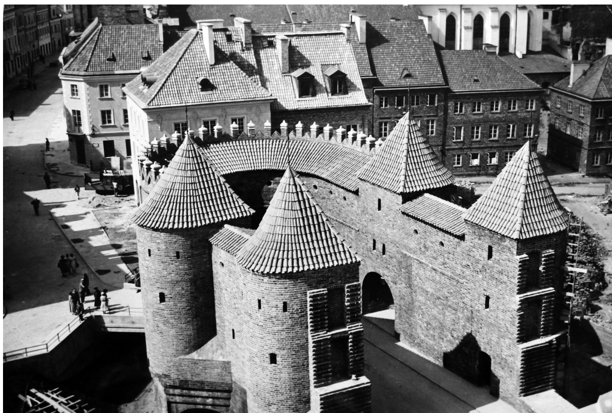
Fig. 9 - Jan Zachwatowicz, reconstruction de la barbacane, 1952