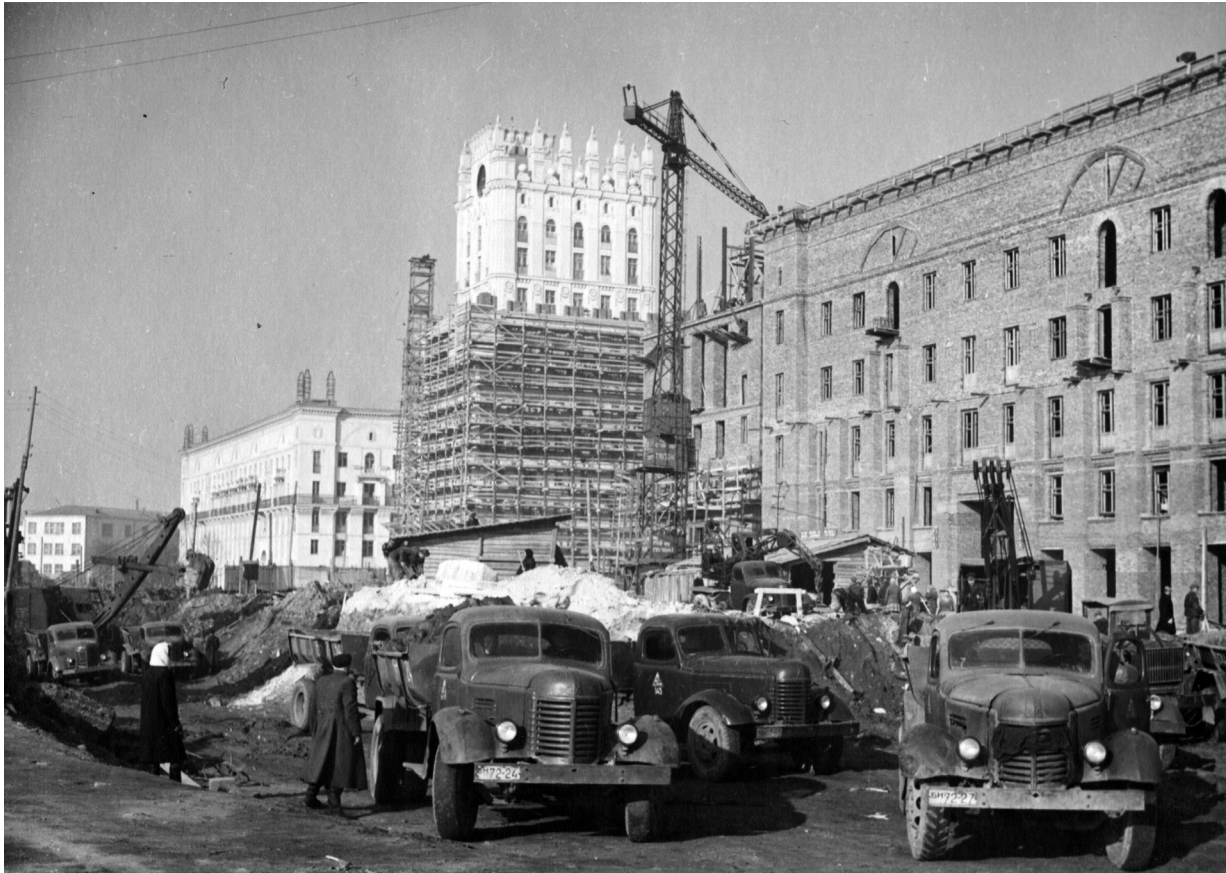
Fig. 3 - Boris Roubanenko, construction du groupe monumental dit des Portes de Minsk, 1948