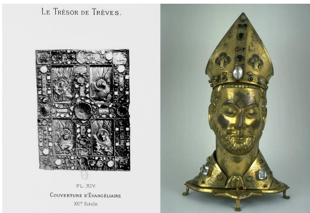
Figure 3. Photographie a) de la couverture d'un évangélaire (XIIe s.) du trésor de la cathédrale de Trèves, Allemagne (H : 0,35 cm ; L : 0,25 cm ; et b) Chef de Saint Ferréol (Église paroissiale de la Décollation-de-Saint-Jean-Baptiste, Nexon, Haute-Saône ; H : 0,60 cm ; L : 0,39 cm), décrits comme intégrant des bézoards par Palustre et Barbier de Montault (1886 a et b) et Rupin (1890).

En ce qui concerne la couverture d'évangélaire (XIIe s.) du trésor de la cathédrale de Trèves (Trier en allemand), Palustre et Barbier de Montault (1886 a) décrivent ainsi les bézoards : « ...au côté droit de la croix, à l'extrémité du croisillon, il y a un bézoard, facilement reconnaissable à sa couleur jaunâtre et à sa contexture granulée... ».