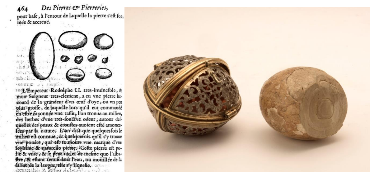
Figure 2. a) Gravure du chapitre « De la pierre Bezoard » (191, CXCI) de l'ouvrage « Le parfait Joaillier, ou Histoire des pierreries » (De Boodt, 1644 ; pp. 463-466) et b) Pierre de Bézoard (Allemagne, XVIII e siècle, Musée de la Pharmacie, Lisbonne) montrant sa structure nodulaire concentrique, auprès de son boîtier ajouré.

Les bézoards sont des concrétions minérales ou organiques (biominéralisation) nodulaires ovoïdes ou sphériques, de dimension variables (centimétriques à décimétriques), constituées de couches concentriques, intégrant des aliments végétaux partiellement digérés, des poils (égagropiles) ou des grains minéraux ingérés (gastrolithes). Ils sont présents dans diverses régions du tube digestif des animaux généralement ruminants comme le bouquetin, la vache, le cheval ou la chèvre. Les concrétions sous forme de calculs d'autres organes (rénaux ou biliaires) étaient également considérées comme des bézoards (Franckort, 2015). On en trouve également chez l'être humain. On distingue par exemple les phytobézoards constitués de débris végétaux, ou encore les trichobézoards constitués de poils.