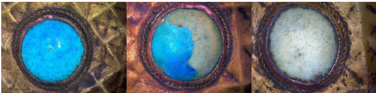
Figure 5. Détails de « bézoards » a) glacuré (à gauche) ; b) avec glaçure incomplète écaillée (au centre) et c) sans glaçure (à droite).