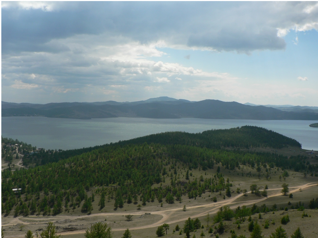
Photo 6 Les interdictions de pêche saisonnières, l'exemple du golfe de Moukhour du lac Baïkal Cliché L. Touchart, août 2006

Du 25 avril au 30 juin, la pêche est interdite dans le golfe de Moukhour, ici photographié du nord-ouest au sud-est.