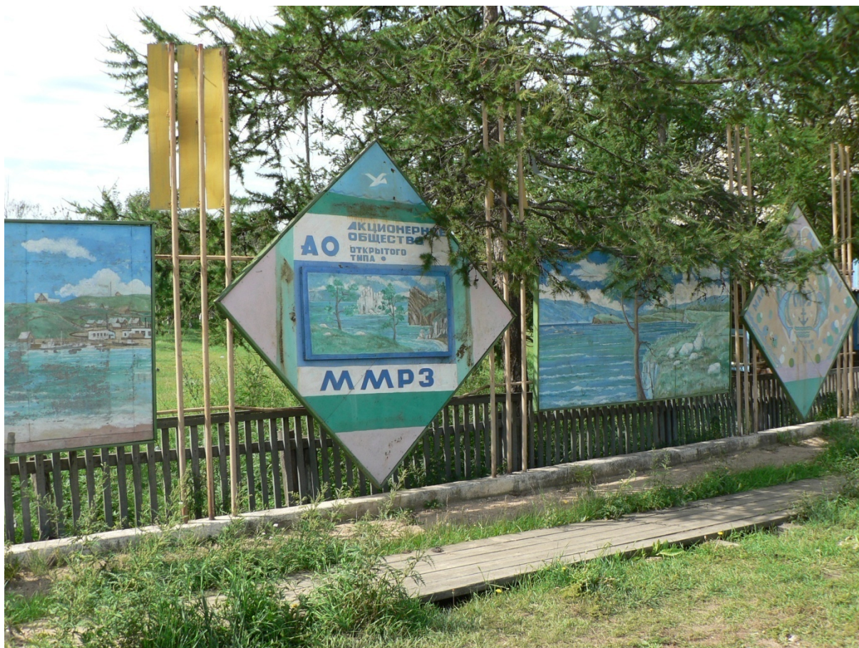
Photo 9 La conserverie de poissons de Khoujir et la baisse d'activité Cliché L. Touchart, août 2008

La conserverie de poissons de la capitale de l'île d'Olkhon du Baïkal tourne au ralenti depuis la chute de l'URSS. Le bourg de pêche s'est transformé en un centre touristique. La pancarte d'entrée montre aussi que l'usine d'Etat a été transformée en société par actions.