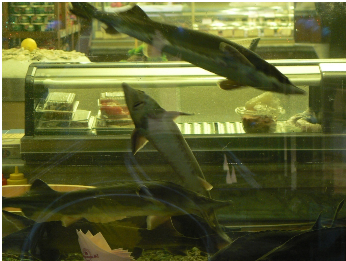
Photo 1 La difficulté d'interprétation des textes internationaux concernant l'esturgeon Cliché L. Touchart, décembre 2009

internationaux ne sont pas interprétés de la même façon par la Russie et l'Iran, notamment à propos des esturgeons et du caviar 3 (Cabanne et Tchistiakova, 2005).