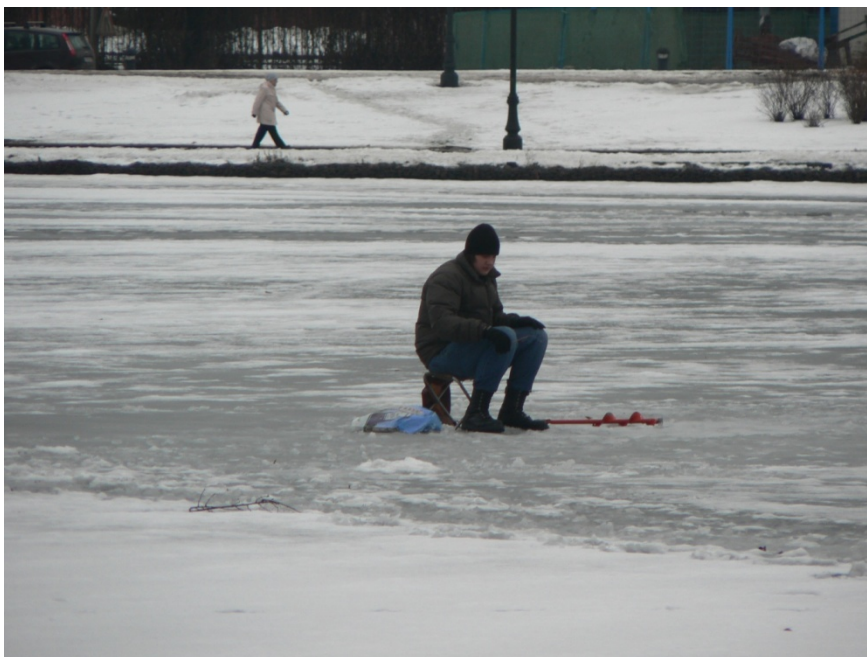
Photo 2 La pêche blanche, une longue tradition russe

La loi de 2004 s'attachait aussi à réglementer la pêche effectuée par les entreprises commerciales, tout en prévoyant des dispositions ultérieures propres à chaque région. Le fait majeur de la loi était sans doute, dans la continuité d'une réflexion internationale issue de Johannesburg, la détermination pour la pêche professionnelle d'un Obchtchi Dopoustimy Oulov (O.D.Ou), c'est-à-dire d'un Total Admissible des Captures (TAC) pour chaque espèce. C'est sous forme d'ordonnance, de prikaz , que chaque grand bassin halieutique 10 , chaque rybokhoziaïstvenny basséïn , a défini ensuite ses règlements de pêche, ses pravila rybolovstva , en conformité avec la loi fédérale de 2004. Par exemple, l'ordonnance d'avril 2009 a fixé les règles pour le bassin halieutique du Baïkal 11 . C'est plus récemment, en juin 2011, que le rybokhoziaïstvenny basséïn d'Extrême-Orient a été pourvu d'une ordonnance fixant les règlements de pêche propres à la région.