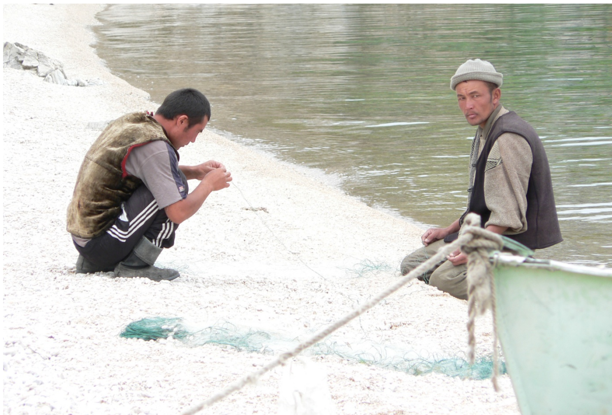
Photo 7 La réglementation des engins de pêche dans le Baïkal, l'exemple des pêcheurs professionnels du golfe Dyriavy Cliché L. Touchart, août 2005

Dans les grands lacs naturels de la partie européenne, l'exploitation immodérée culmina elle aussi dans les années 1930 ou 1940, avant que des mesures ne fussent prises pour reconstituer les réserves halieutiques, au moins en fixant des quotas, parfois en alevinant. Au début des années 2000, les prises sont d'environ quatre mille tonnes par an dans le lac Tchoudsk, contre près de quinze mille au début des années 1930 (Kangur et al. , 2003) et mille cinq cents tonnes par an dans le lac Ilmen (Asanov, 2003). Dans ces lacs européens, auxquels il faut ajouter le Ladoga et l'Onéga, la riapouchka constitue l'essentiel de la demande, car le Corégone blanc ( Coregonus albula ) est apprécié pour sa chair. Dans le Ladoga, les réserves halieutiques avaient fortement diminué pour plusieurs espèces, si bien qu'il a fallu repeupler artificiellement le plus grand lac naturel d'Europe, non seulement en riapouchki , mais aussi en saumons ( lossossi ) et en truites ( foreli ) (Kudersky, 2004).