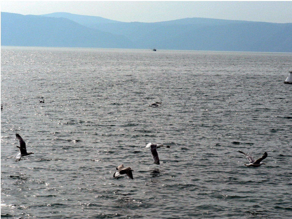
Photo 4 Garantir la ressource halieutique et préserver l'ensemble de l'écosystème Cliché L. Touchart, août 2005

en passant par la Sibérie, la gestion durable des stocks d'esturgeons est une action qui dépasse la sphère économique pour atteindre à l'image de la Russie.