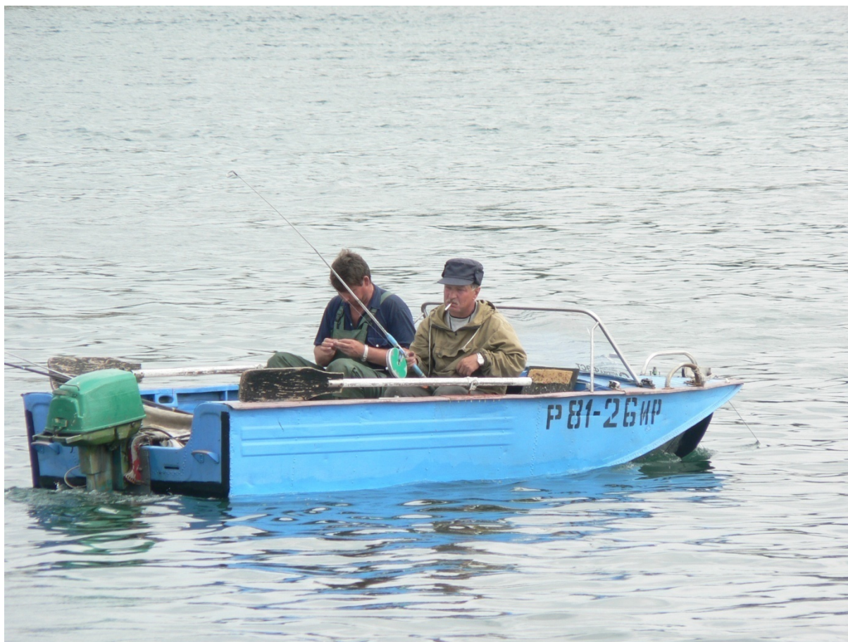
Photo 3 La pêche illicite, une activité en baisse