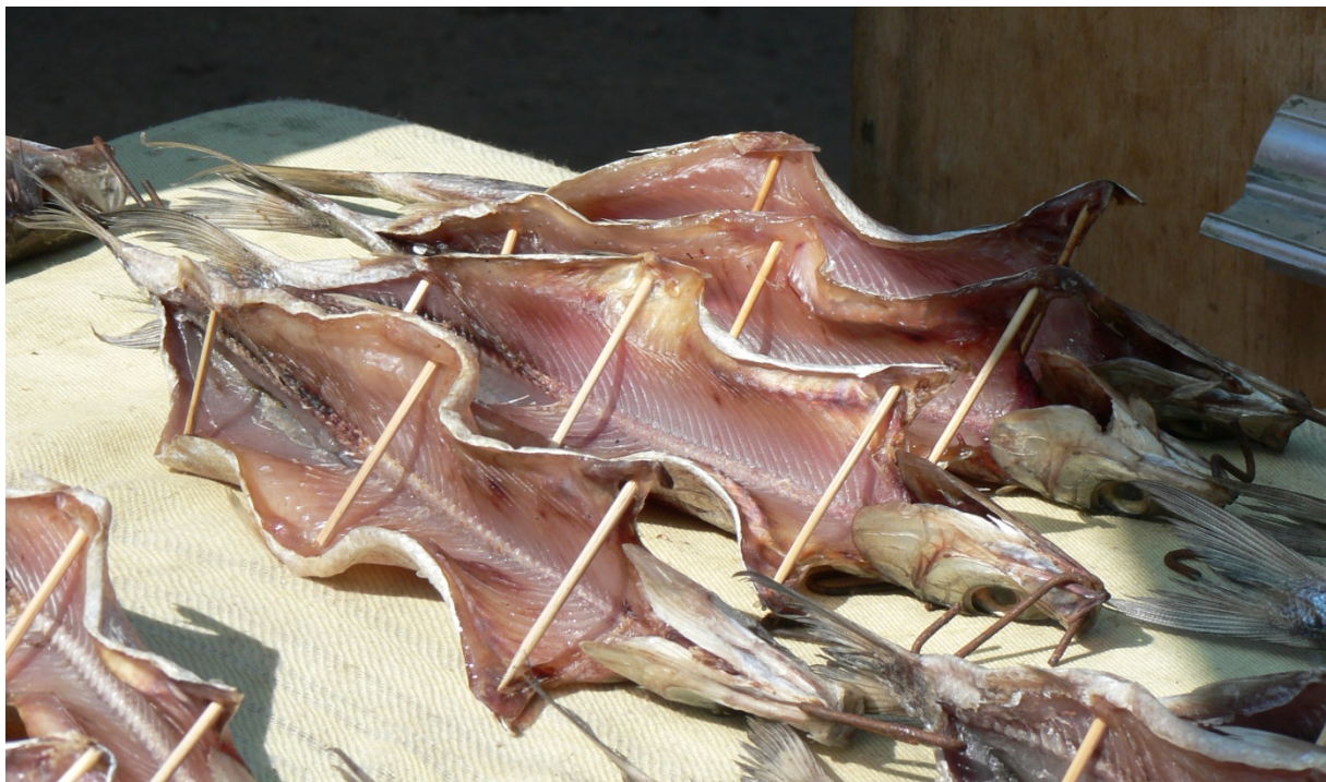
Photo 5 L'omoul dans le lac Baïkal, une pêche réglementée depuis les années 1960