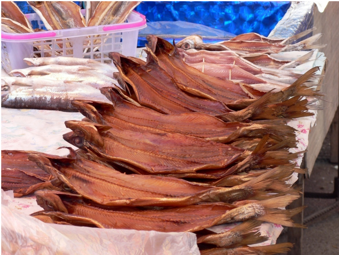
Photo 13 L'omoul fumé, la spécialité du lac Baïkal Cliché L. Touchart, juillet 2006

Ce sandre à la mode princière (soudak po-kniajevskij) a été préparé au restaurant Aleksandrovskij de l'ancien hôtel particulier du marchand odessite Iossif Konelskij.