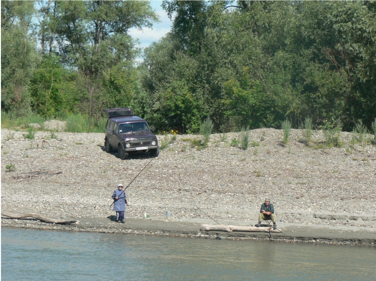
Photo 8 La construction d'un esprit citoyen chez les pêcheurs amateurs

La langue russe possède deux noms pour désigner la personne qui prend du poisson, selon qu'il s'agit de son métier ou de son divertissement. Le pêcheur professionnel est rybak , cependant que le pêcheur amateur est dit rybolov . Le fait que deux termes existent est déjà un élément culturel en soi, qu'il convient de faire fructifier pour mieux atteindre à une pêche durable que chacun s'approprie.