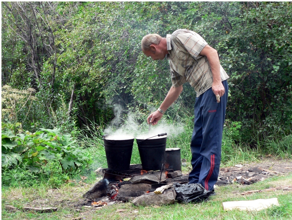
Photo 14 La préparation de la soupe de poissons du Baïkal

La haute estime dans laquelle est tenu le poisson d'eau douce par les Russes favorise depuis toujours un certain respect. Les liens entre l'art culinaire, la culture gastronomique, mais aussi la simple tradition, et le poisson de lac ou de rivière concourent à un ensemble de réflexes intellectuels communs à la plupart des Russes. Il semble logique que, dans le contexte actuel, cet ancrage historique se manifeste par un intérêt pour la traçabilité des produits et, plus largement, une évolution vers la pêche durable.