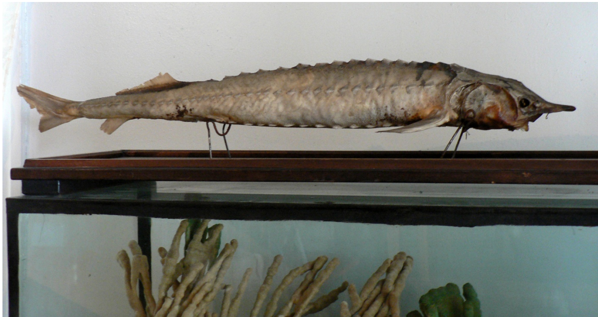
Photo 11 Les liens entre la recherche scientifique et le monde de la pêche