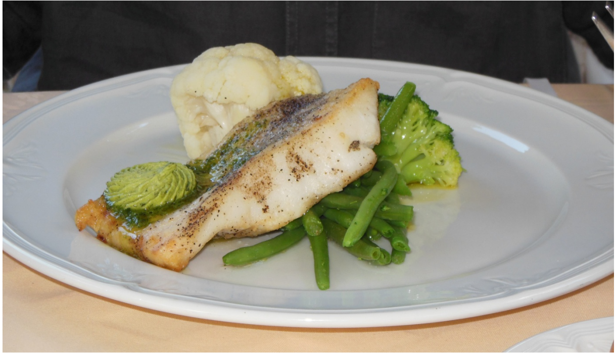
Photo 12 Le sandre à la mode princière, un exemple de l'art culinaire russe d'accommoder les poissons de rivière Cliché L. Touchart, juillet 2013

Ce sandre à la mode princière (soudak po-kniajevskij) a été préparé au restaurant Aleksandrovskij de l'ancien hôtel particulier du marchand odessite Iossif Konelskij.