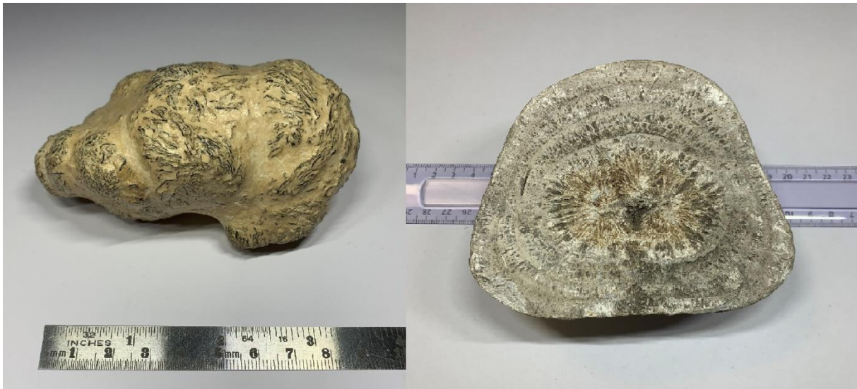
Figure 7. Photographies de deux des bézoards modernes analysés : a) bézoard de lama (9 cm) en newberyite \text{MgHPO}_4 \cdot 3\text{H}_2\text{O} ; b) bézoard de bovin en struvite \text{NH}_4\text{MgPO}_4 \cdot 6\text{H}_2\text{O} (15 cm) (VetAgro-Sup, Campus Vétérinaire de Lyon, Marcy l'Etoile).

sont présentés Figure 8. On note la diversité des compositions, minérales : newberyite \text{MgHPO}_4 \cdot 3\text{H}_2\text{O} , struvite \text{NH}_4\text{MgPO}_4 \cdot 6\text{H}_2\text{O} , calcite \text{CaCO}_3 et organique : acide urique \text{C}_5\text{H}_4\text{N}_4\text{O}_3 (Tableau 1).