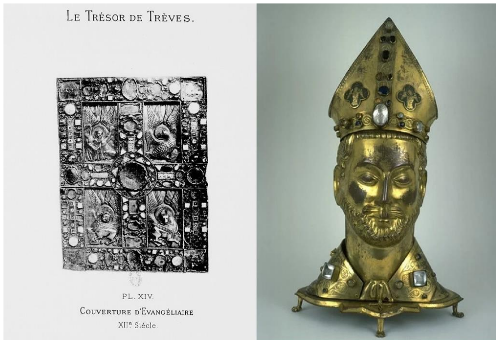
Figure 3. Photographie a) de la couverture d'un évangélaire (XIIe s.) du trésor de la cathédrale de Trèves, Allemagne (H : 0,35 cm ; L : 0,25 cm ; et b) Chef de Saint Ferréol (Église paroissiale de la Décollation-de-Saint-Jean-Baptiste, Nexon, Haute-Saône ; H : 0,60 cm ; L : 0,39 cm), décrits comme intégrant des bézoards par Palustre et Barbier de Montault (1886 a et b) et Rupin (1890).

En ce qui concerne la couverture d'évangélaire (XIIe s.) du trésor de la cathédrale de Trèves (Trier en allemand), Palustre et Barbier de Montault (1886 a) décrivent ainsi les bézoards : « ...au côté droit de la croix, à l'extrémité du croisillon, il y a un bézoard, facilement reconnaissable à sa couleur jaunâtre et à sa contexture granulée... ».