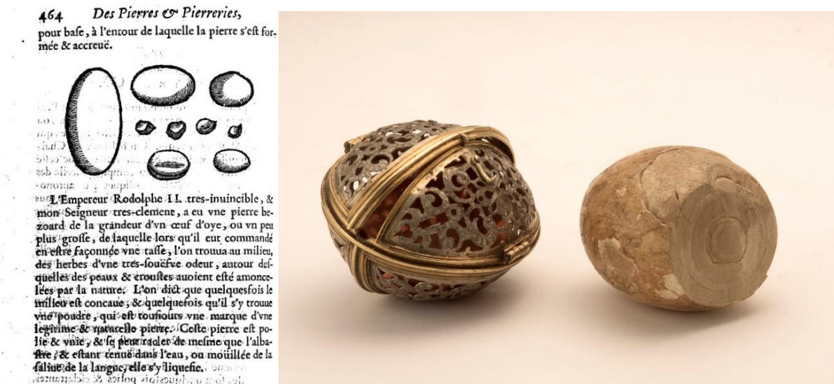
Figure 2. a) Gravure du chapitre « De la pierre Bezoard » (191, CXCI) de l'ouvrage « Le parfait Joaillier, ou Histoire des pierreries » (De Boodt, 1644 ; pp. 463-466) et b) Pierre de Bézoard (Allemagne, XVIII e siècle, Musée de la Pharmacie, Lisbonne) montrant sa structure nodulaire concentrique, auprès de son boîtier ajouré.

Les bézoards sont des concrétions minérales ou organiques (biominéralisation) nodulaires ovoïdes ou sphériques, de dimension variables (centimétriques à décimétriques), constituées de couches concentriques, intégrant des aliments végétaux partiellement digérés, des poils (égagropiles) ou des grains minéraux ingérés (gastrolithes). Ils sont présents dans diverses régions du tube digestif des animaux généralement ruminants comme le bouquetin, la vache, le cheval ou la chèvre. Les concrétions sous forme de calculs d'autres organes (rénaux ou biliaires) étaient également considérées comme des bézoards (Franckort, 2015). On en trouve également chez l'être humain. On distingue par exemple les phytobézoards constitués de débris végétaux, ou encore les trichobézoards constitués de poils.