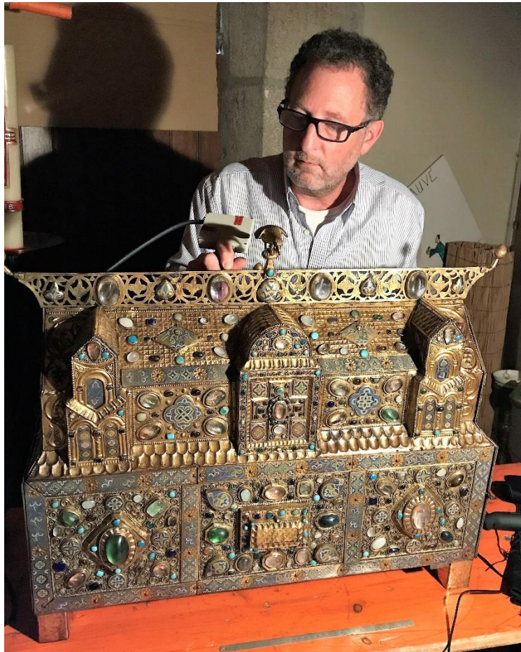
Figure 4. La châsse d'Ambazac en cours d'expertise (H : 0,47 cm; L : 0,70 cm; P : 0,24 cm).

« On compte trois intailles et trente-six bézoards, glacés de bleu de différentes nuances; tout est serti en bâte avec cordonnet à la base de la monture » (Rupin, 1890).