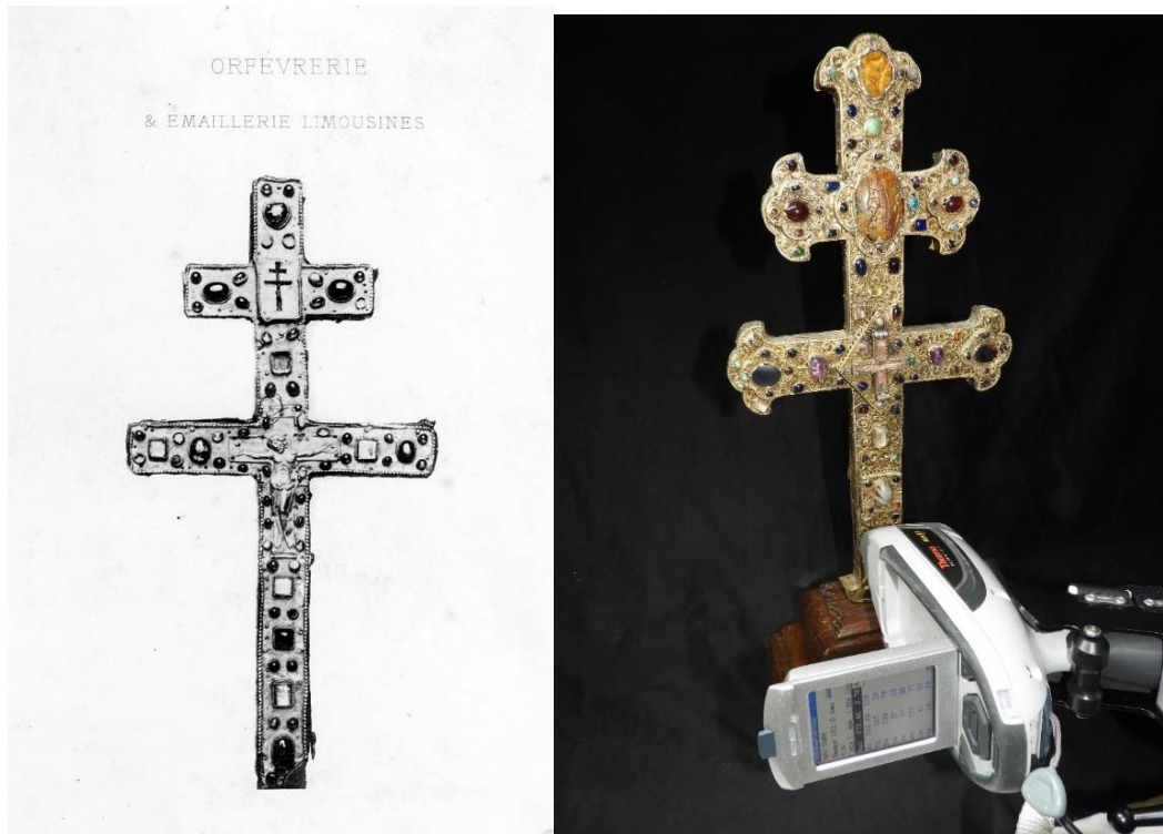
Figure 6. Photographies a) de la Croix d'Aubazine, XIIe siècle, volée en 1905 et non retrouvée à ce jour (H : 0,34 cm; L : 0,16 cm ; Palustre et Barbier de Montault, 1886 b) ; b) la Croix de Gorre (avers) en cours d'analyse par fluorescence X (H : 52 cm , L : 22 cm). Ces deux croix sont décrites avec des « bézoards » sertis, glaçurés de bleu.

La Croix d'Aubazine (ou Obazine en Corrèze) a été volée en 1905 et n'a pas été retrouvée à ce jour. Elle date du XIIe s. (de Lasteyrie, 1884) et Palustre et Barbier de Montault (1886 b) précisent que : « L'attention se porte, aux deux faces, sur deux bézoards , dont un a gardé sa glaçure d'émail bleu clair... » (Figure 6a).