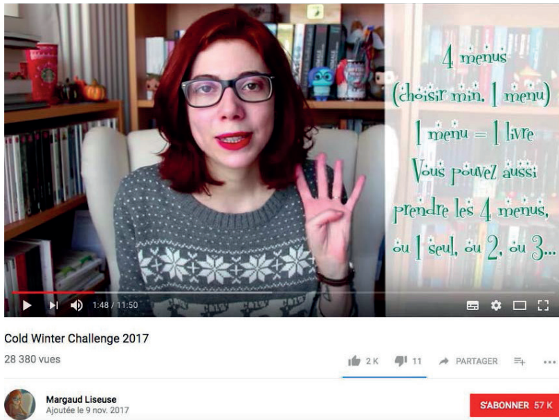
Figure 2. Capture d'écran de la vidéo Cold Winter Challenge, publiée le 9/11/2017 sur la chaîne de Margaud Liseuse