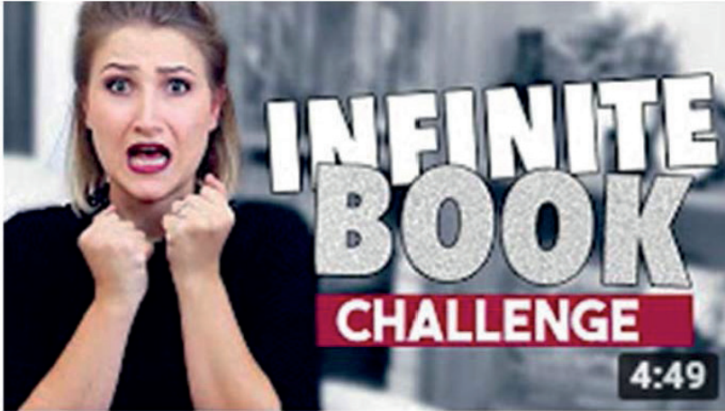
Figure 6. Capture d'écran de la vidéo Infinite Book Challenge publiée le 3 octobre 2015 sur la chaîne de Nine Gorman

l'instar de l' Infinite Book Challenge , qui consiste à énumérer le plus de titres de roman possible en une minute.