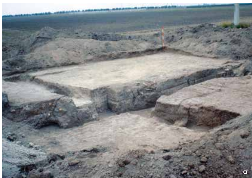
Fig. 3 a, b : Arpi. Le système défensif et son renforcement (ONC 31-32, Fouilles M. Mazzei 1991).

3- Remplissage ou blocage entre deux parements.