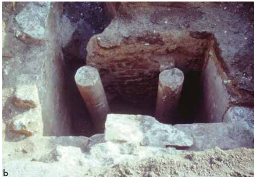
Fig. 9 : Arpi. Systèmes de fermeture en briques d'argile crue : a) aire de la Méduse, tombe à « grotticella » n. 82 ; b) tombe à chambre hypogée en grand appareil de blocs de calcaire de l'ONC37.

aux tombes à « grotticella 11 » et à chambre (fig. 9a-b), ou encore pour le revêtement des parois des dromoi 12 (fig. 10). Des structures similaires sont présentes aussi sur l'habitat d'Ortona (Iker 1995) et à Salapia (Lippolis, Giammatteo 2008).