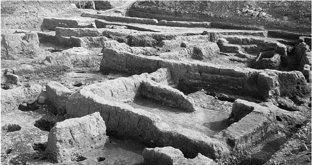
Fig. 6 : Ortona. Vue d'un secteur de l'habitat daunien construit en terre crue (d'après Mertens 1995, fig. 33).