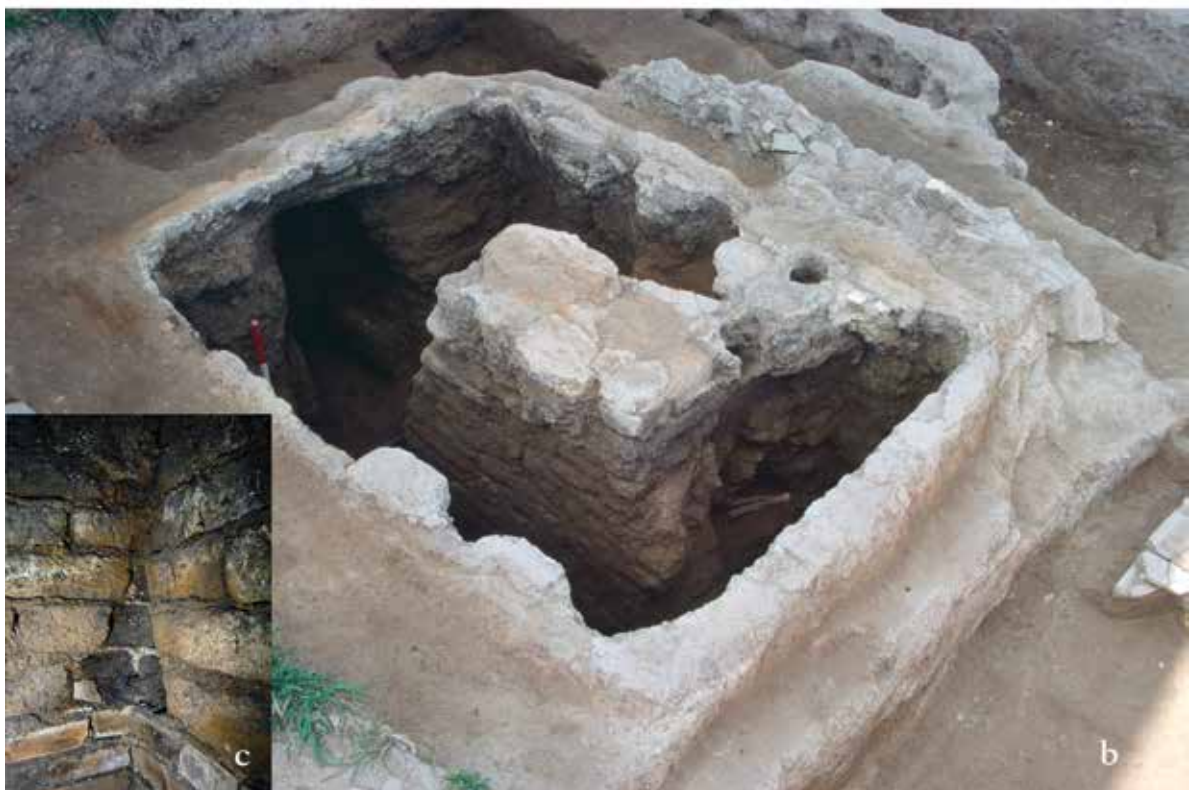
Fig. 8 : Arpi. Structures de production en terre crue : a) vasques dégagées dans le quartier d'habitation de l'ONC 29 ; b) four à tuiles découvert dans la domus dite de « la mosaïque des lions et des panthères » ; c) détail d'une des parois du four en briques d'argile crue et en tuiles.