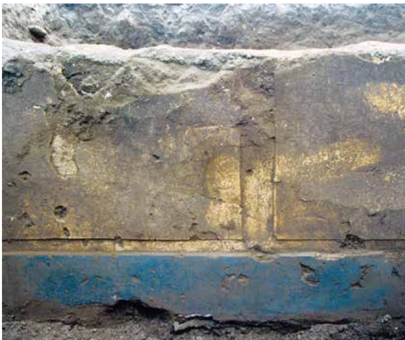
Fig. 7 : Arpi. La domus dite de « la mosaïque des lions et des panthères ». Détail d'un mur en bauge avec revêtement en style structural.

blocs de terre crue avec des jointures impossibles à distinguer » (Iker 1995, p. 53-58 ; Mazzei 1996, p. 340-343) (fig. 6).