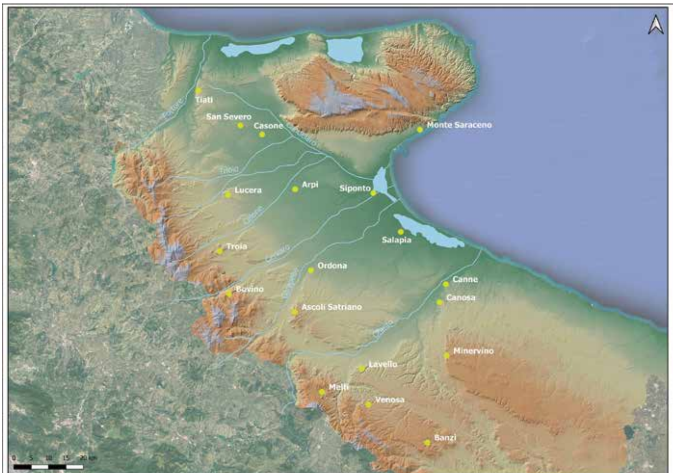
Fig. 1 : Carte de la Daunie (Élaboration L. Fornaciari, DiSPAC, UniSa).

Dans le cadre du programme « Arpi project. Formes et vie d'une cité italote » que conduit depuis 2014 le Centre Jean Bérard en collaboration avec l' Università degli Studi di Salerno et la Soprintendenza Archeologia, Belle Arti e Paesaggio per le Province di Barletta-Andria-Trani e Foggia , les recherches ont porté sur l'ensemble des fouilles réalisées sur cette grande agglomération daunienne depuis les années 1930, et en partie restées inédites (Pouzadoux et al. 2016 ; Pouzadoux et al. 2017 ; Pouzadoux et al. 2019). La reprise de l'étude des données mises au jour a permis d'approfondir et de préciser le palimpseste stratigraphique, d'apprécier les techniques utilisées pour l'architecture domestique et funéraire au cours d'une période allant du IV e au II e siècle av. n. è. et d'ouvrir un volet d'étude sur le milieu naturel et ses ressources.