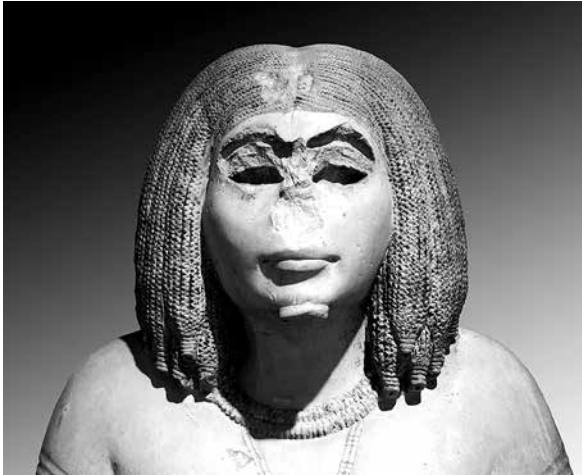
10. Visage de la statue de Youni, provenance : nécropole d'Assiout, New York, Metropolitan Museum of Art, 33.2.1.

a de « vivant » à l'image. Plutôt qu'une intention iconoclaste, il semblerait plutôt s'agir d'une désactivation de la scène ou de l'image, avant la réutilisation de ces blocs prélevés dans la nécropole memphite de l'Ancien Empire et leur réinsertion dans le complexe funéraire royal du Moyen Empire à Licht.