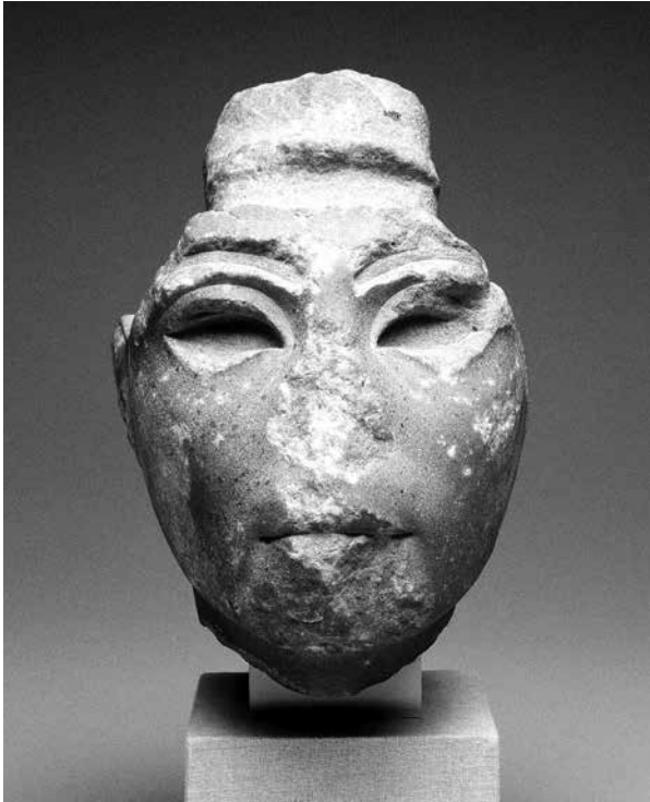
5. Tête d'une statue de Néfertiti, provenance : el-Amarna, New York, Brooklyn Museum, 34.6042.

martelage au niveau des cartouches gravés sur sa poitrine, tandis que les bras et la tête semblent avoir été arrachés. Enfin, la tête d'une statue composite de Néfertiti (34.60) semble avoir été lourdement martelée au niveau du nez et du menton, tandis que les yeux et sourcils, jadis incrustés, ont été dégradés afin d'en retirer les matériaux précieux (fig. 5). Il faut souligner que, comme dans le cas des statues de Hatchepsout mentionnées précédemment, le contexte de découverte des statues d'Amarna permet d'assurer l'antiquité de leurs mutilations.