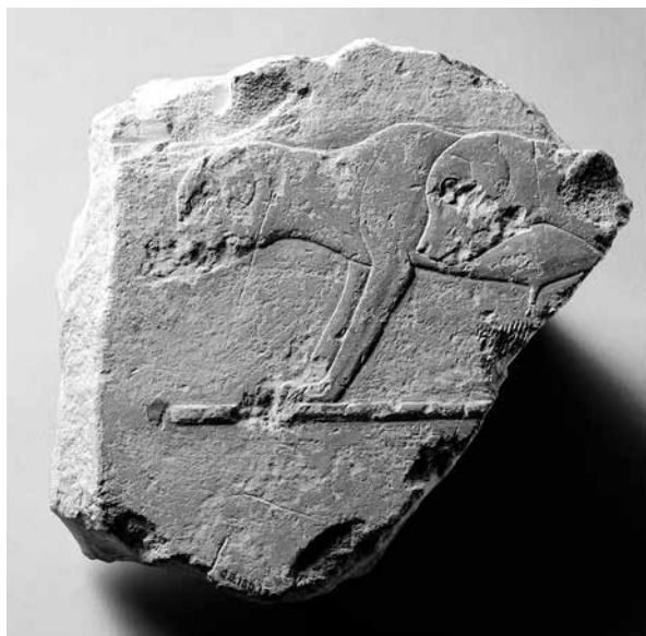
9. Relief montrant deux figures de chiens, mutilées au niveau des yeux et des pattes, fragment d'un monument funéraire de la V e dynastie, mais retrouvé réutilisé dans le complexe funéraire d'Amenemhat I er (XII e dynastie) à Licht, New York, Metropolitan Museum of Art, 09.180.134.