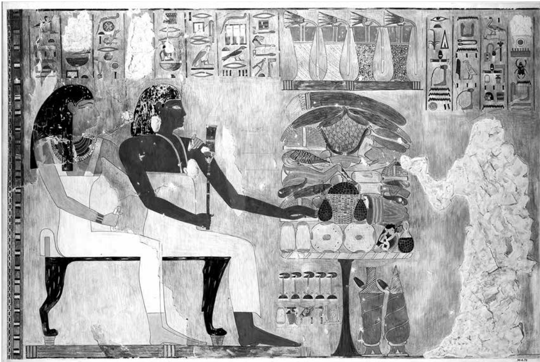
8. Figure mutilée du fils du vizir Rekhmiré présentant des offrandes à ses parents, fac-simile conservé à New York, Metropolitan Museum of Art, 30.4.79.

porteraient des traces. Les invasions assyriennes et perses viennent souvent à l'esprit, même s'il est difficile de déterminer l'impact réel de telles actions militaires (voir les discussions dans l'article de JAMBON, 2016, p. 153-155). Les Égyptiens ont eux-mêmes eu recours à cette pratique symbolique de détruire les statues de leurs ennemis, notam-