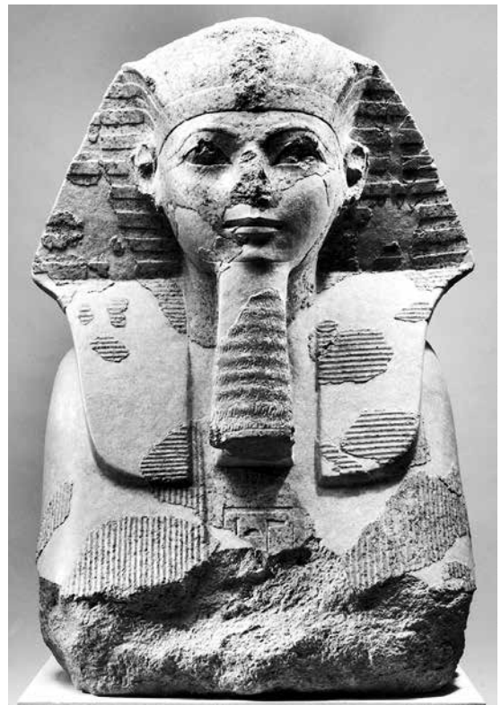
4. Partie frontale d'un sphinx à l'effigie de Hatchepsout, provenance : Deir el-Bahari, New York, Metropolitan Museum of Art, 31.3.167.

Un autre cas bien documenté est celui de la campagne iconoclaste menée à l'encontre des images et mentions du dieu Amon, sous le règne d'Akhenaton (vers 1440 avant J.-C.) puis, en retour, au cours des règnes suivants, à l'encontre de celles d'Akhenaton et de sa famille. Cette dernière offensive à l'encontre des images du souverain a peut-être eu lieu en partie peu après sa mort, afin, en quelque sorte, de se souvenir qu'il fallait l'oublier ou pour des raisons magiques et rituelles, mais également en grande partie à l'époque ramesside, lors du démantèlement des édifices du souverain pour la construction de nouveaux temples (THOMPSON, 2011; BRYAN, 2012). Les très nombreux reliefs et statues qui nous sont parvenus de l'époque amarnienne montrent des traces évidentes de martelage ou de coups répétés. Le bloc du Brooklyn Museum (60.197.6), fragment d'une scène d'offrande au disque solaire Aton, montre une série de coups portés sur des zones très précises : le nez et la bouche du roi, ses bras qui tendent l'offrande au soleil, les cartouches gravés sur sa poitrine. L'inscription a été quant à elle complètement supprimée à coups de ciseau. Le torse d'une statue d'Akhenaton en calcaire conservé dans le même musée (58.2) montre également des traces de