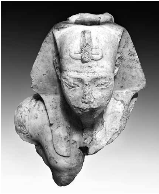
13. Buste d'une statue de Séthi II (XIX e dynastie) découvert à Matariya / Héliopolis au printemps 2017. Mutilations au niveau de la barbe, du nez et de l'uraeus. La mortaise taillée au niveau de la poitrine pourrait être une trace d'ancienne restauration de la statue, à moins qu'elle ne soit une trace de la réutilisation du buste comme bloc dans une maçonnerie.

En conclusion, bien qu'il semble nécessaire de mener de plus amples recherches et même si, dans de nombreux cas, il nous faut simplement accepter notre ignorance, il est certain que divers contextes témoignent de plusieurs phases d'utilisation, de modification ou de mutilation des images à travers toute l'histoire égyptienne. Ces pratiques fournissent, en outre, quantité d'indices qui permettent de comprendre l'importance de la culture visuelle, les utilisations politiques et religieuses des images et la façon dont les membres de différentes cultures et périodes ont réagi face à ces représentations. De telles réactions aux images peuvent être enracinées dans une pensée religieuse ou idéologique, mais aussi motivées par des raisons plus pratiques, comme la réutilisation de matériaux. Elles peuvent consister en initiatives individuelles ou en opérations contrôlées, planifiées par une autorité centralisée. Dans des situations comme l'enfouissement sous le pavement des temples ou dans le cas des statues réemployées dans une maçonnerie, la dégradation des supports du culte est peut-être à considérer beaucoup moins négativement que dans le cas de la damnatio memoriae ou de l'iconoclasme des premiers siècles de la période chrétienne, mais plutôt comme une nécessité pratique : l'image égyptienne, magique et capable d'action, doit être privée de ses facultés avant d'être extraite de son contexte architectural et rituel. La mutilation serait alors