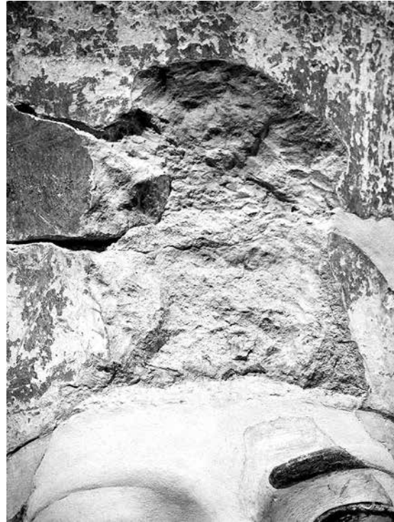
3a-b. Tête d'une statue jubilaire de Hatchepsout [a] et détail de l'uraeus mutilé à coups de ciseau [b], provenance : Deir el-Bahari, New York, Metropolitan Museum of Art, 31.3.153.

jubilaires de Hatchepsout (par exemple, New York, MMA 31.3.153, fig. 3a-b ), le serpent uraeus qui se dressait au front du souverain a été arraché au moyen de coups de ciseau, clairement visibles. En revanche, dans le cas de statues et bas-reliefs en pierres dures (granit, granodiorite, grauwacke, quartzite, pour ne citer que les plus courantes),