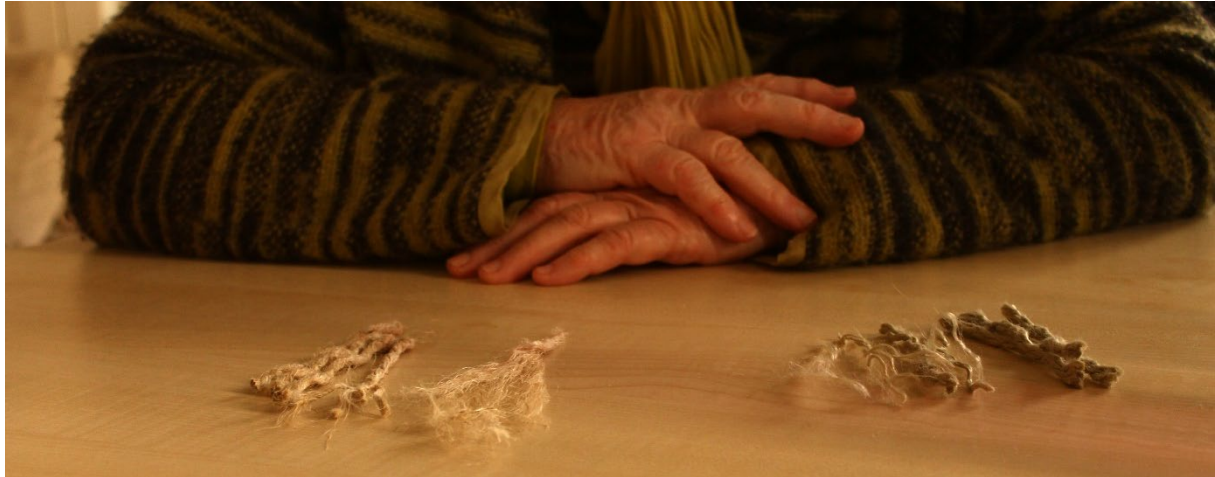
Discussion autour des cordes (chanvre à gauche et polyester à droite) qui composent les deux installations.