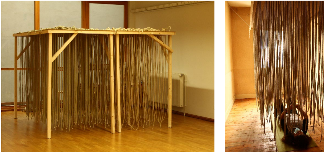
A gauche, « Espaces qui touchent » installé comme premier essai dans une salle de psychomotricité, à l'aide de poteaux. A droite, installation définitive du dispositif, cette fois-ci suspendu, dans le bâtiment du Grand Collectif.

L'expérience a été installée dans les bâtiments cédés par la mairie de Grenoble au Grand Collectif 29 . Les deux dispositifs ont été installés dans deux appartements d'un même étage, dans deux chambres de la même taille (environ 4 m x 3 m) et suspendus à 2,5 m de hauteur.