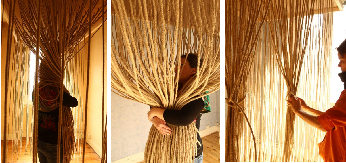
Actions du participant pendant l'exploration du dispositif.