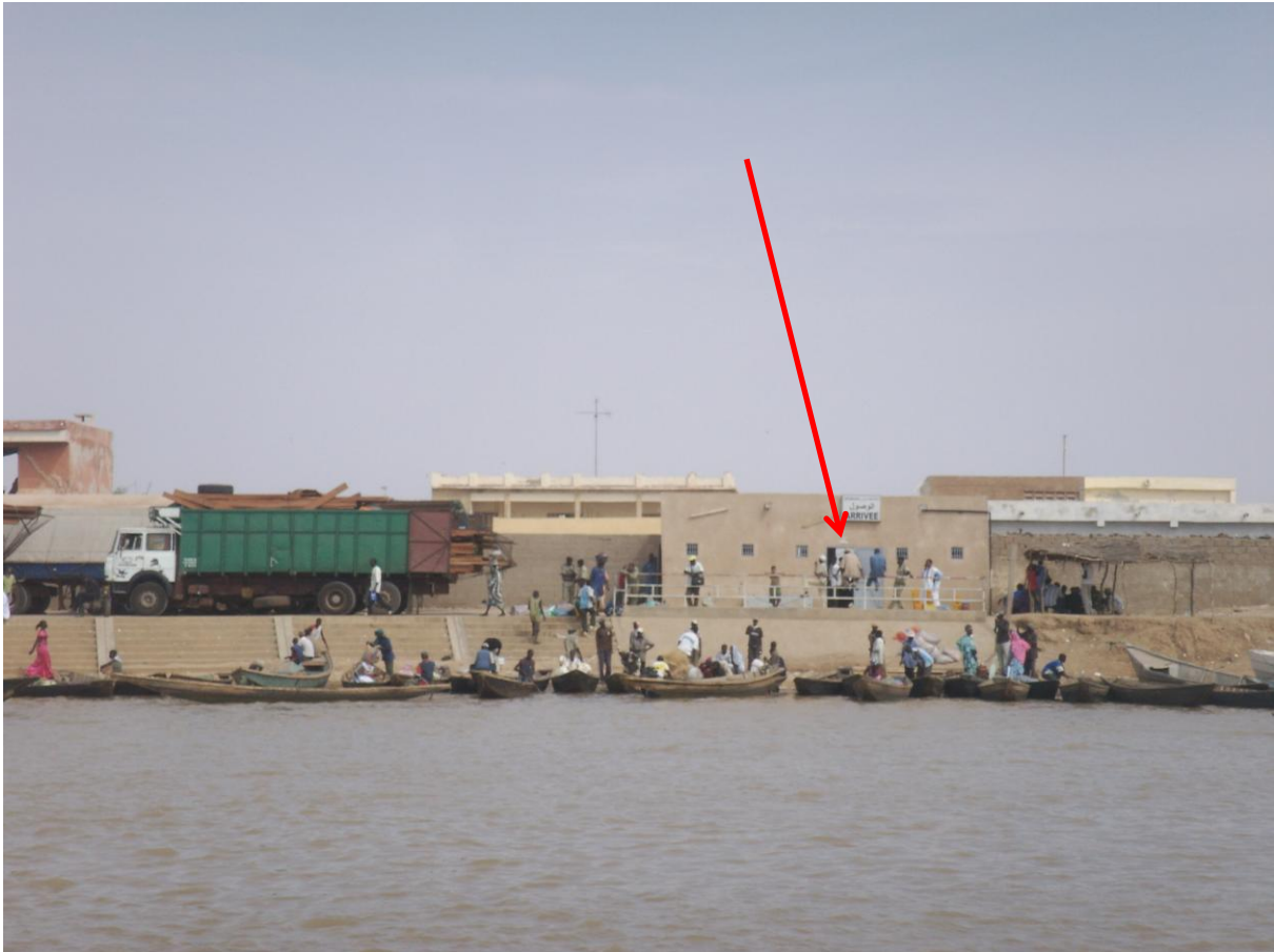
Photo 1 : Rosso-Mauritanie face au Sénégal ou comment franchir la porte de la frontière pour les voyageurs