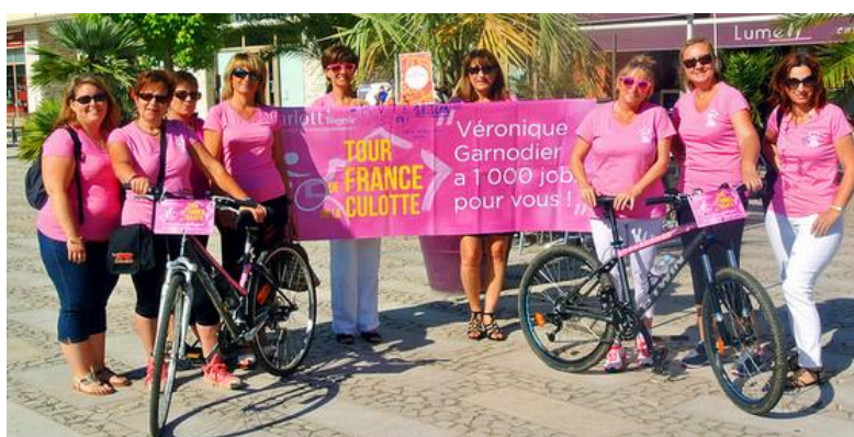
Le nouveau maillot du CC Charlott'