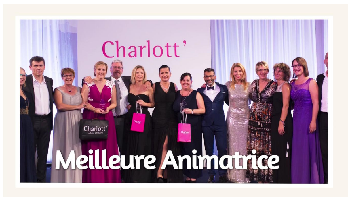
Prix de la meilleure animatrice lors du Gale 2017 à Athènes