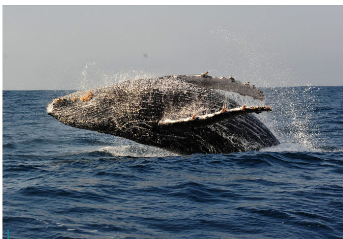
Le bruit est un facteur de stress pour tous les animaux marins...

La figure révèle les plages approximatives de production sonore et d'audition des taxons marins et des plages de fréquences de certaines sources sonores anthropiques. Ces plages représentent l'énergie acoustique sur la plage de fréquence dominante de la source sonore, et l'ombrage des couleurs correspond approximativement à la bande d'énergie dominante de chaque source.