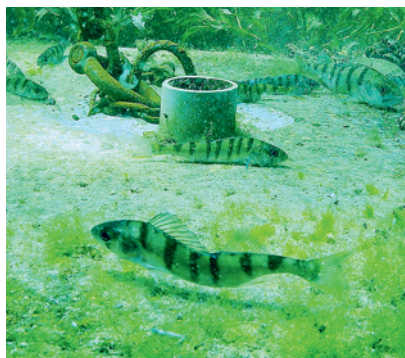
Perches malformées observées dans le Léman.