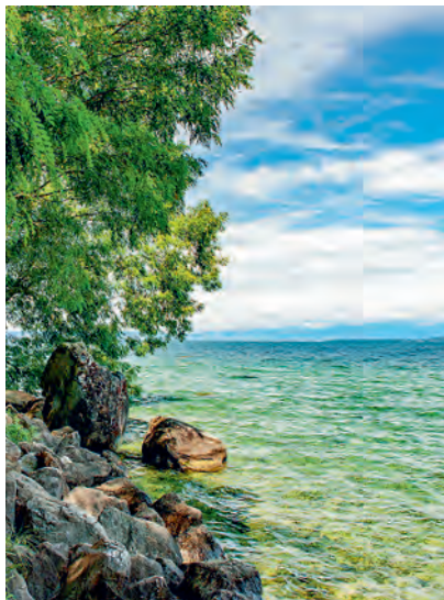
Une publication du Centre de la Nature Montagnarde