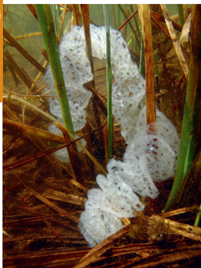
Ruban de perche (pontes), pouvant contenir plusieurs dizaines à centaines de milliers d'œufs.

Comme le sandre (un proche parent), la perche présente deux nageoires dorsales séparées, hautes et contiguës. La première nageoire est plus haute et plus longue que la seconde, avec des rayons épineux, tandis que ce sont des rayons mous qui composent la deuxième. Outre la nage, déployées activement et volontairement, elles servent à communiquer et à dissuader les prédateurs.