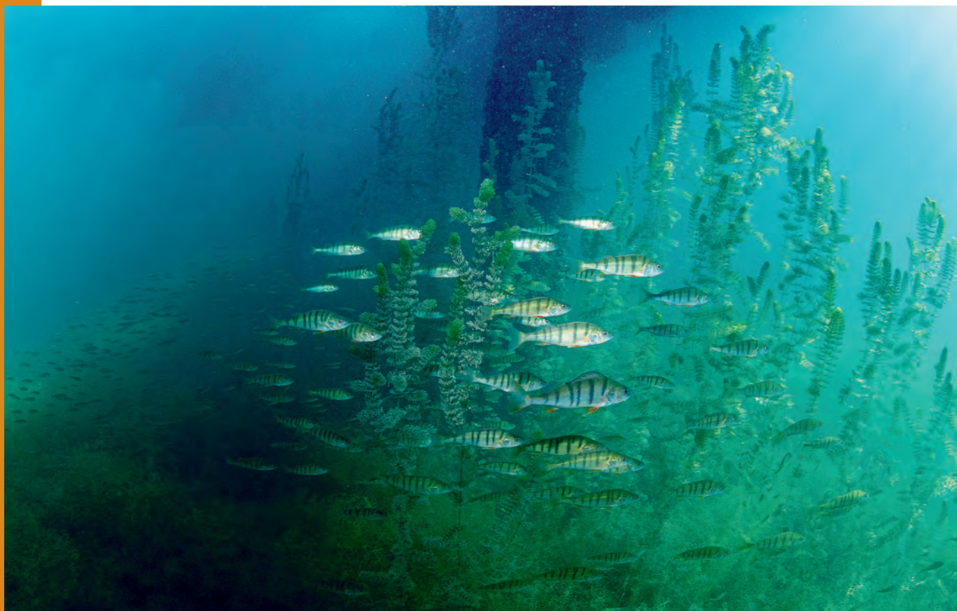
Banc de perches, observé habituellement en été en proche surface.

La perche commune ou eurasienne ( Perca fluviatilis ) est un animal bien connu, remarquable à bien des égards et emblématique des grands lacs péri-alpins. Au cours de l'été 2021, un constat a été fait par des plongeurs : la proportion de poissons avec une malformation, caractérisée par un creux dorsal leur donnant une forme « tordue », a été relativement importante.