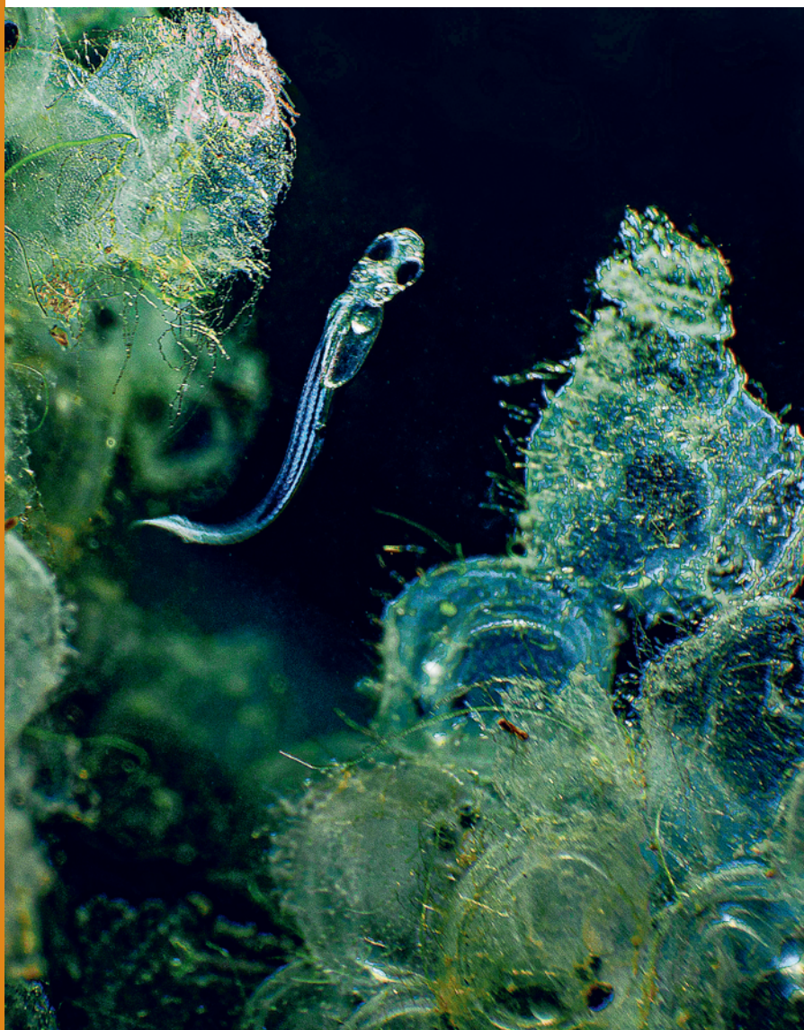
Alevin de perche juste éclos. La température de l'eau pendant la phase embryonnaire est critique.