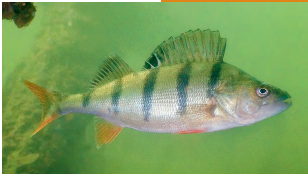
Photo de l'animal prise dans le Léman. Température et ressources trophiques seront deux facteurs de forçage importants pour expliquer le succès de développement des larves, puis la croissance des juvéniles et observer au final un adulte comme celui-ci.

De plus, un suivi de la reproduction effectué depuis plus de 35 ans à l'aide de frayères artificielles placées devant