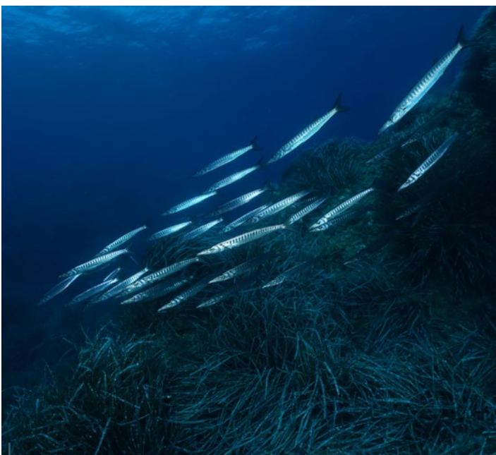
Les rencontres avec des nuées de barracudas ne sont pas rares.