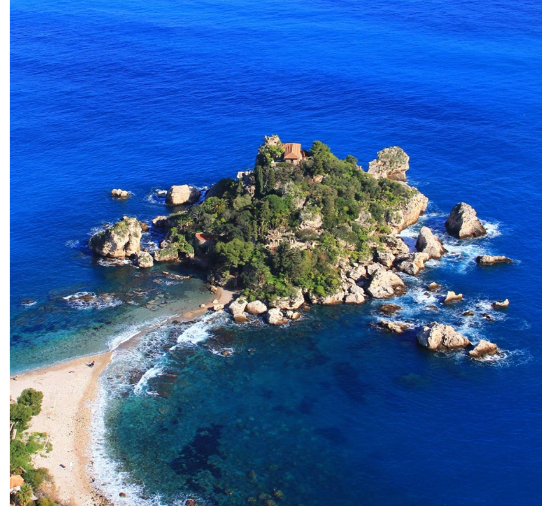
La courte distance qui sépare Isola bella du rivage s'annule parfois lors des marées, lui donnant alors un statut de presque île. Elle est aussi appelée la Perle de la Méditerranée et est un lieu de plongée apprécié.