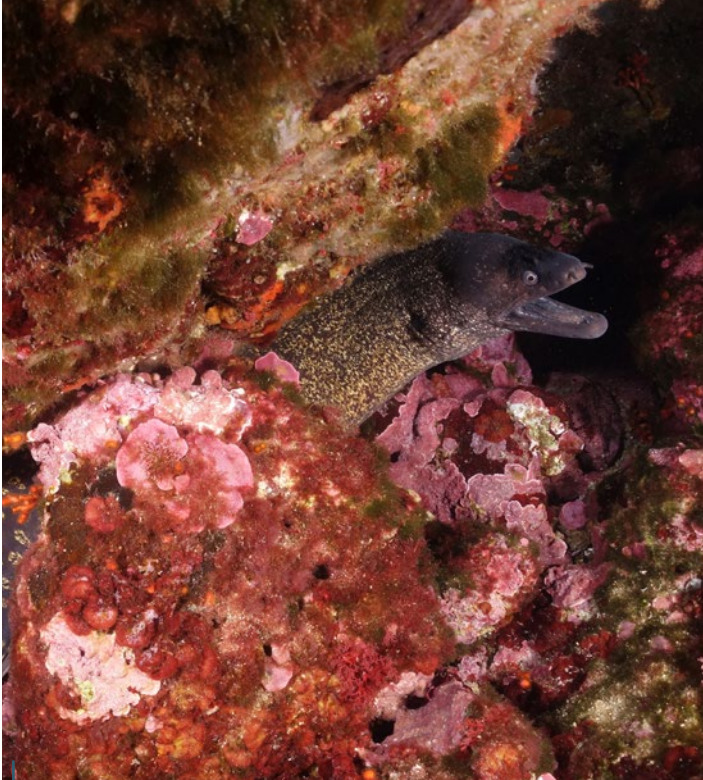
Les murènes communes ( Murena helena ), typiques de Méditerranée, sont nombreuses.