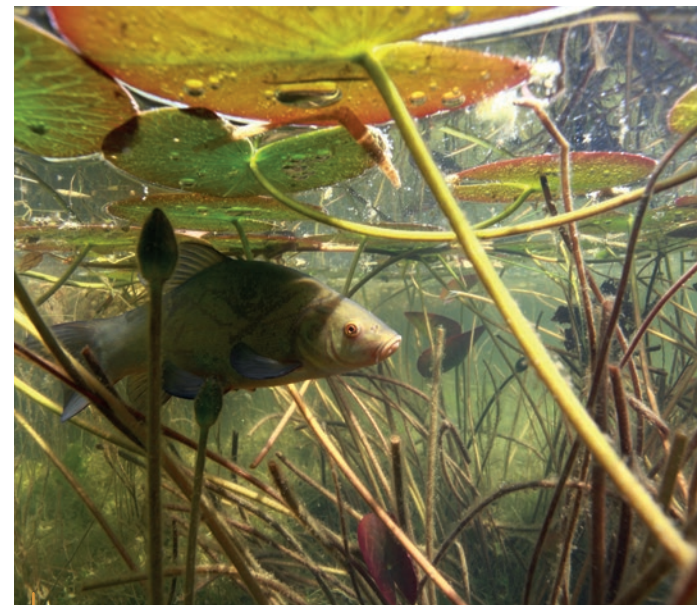
Une tanche sous les nymphéas.

Ici, j'ai souhaité regrouper et interroger quelques personnes bien connues du monde animalier et de la plongée locale pour saisir ce qu'elles savent du lac du Bourget et ce qu'il leur inspire. Cette journée passée au bord de l'eau a été riche et passionnante. Je fais le pari que leurs témoignages vous donneront envie de venir plonger dans ce magnifique écosystème et d'en savoir plus sur lui.