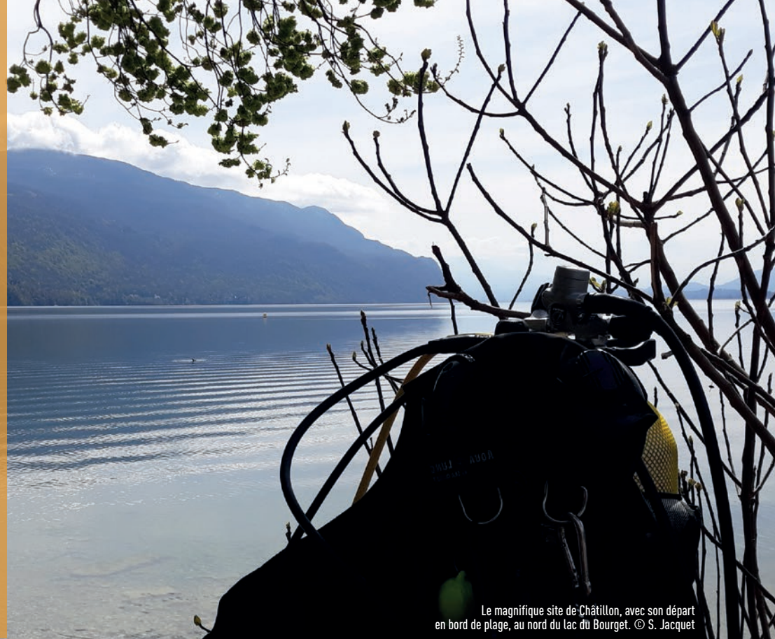
Le magnifique site de Châtillon, avec son départ en bord de plage, au nord du lac du Bourget.

C'est le plus grand lac naturel profond français. Sa beauté et ses mensurations ont inspiré bon nombre d'auteurs et de poètes au fil du temps. Aujourd'hui restauré et protégé, il est l'un des grands lacs périalpins (avec Aigueblette, Annecy, le Léman) qui est ausculté et suivi scientifiquement depuis plusieurs décennies. Stéphane Jacquet s'est entretenu avec des personnalités qui le fréquentent régulièrement, l'occasion de mettre en avant ce magnifique écosystème, de voir comment il est perçu, ce qu'il inspire et les enjeux qu'il porte.