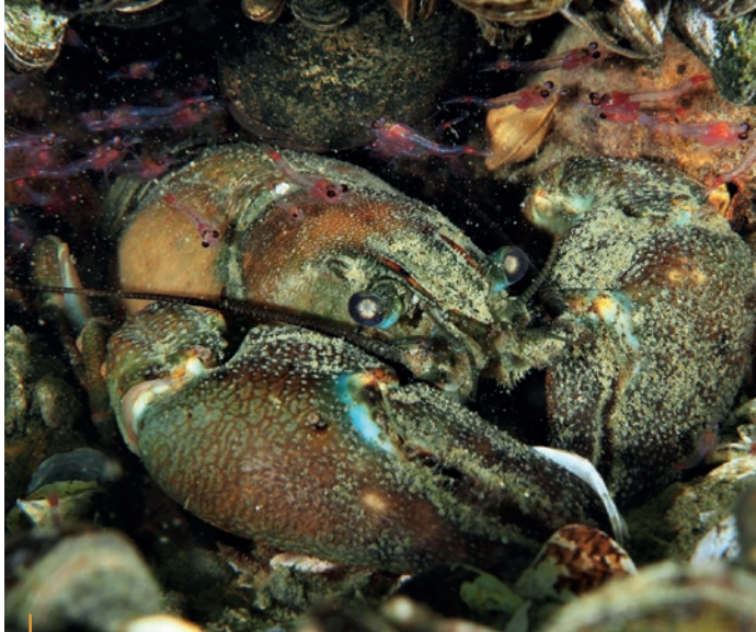
Une écrevisse entourée de deux espèces exotiques envahissantes désormais bien implantées dans le lac du Bourget, la moule quagga et la petite corvette rouge sang.

> André La vision du lac offerte par ces interviews est intéressante et pertinente. Elle mérite aussi d'être complétée. Ainsi, sur le lac du Bourget, site d'intérêt européen (Natura 2000) dont le CEN est animateur, nous travaillons en synergie avec le CISALB, la DDT et le Conservatoire du littoral. Ainsi la cartographie de la végétation (herbiers subaquatiques et roselières) a-t-elle été mise à jour en 2021 (confirmant la progression de la végétation, signe de qualité d'eau et de transparence). Nous avons également réalisé une bathymétrie de la zone littorale, en vue d'une campagne de piquetage des roselières (renouvellement ou extension de zones de quiétude). Enfin, après avoir obtenu que soit rendu au lac un niveau bas tous les 4 ans, nous souhaitons que soit étudiée la possibilité de lui rendre ses niveaux hauts de printemps-été, qu'il a perdus suite à leur régulation en 1982, ce qui aggrave les problèmes d'érosion, d'invasives, d'embroussaillage et de réchauffement! 🐟