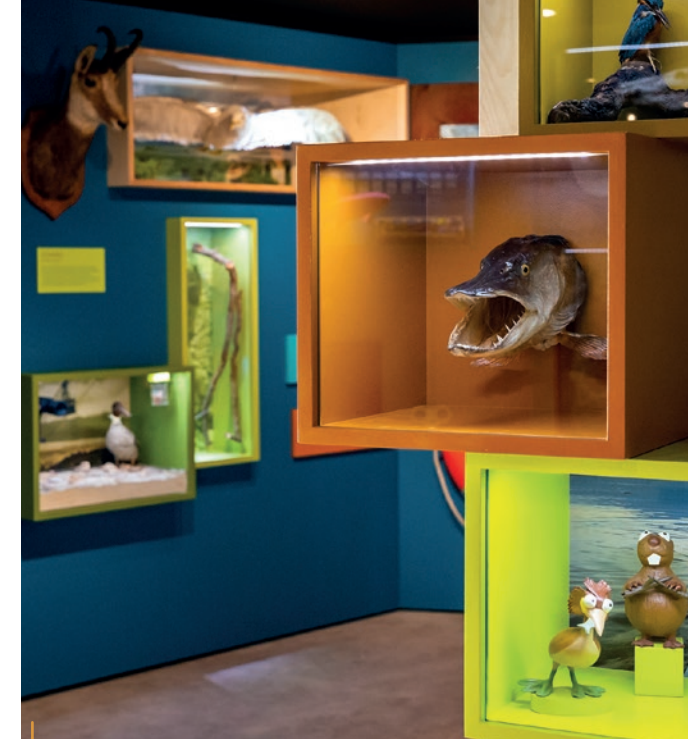
Le centre Aqualis propose des découvertes culturelles et scientifiques toute l'année, pour tous.

> Patrice J'aime bien l'idée que pour aimer, il faut connaître. Il y a longtemps, j'avais commencé à imaginer un séjour court, un week-end, permettant d'apprécier pour les plongeurs trois lacs (Paladru, Annecy et Bourget). En fait, il s'agissait de proposer une sortie familiale avec plongées et visites de sites remarquables (la vieille ville à Annecy, Aix-les-Bains et son aquarium, le musée parlant des citées lacustres à Paladru). J'ai vu que cette idée a été récemment reprise sous la forme « 3 jours, 3 lacs » avec le Léman plutôt que Paladru, mais toujours avec le Bourget! Ce genre de démarche auprès de plongeurs me semble vraiment approprié pour faire aimer et découvrir ces écosystèmes.