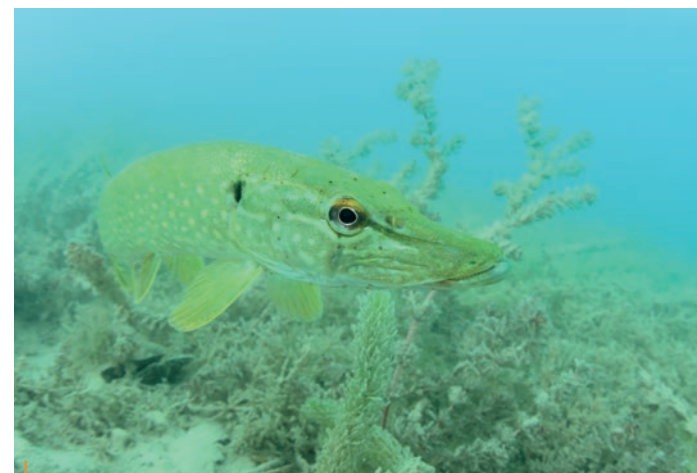
La rencontre avec l'un des seigneurs du lac, le brochet.

> Stéphane Je connais les grandes lignes mais ne suis pas spécialiste. Je sais que le lac du Bourget est un lac d'origine glaciaire et qu'il abrite une faune typique des grands lacs alpins très profonds. Évidemment, je parle ici de l'omble chevalier, du corégone (qu'on appelle lavaret ici), des perches dont les bancs en été peuvent être très impressionnants. Comme je prépare un documentaire sur le silure (« Les dents de la mare ») j'ai cherché ce magnifique poisson dans le Bourget et j'y ai trouvé un très beau spécimen faisant près de 2 mètres. Je plonge souvent avec lui et force est de constater que j'ai découvert un géant à la force tranquille, paisible, majestueux. Bien