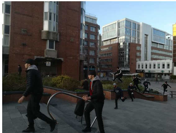
Figure 4 : Ignorance des passants envers les traceurs. Photos et réalisation : Robin Lesné, 2019.