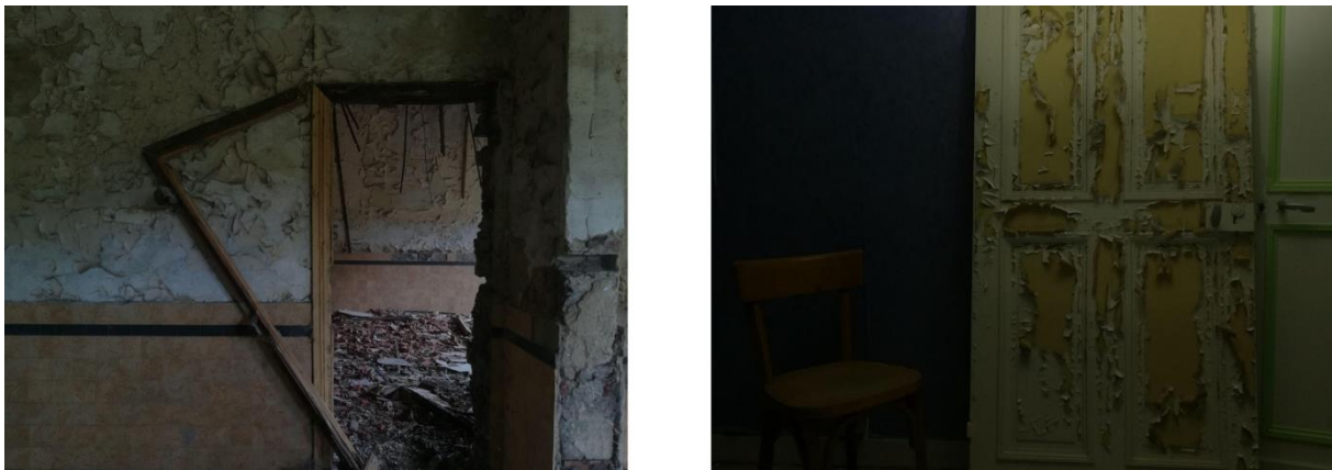
Figure 8 : S'émerveiller de scènes banales telles que les portes. Photos : Robin Lesné, 2019.

Deuxièmement, l'immersion parmi les explorateurs et les traceurs a permis de confirmer et de mieux comprendre la dimension esthétique de leurs pratiques. Par la promotion d'un rapport à la ville intégrant une forme de flânerie, elles procèdent à une esthétisation de l'espace qu'il est possible de distinguer lorsqu'une chorégraphie est construite afin de préparer une ligne de figures de parkour ou lorsqu'une exploration donne lieu à des formes d'extase de la contemplation par prise de conscience de la beauté de certains détails « banals » (Figure 7). À ce titre, Blanc (2010) décrit l'appréciation de l'habitabilité d'un lieu comme le fait de profiter des dimensions sensibles, sensorielles, imaginatives et significatives qui forment le rapport esthétique à l'environnement.