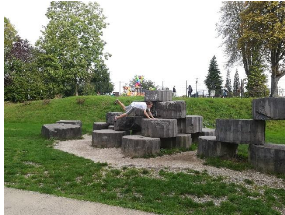
Figure 3 : La sculpture, objet d'admiration et de pause, mais aussi structure de jeu. Photo : Robin Lesné, 2019.

Une fois cette acceptation de la dimension constructive et positive de la transgression opérée, il est possible, dans un deuxième temps, de comprendre plus précisément ce qu'elle contribue à « construire ». Pour les édiles dont le discours s'attache au caractère citoyen des actions des pratiquants, le détournement spatial – l'acte transgressif – se fait de manière respectueuse et participe, en cela, d'une révélation des potentiels d'usage imprévus. La transgression est ici, à l'instar de Bonnett (1996), perçue comme une action politique en ce qu'elle met à jour l'ordre spatial organisant les possibilités et interdits, s'en détache, en construit d'autres et modifie les significations des lieux. Paradoxalement, là où Cresswell (1996) voit un dérangement des « dominants » dans la transgression, Loo et Bunnell (2017) écrivent, plus de deux décennies après, qu'au contraire, la démarche non confrontationnelle du parkour et sa capacité à inciter à l'exploration de modes alternatifs d'interprétation des contraintes correspond, dans une certaine mesure, aux attentes des pouvoirs publics. Ils citent l'exemple de Singapour où la municipalité promeut la capacité des jeunes à « réinventer » leur environnement du fait qu'elle contribue à diffuser une image du jeune citoyen qui veut avancer, qui est autant discipliné que flexible dans sa démarche et qui présente une qualité créative dans sa gestion du dépassement des contraintes et obstacles.