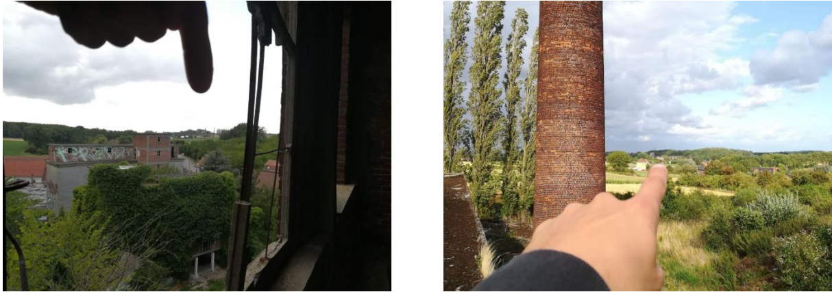
Figure 6 : D'un spot à l'autre, flânerie hasardeuse au cours d'un après-midi d'urbex. Photos : Robin Lesné, 2019.