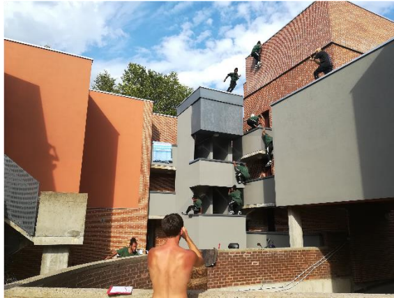
Figure 5 : Session typique du stade « Intégration de la différence », entre interactions avec les riverains et acceptation du parkour. Photos et réalisation : Robin Lesné, 2019.

Ainsi se pose finalement la question de l'habiter récréatif comme convergence du ludique et du sérieux dans l'habiter. Le jeu n'est pas si séparé de la quotidienneté mais plutôt profondément ancré en elle (Stevens, 2007) ; aussi ne s'agit-il pas tant d'une convergence que d'une reconnaissance de la dimension également ludique propre à l'habiter et qui lui est inhérente. Parce que l'habitabilité correspond à une « capacité géographique des habitants à transformer un espace urbain délaissé en un espace habité » (Bessy et al. , 2017, p. 32), la pratique récréative constitue un mode privilégié d'habiter en ce qu'elle est source d'appropriation corporelle, sensible et symbolique. Autrement dit, l'habiter récréatif est cette façon de s'approprier et de cohabiter l'espace en considérant que la récréation n'en est pas seulement une manière de l'exploiter mais bien de le construire et de se construire par la même occasion à travers une expérience spatiale partagée récréative et recreative.