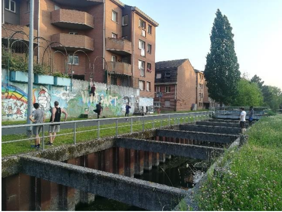
Figure 9 : Le canal de Wasquehal, lieu de promenade et de street art désormais lieu de vertige.

puisque, dans le cas de l'urbex, « l'exploration peut être pour certains un moyen d'éprouver la solitude, un moyen de se faire peur, ou tout simplement un moyen d'habiter temporairement et de manière ludique certains sites abandonnés de toute activité sociale » (Lebreton, 2015a, p. 47). Finalement, pour reprendre Corneloup (2016), une habitabilité récréative basée sur des expériences alternatives de la vie en société émerge pour la ville et forge, en cela, l'habiter récréatif.