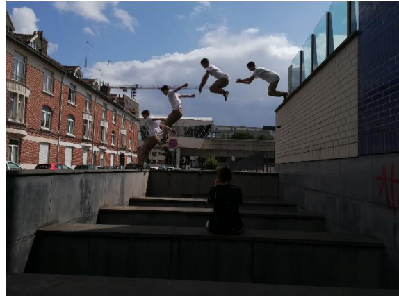
Figure 10 : Une sortie de parking souterrain, défi d'un quart d'heure. Photos et réalisation : Robin Lesné, 2019.