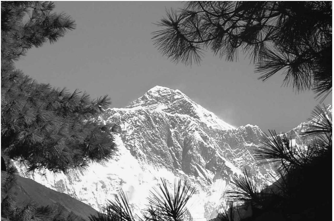
Khumbi Yulha, the guardian deity of Khumbu, cloaked in monsoon clouds