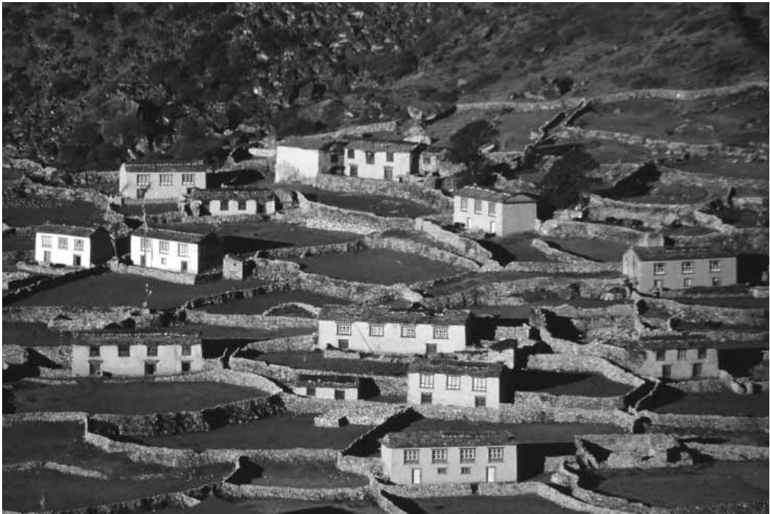
Khumjung village with Mt. Amadablam in the background