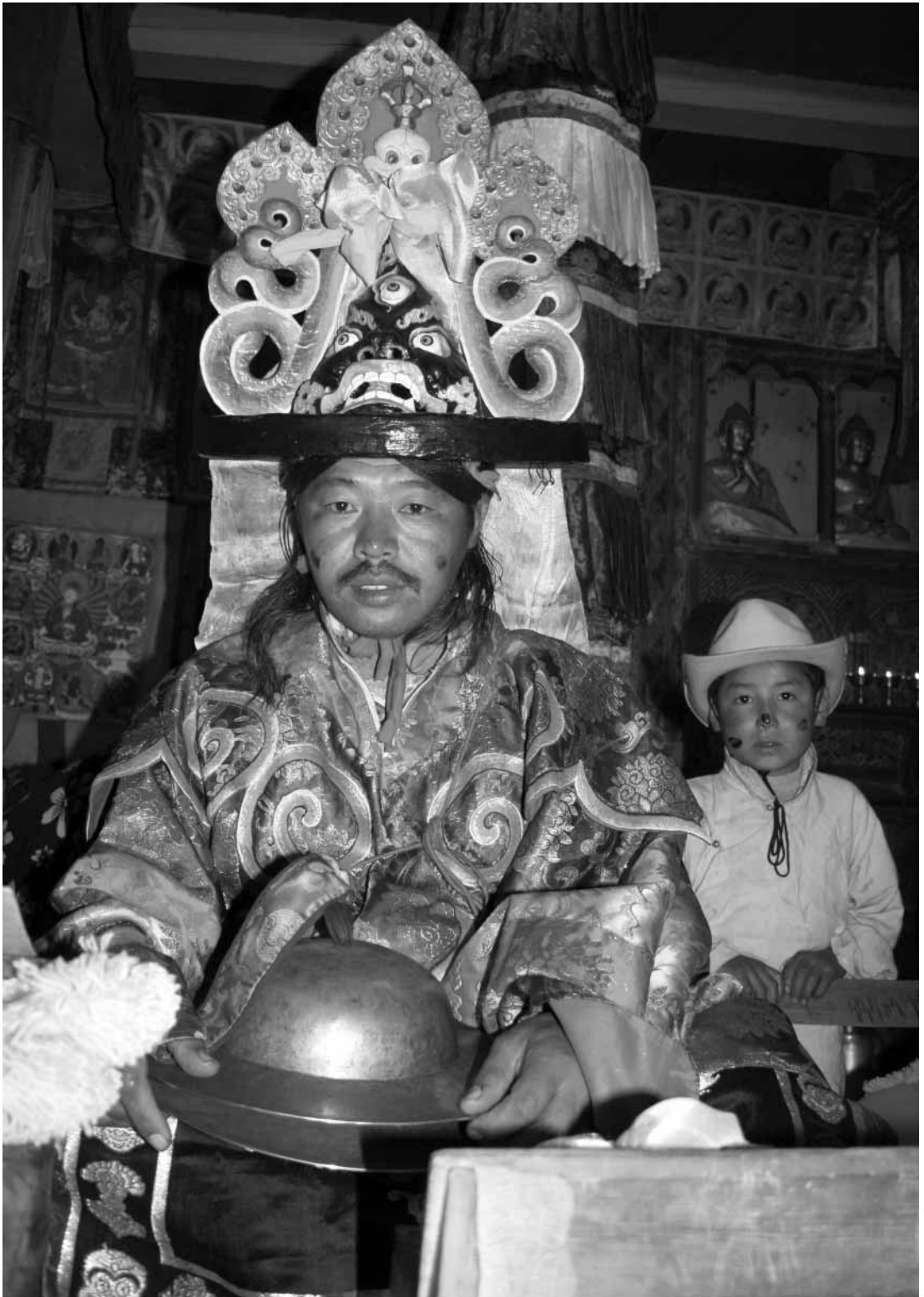
A monk dressed to perform black-hat dance