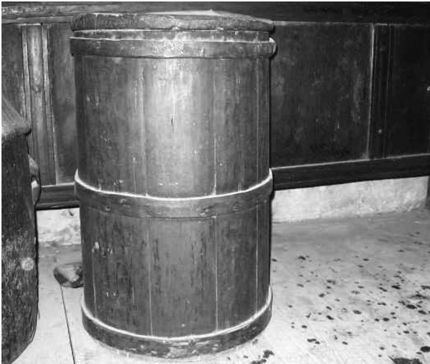
Sherpa wedding cake alongside with a chang bottle