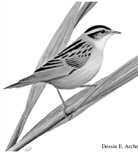
Dessin E. Archer

halte migratoire de 7 jours pour le Phragmite aquatique et le Phragmite des joncs et une durée de 10 jours pour la Rousserolle effarvate et la Gorgebleue. Nos recherches ont permis de situer le site de Donges comme lieu de halte migratoire privilégié au sein de l'estuaire de la Loire.