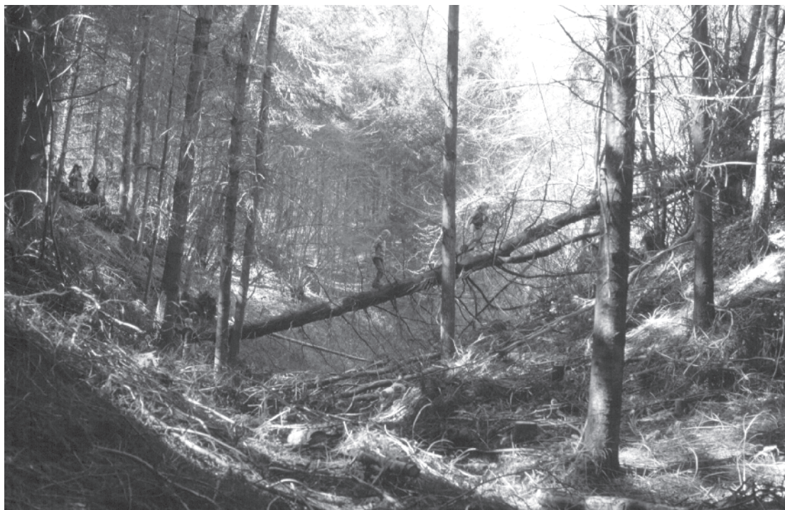
3. Recherche des minières protohistoriques en Morvan. Minière en tranchée dans les bois, commune d'Arleuf (58).

Les trouvailles d’objets de l’âge du Bronze signalées depuis le XIX e siècle en Morvan se situent toutes à proximité de ces zones minières. On peut, par analogie, penser qu’une activité métallurgique s’est développée dans le Morvan à l’image de celle que l’on connaît dans le Massif armoricain à la formation géologique semblable. Ces travaux miniers sont un début d’explication à l’implantation d’oppida comme le Fou de Verdun, Bibracte, le vieux Dun, en plein centre de notre vieux massif. Ces richesses métalliques du Morvan longtemps oubliées sont une des bases de la richesse du peuple éduen à l’époque gauloise.