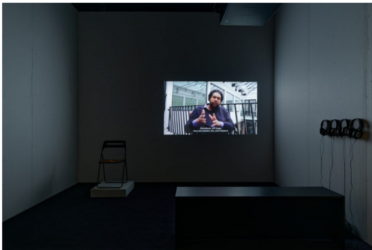
Vue de l'exposition « Les racines poussent aussi dans le béton », Mac Val, Vitry-sur-Seine, 2018. Kader Attia, L'héritage du corps, Le corps post-colonial, (video HD, couleur, Son, 48 minutes, 2018 (c.f site de l'artiste http://kaderattia.de

. Comme Kader Attia le souligne dans un entretien récent, les images de l'interpellation de Théodore Luhaka sont invisibles dans la temporalité de la diffusion proposée par le système médiatique 30 . L'espace du musée devient donc l'espace où, à partir de la perception d'un agencement temporel différent de l'information, une histoire se transforme — les temps des entretiens filmés et le contexte offert par les installations qui accompagnent la vidéo dévoilent les images de l'interpellation policière sans supprimer notre exposition à la contingence de l'histoire dans laquelle surgit un événement. La critique du système médiatique de l'information s'inscrit dans la possibilité de saisir le fonctionnement de nos dispositifs, non pas en direction d'une anesthésie de nos émotions , mais comme une extension du paradigme de notre corporéité dans ce qu'elle nourrit de primordial : une opacité qui est constitutive de la naissance de nos idées. Toute perception s'offre dans un rythme temporel , dans un agencement visuel et sonore, comme Merleau-Ponty le souligne dans sa conférence sur le cinéma : « La parole, au cinéma, n'est pas chargée d'ajouter des idées aux images, ni la musique des sentiments. L'ensemble nous dit quelque chose de très précis qui n'est ni une pensée, ni un rappel des sentiments de la vie » 31 . L'image ne signifie pas d'elle-même mais dans l'agencement de l'ensemble qui fait que « le film ne se pense pas, il se perçoit » 32