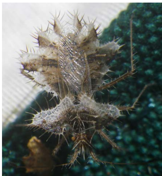
Fig. 1 - Phyllomorpha laciniata adulte trouvé à Argut-Dessous (31), le 7 septembre 2016.

Du point de vue comportemental, on peut signaler un trait de vie assez original et peu courant. Chez cette punaise, comme chez les punaises aquatiques nommées Bélostomes, c'est le mâle qui transporte les oeufs sur son dos avant la naissance des larves.