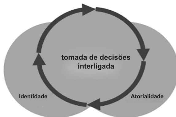
Figura 1: Graus de organizacionalidade entitativa