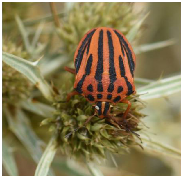
Fig. 2 - Graphosoma semipunctatum (Fabricius, 1775) observé le 18 août 2019.

au nord de son aire de distribution. En contre partie Putshkov dans Lupoli & Dusoulrier (1961) la décrit comme très commune en Crimée sur les bords de la Mer Noire.