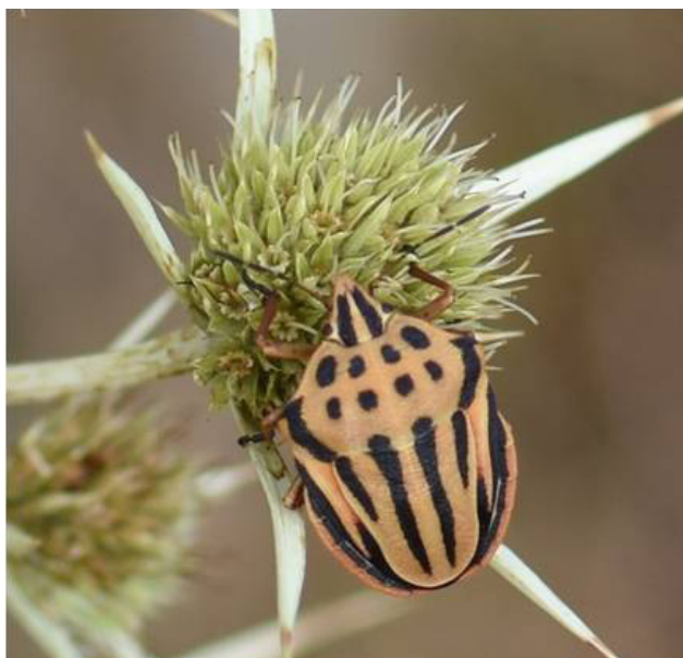
Fig. 1 - Graphosoma semipunctatum (Fabricius, 1775) observé le 29 août 2018.