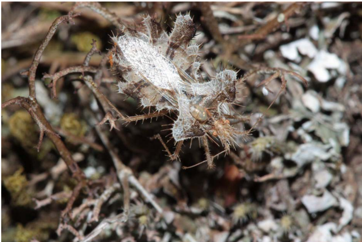
Fig. 4 : mâle adulte avec œuf porté sur le dos, à Pampelonne, Tarn.