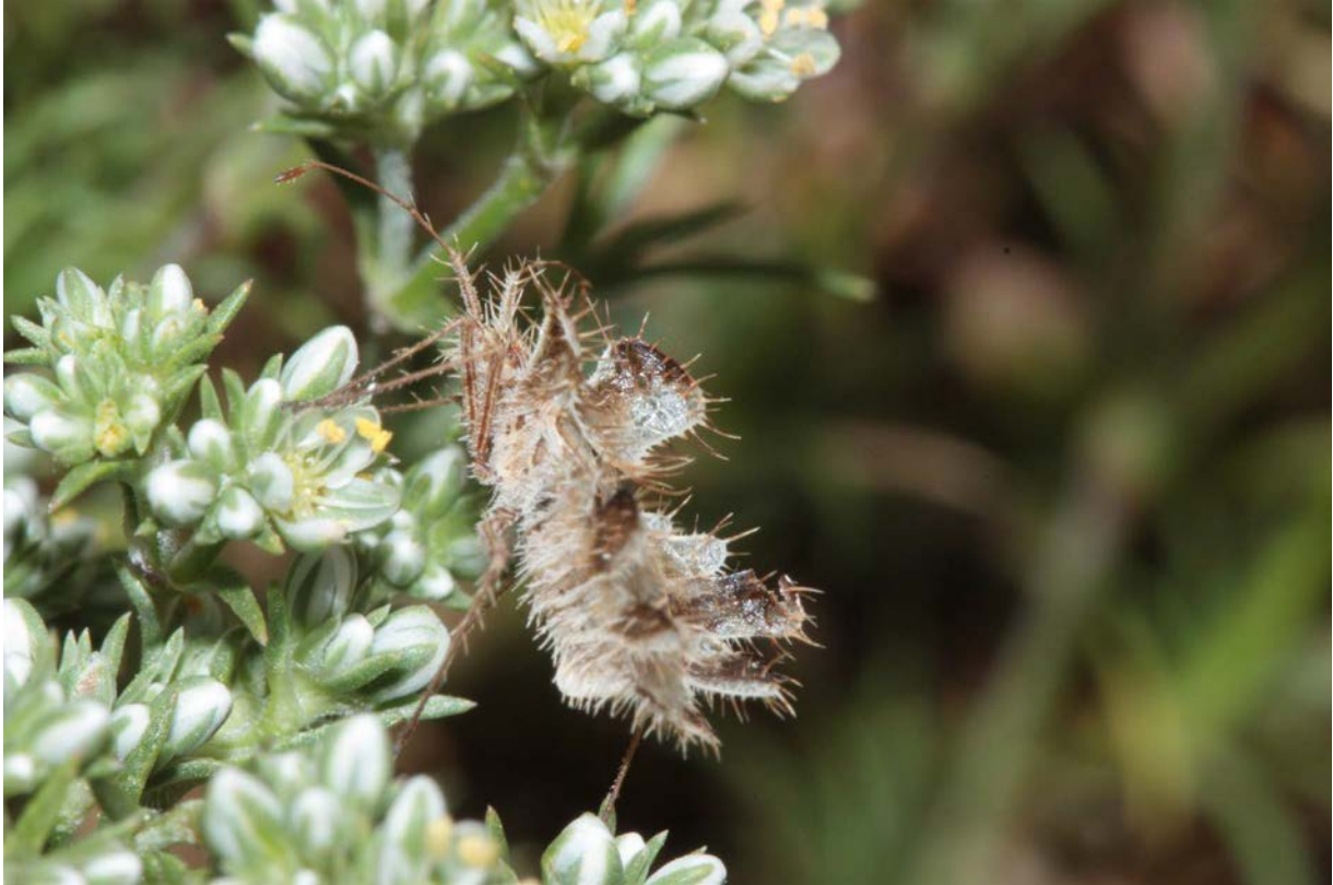
Fig. 3 : Adulte posé sur sa plante-hôte Scleranthus perennis à Pampelonne, Tarn.