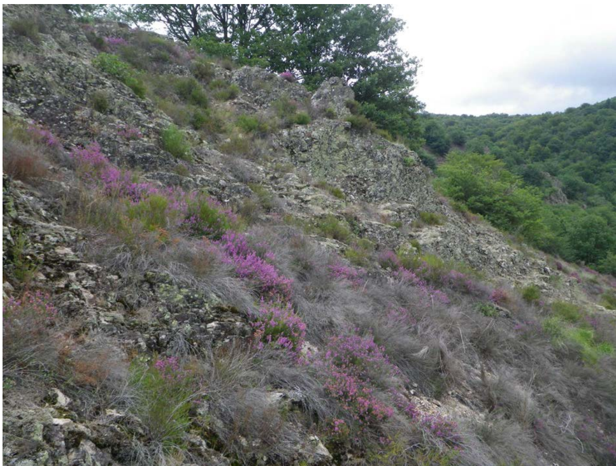
Fig. 5 : Aspect de la station de Phyllomorpha laciniata à Gorses, Lot.

même que toutes les zones métamorphiques du Massif Central à partir de 300 m d'altitude, sont donc potentiellement très favorables. Les recherches sont à mener avant tout dans et autour des pieds de S. perennis . Si la météo n'est pas assez chaude pour rendre « actifs » ces insectes, une inspection sous les pierres à proximité de ces plantes pourrait aider à en découvrir.