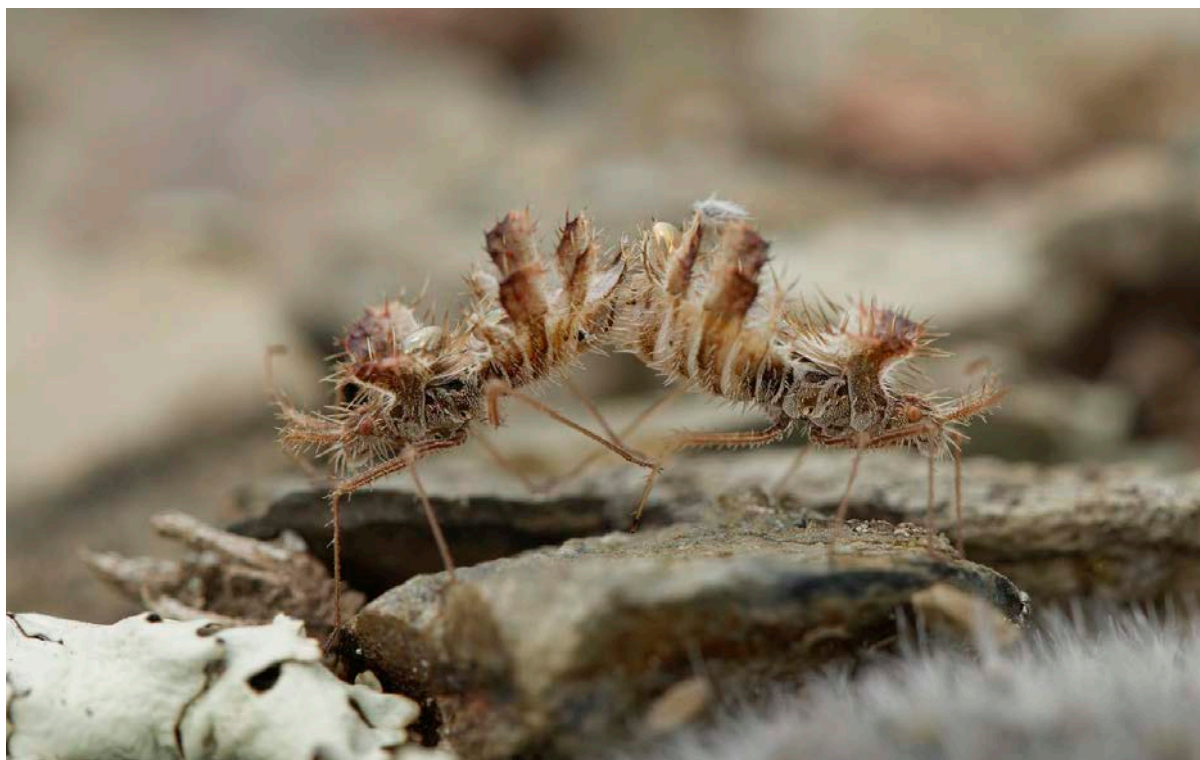
Fig. 1 : Accouplement sur la station à à Aspin-Aure, Hautes-Pyrénées. On peut distinguer sur le dos du mâle un œuf, la particularité de cette espèce étant que les mâles portent les œufs issus de leur accouplement avec les femelles (cf pour précisions à ce sujet Cochard & Maurel, 2017).