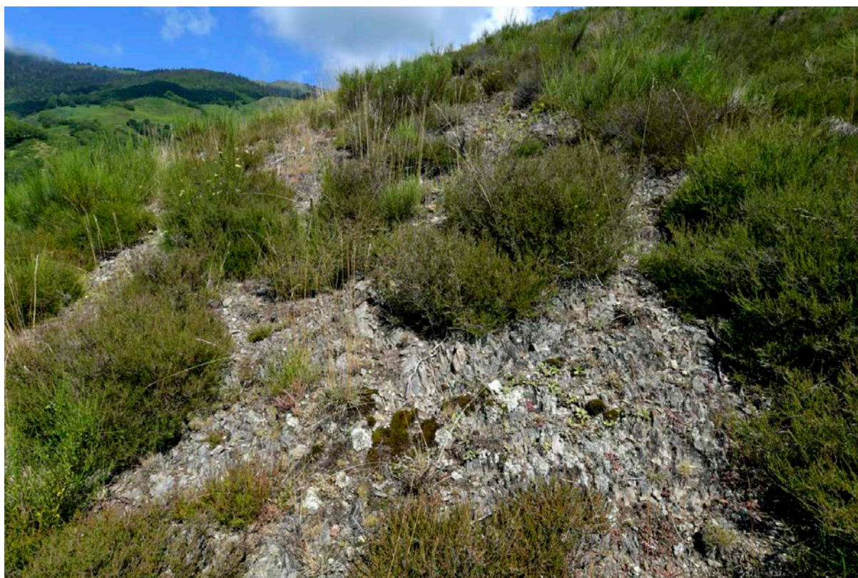
Fig. 2 : Aspect de la station de Phyllomorpha laciniata à Aspin-Aure, Hautes-Pyrénées.

Les parties siliceuses des Pyrénées situées sur des versants sud entre 400 et 1250 m d'altitude, de