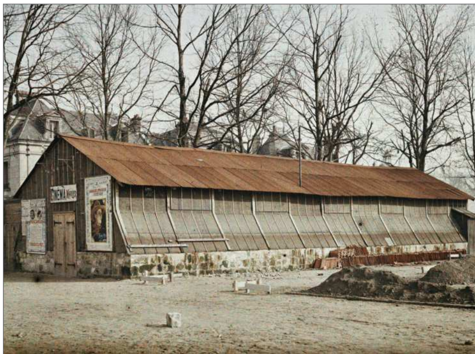
Fig. 6 : Aisne, Soissons, « Un cinéma », Frédéric Gadmer, 13 mars 1920, autochrome 9 x 12 cm, inv. A 20 582, Département des Hauts-de-Seine, musée départemental Albert-Kahn, collection Archives de la Planète.

Outre sa documentation imprimée et son armée de conférenciers, l' Union dispose de deux autres forces de frappe, la propagande par l'image et un savoir-faire certain dans l'organisation de manifestations publiques. Dotée depuis la guerre d'un service photographique et cinématographique soutenu par celui de l'Armée - puis, à partir de 1919 au moins par celui d'Albert Kahn 33 -, elle met à disposition de ses partenaires plans de conférence et jeux de photographies et fait circuler des camionnettes cinématographiques qui projettent gratuitement des films pédagogiques en relation avec ses thématiques de combat. Sur la question du réconfort moral, il est ainsi répondu au capitaine Petit qu'un conférencier cinéma œuvre déjà chaque dimanche à Lille, Roubaix et Tourcoing et qu'il est prévu d'étendre cette action dans le Nord et dans l'Aisne.