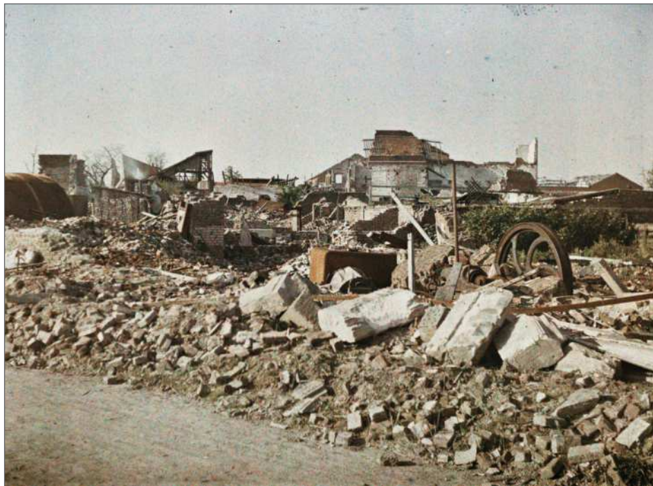
Fig. 1 : Tergnier, Aisne, « Ruines de la Maison du peuple, rue Marceau », Georges Chevalier, 15 mai 1919, autochrome 9 x 12 cm, inv. A 16 197, Département des Hauts-de-Seine, musée départemental Albert-Kahn, collection Archives de la Planète.

social convaincu et il se situe au carrefour de réseaux multiples. Ces trois composantes structurent son approche de la reconstitution des régions dévastées.