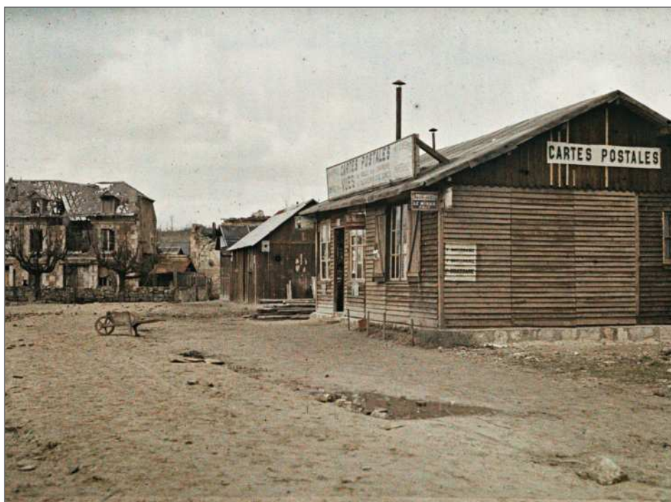
Fig. 10 : Aisne, Vailly, « « Le nouveau Village », Frédéric Gadmer, 16 mars 1920, autochrome 9 x 12 cm, inv. A 20 653, Département des Hauts-de-Seine, musée départemental Albert-Kahn, collection Archives de la Planète.

Ces itinéraires individuels malheureux ne doivent pas pour autant masquer des réussites collectives payantes à plus long terme. Le mouvement coopératif, largement encouragé par l' Union , a joué un rôle essentiel dans la reconstruction. Les régions dévastées enfin ne sont qu'une cause parmi toutes les autres que cette association a défendues, par exemple le pacifisme, la Société des Nations, la coopération internationale ou encore l'égalité des chances 54 .