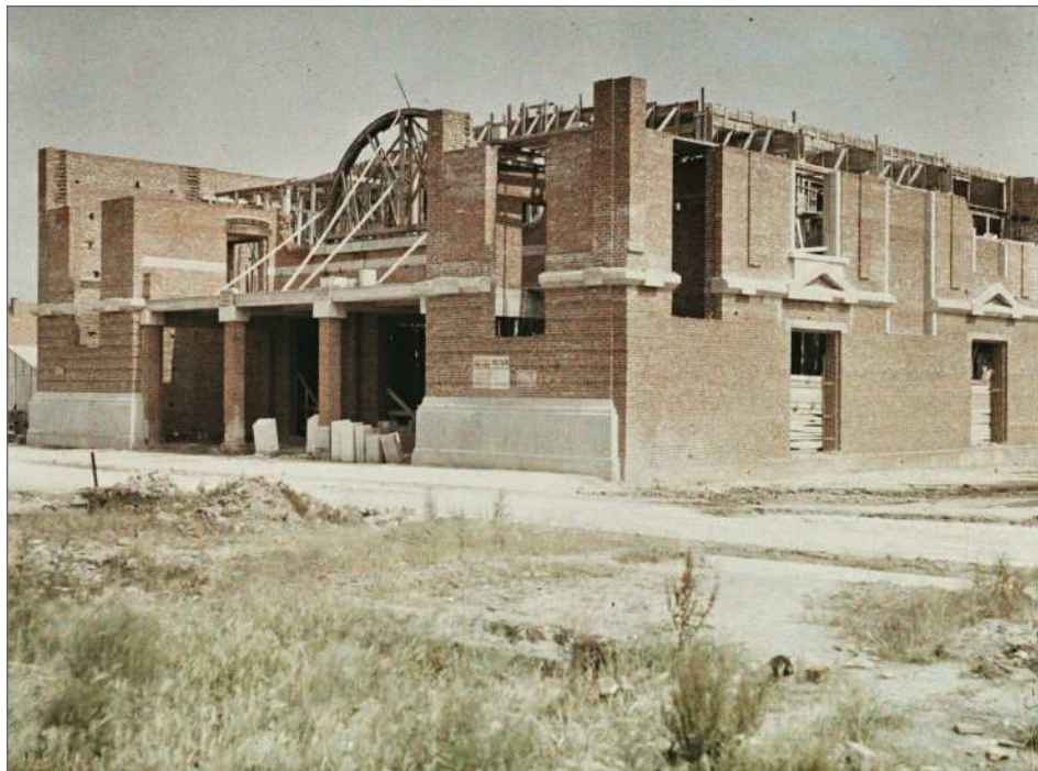
Fig. 7 : Pas-de-Calais, Lens, « Reconstruction de la maison du Peuple », Frédéric Gadmer, 17 juin 1922, autochrome 9 x 12 cm, inv. A 32 226, Département des Hauts-de-Seine, musée départemental Albert-Kahn, collection Archives de la Planète.

La Commission des régions libérées s'inquiète aussi des débats qui agitent la communauté internationale sur le versement des réparations allemandes et demande au gouvernement de ne pas esquiver ses responsabilités quant au financement du relèvement. Comme en écho au cas Sartoris, il est souligné « qu'une grande partie de ces offres [d'aide] n'a pu être réalisée par suite d'un manque complet d'organisation 40 ». Pour assurer dons et parrainages, on en appelle donc à des actions de sensibilisation dans les régions prospères et à l'envoi d'écoliers sur l'ancien front pour leur faire constater la réalité des faits.