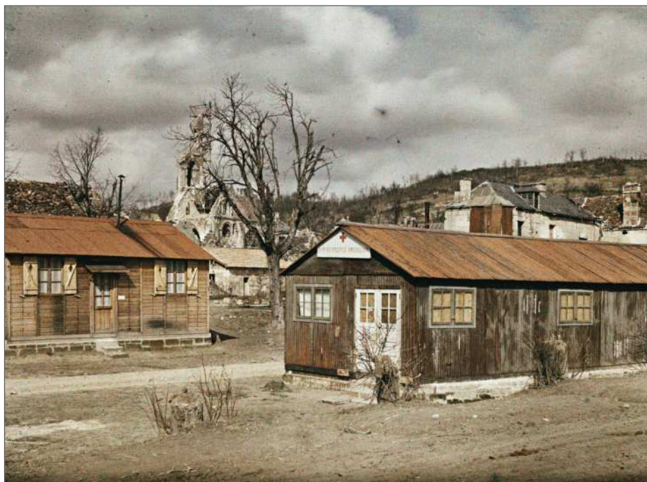
Fig. 3 : Vailly, Aisne, « Bâtisses dans les ruines » [on lit : don du peuple américain ], Frédéric Gadmer, 16 mars 1920, autochrome 9 x 12 cm, inv. A 20 659, Département des Hauts-de-Seine, musée départemental Albert-Kahn collection Archives de la Planète.

Pendant la guerre, Jean Brunhes se voue comme beaucoup d'intellectuels à la propagande dans les pays neutres. Ceci le rapproche du ministère des Affaires étrangères, ainsi que du service des Beaux-Arts, cogestionnaire de la Section photographique et cinématographique de l'Armée avec laquelle le laboratoire des Archives de la Planète collabore 14 . La défense des intérêts nationaux restant d'actualité, Brunhes co-dirige en 1919-1920 une revue de propagande franco-américaine intitulée La France . Il en anime le bureau français, le bureau américain étant à la charge de son amie Claude Rivière 15 . Autour de la revue s'entrecroisent plusieurs réseaux et notamment des acteurs qui gravitent autour d'un projet américain d'aide au relèvement des régions dévastées.