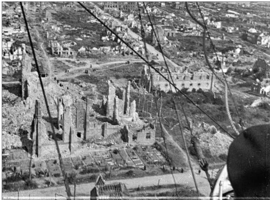
Fig. 9 : « En dirigeable sur les champs de bataille », Lucien Le Saint et Camille Sauvageot, août 1919, film positif nitrate, ref. AI 84 490, inv. 120 587, Département des Hauts-de-Seine, musée départemental Albert-Kahn, collection Archives de la Planète.