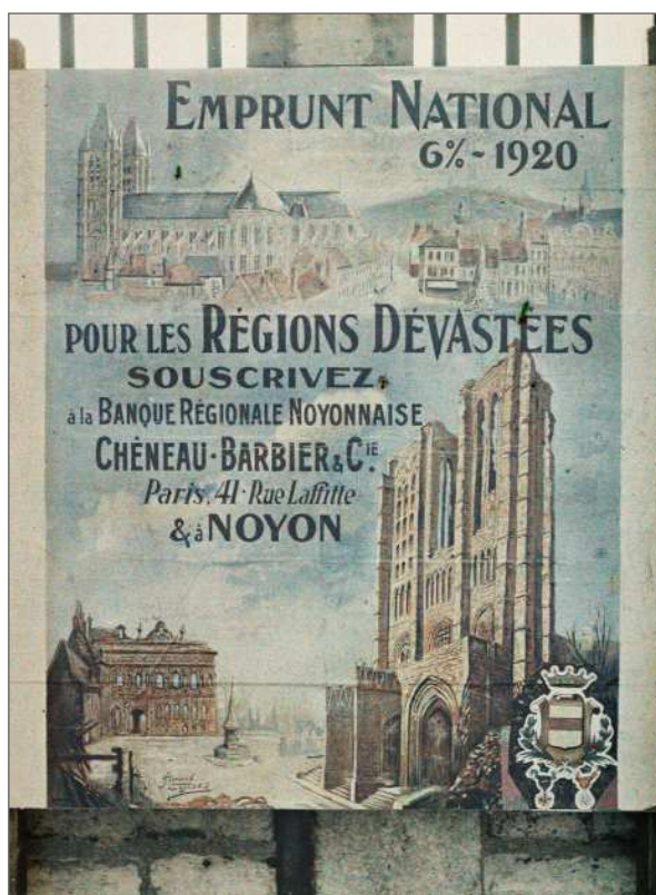
Fig. 5 : Paris, « Affiches emprunt Nat[ional] 6% 1920 Banque régionale Noyonnaise », octobre 1920, Frédéric Gadmer, autochrome 12 x 9 cm, inv. A 24 132, Département des Hauts-de-Seine, musée départemental Albert-Kahn, collection Archives de la Planète.

bolcheviques. Les années 1920-1921 sont ensuite structurées autour de la lutte contre les fléaux sociaux et autres facteurs de dépopulation, la reconstitution des régions libérées et la défense du traité de Versailles.