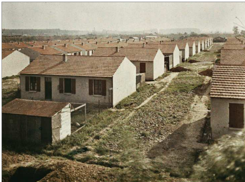
Fig. 2 : Tergnier, Aisne, « Quartiers provisoires de Tergnier », Frédéric Gadmer, 6 juin 1921, inv. A 27 570, autochrome 9 x 12 cm, inv. A 16 197, Département des Hauts-de-Seine, musée départemental Albert-Kahn, collection Archives de la Planète.

et d'économie urbaines de la ville de Paris. L'expression « technique de la vie » renvoie à la question du logement ouvrier, que la reconstruction donne l'occasion de repenser comme un moyen de lutte contre les fléaux sociaux. Sa réflexion sur ce point est ancienne, sa Géographie Humaine comprenant au chapitre « géographie sociale » un développement sur les cités minières. Se référant à l'école sociologique de Le Play, il y défend le modèle de la cité-jardin par opposition à « la maison-caserne dans la ville-usine 5 . » Il l'appréhende en termes d'hygiène physique, morale et sociale, souhaite un retour à une forme d'habitat assurant la mixité des classes et adhère aux idées patronales de type paternaliste qui visent à fixer l'ouvrier au sol et à l'usine en lui pourvoyant un foyer matériel et moral. La cité-jardin de Tergnier, photographiée en cours de construction en 1921 aux Archives de la Planète , est ainsi couverte d'éloges dans sa Géographie du travail de 1926 6 .