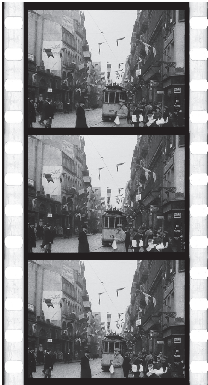
Illustration 5. Metz, scènes diverses, négatif nitrate, TCI 16 : 31 : 43 : 00. Opérateur non mentionné, décembre 1918, réf. AI 83975, musée départemental Albert-Kahn, collection Archives de la Planète.