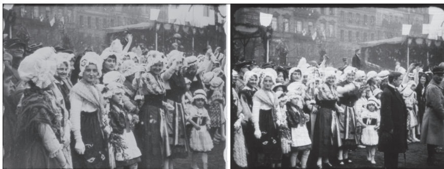
Illustrations 1 et 2. Metz reçoit le gouvernement de la République, positif nitrate 14.18 A 220, TCI 00 : 00 : 07 et 00 : 00 : 14. Même moment, capté par deux caméras différentes et répété à deux endroits différents dans la même copie.

L'examen des positifs nitrate confirme que chacune des copies, bien que portant le même titre, est un exemplaire unique. Le procédé de montage fait apparaître deux constantes : la ponctuation des films par la répétition de plusieurs scènes, prises de points de vue différents (illustrations 1 et 2) et l'existence, d'une copie à l'autre, de micro-différences dans l'ordre de présentation et la durée de certaines séquences.