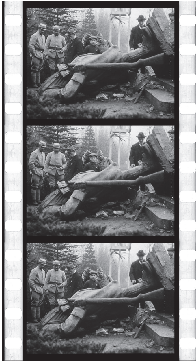
Illustration 6. Metz, scènes diverses, négatif nitrate, TCI 16 :33 :06 : 13. Opérateur non mentionné, décembre 1918, réf. AI 83975, musée départemental Albert-Kahn, collection Archives de la Planète.