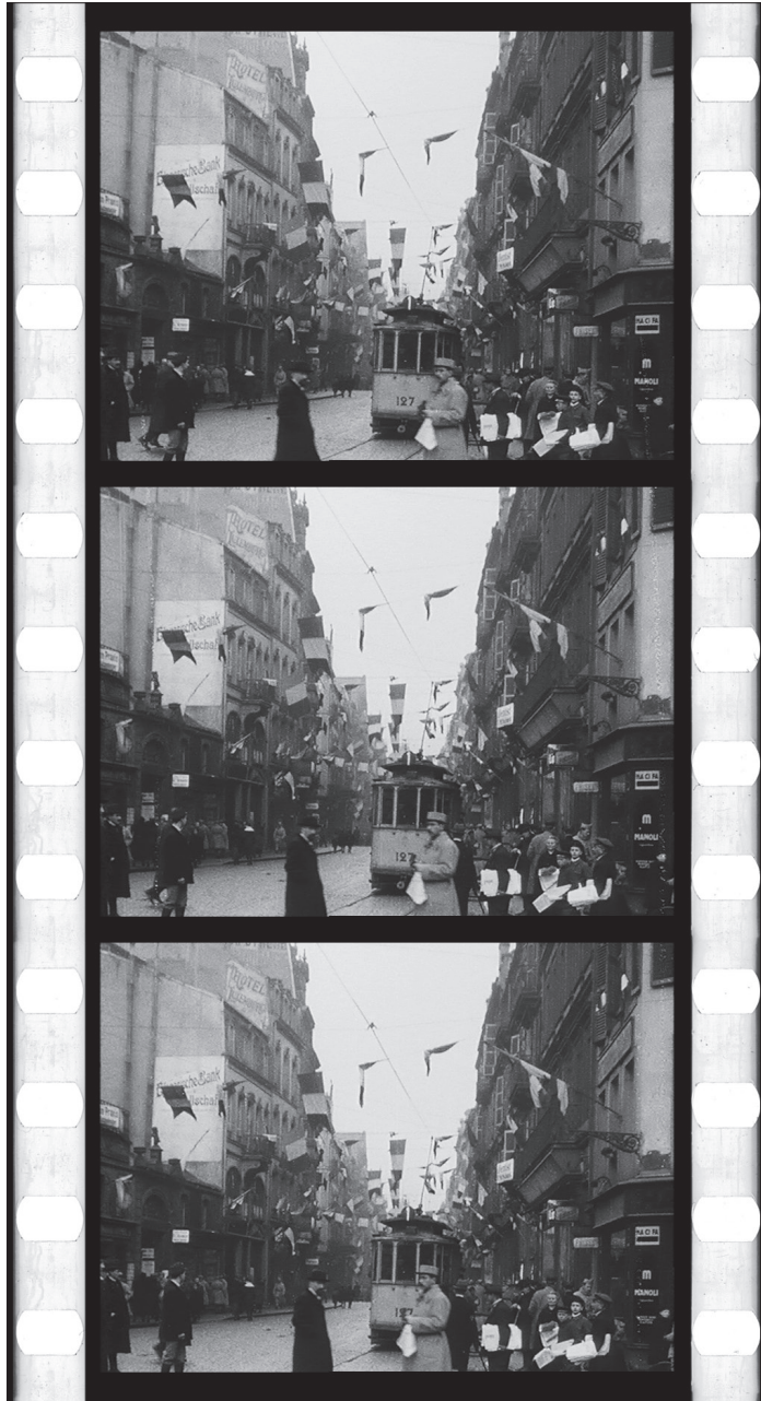
Illustration 5. Metz, scènes diverses, négatif nitrate, TCI 16 : 31 : 43 : 00. Opérateur non mentionné, décembre 1918, réf. AI 83975, musée départemental Albert-Kahn, collection Archives de la Planète.