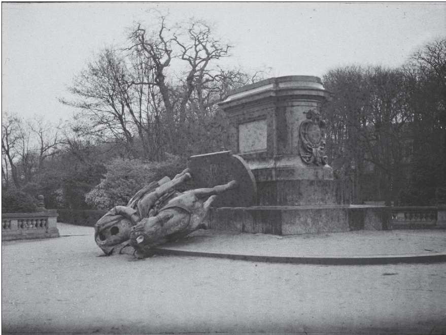
Illustration 7. Frédéric III déboulonné , Georges Chevalier, Metz, 11 décembre 1918, autochrome 9 x 12 cm, inv. A 15258, MAK-collection ADLP.

Jean Brunhes, qui arrive à Metz le 11 décembre, fait photographier des sujets tout à fait similaires pour alimenter ses conférences de propagande du moment sur l'Alsace-Lorraine (illustration 7).