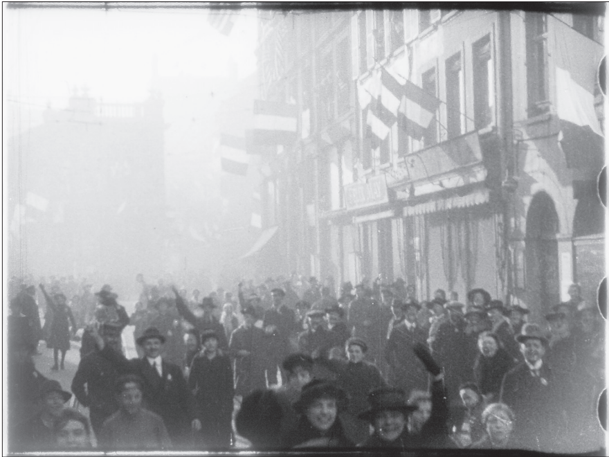
Illustration 4. Les Français entrent à Metz , négatif nitrate 14.18 B 656.

des séquences utilisées pour établir les premiers positifs, tandis que des séquences plus longues sont restées intègres car inutilisables pour l'exploitation : défilé pris en arrière-plan et masqué par des mouvements de foule chaotiques au premier plan (illustration 4), mise en place agitée de petites Lorraines dans les secondes qui précèdent un portrait de groupe qu'on retrouvera dans la version commercialisée, moments d'attente où les personnalités officielles devisent avec décontraction en fumant une cigarette... Autre constat accréditant l'hypothèse que cette bande n'était pas destinée à être copiée : à l'emplacement des collures, on n'a pas pris la peine de supprimer les voiles noirs produits par les arrêts de caméra.