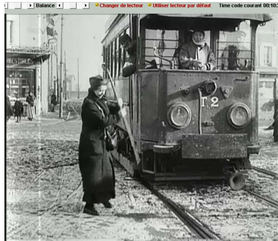
Paris après trois ans de guerre : machiniste et receveuse de tramway, 14.18 B 369, TCI 00 : 10 : 30

Deux figurantes du film Paris après trois ans de guerre ont été portraiturées chez Albert Kahn à Boulogne-sur-Seine en octobre 1917. Le répertoire d'inventaire d'époque indique qu'un exemplaire de leur portrait leur a été offert à chacune.