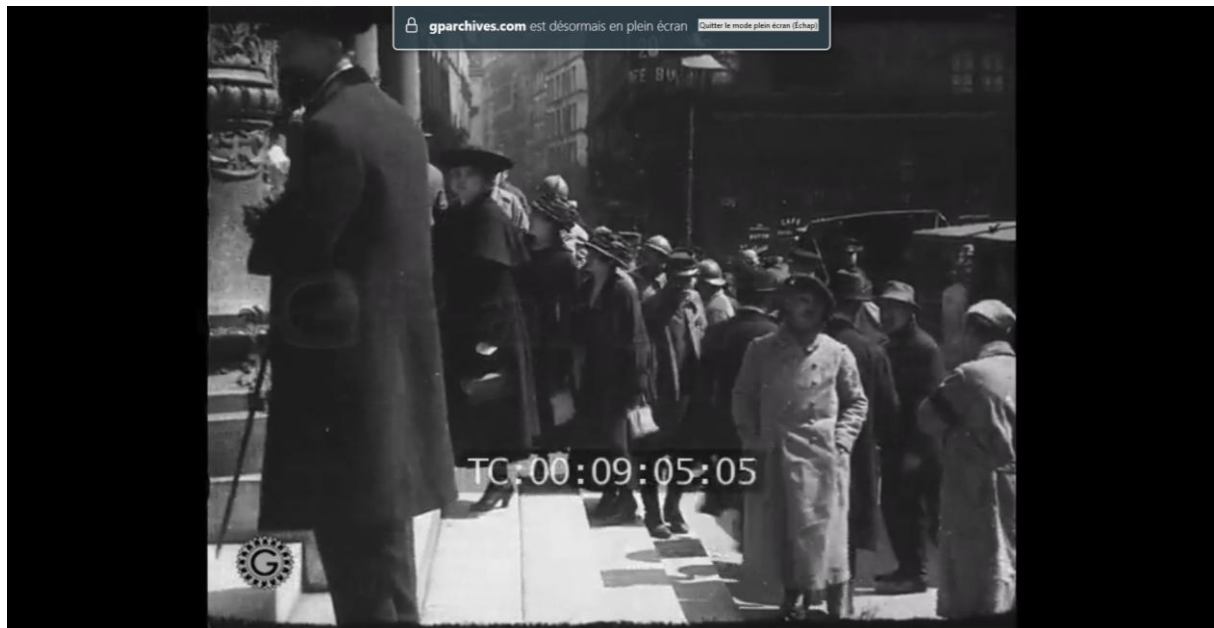
Paris après trois ans de guerre . Séquence : « Place Boieldieu, des spectateurs militaires et civils sur les marches de l'Opéra-Comique (angle rue Favart) », Gaumont-Pathé archives, 1917GR 10054, TCI 00 : 09 : 05 : 05.