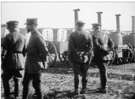
Scènes pendant la guerre : séquence sans titre, identifiable comme « le maréchal French visite le front de Champagne, octobre 1916. 23 » Musée Albert-Kahn, réf. AI 110 800, inv. 115174, op. cit. TCI 09: 01: 40: 22.

Paris après trois ans de guerre (avril 1917) : l'ECPAD et Gaumont-Pathé archives conservent deux positifs de ce film, dont les négatifs ne sont pas localisés.