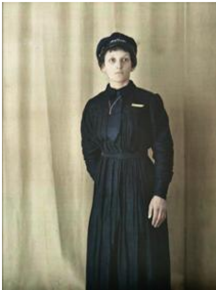
Madame ... machiniste de tramway, Auguste Léon, 17 octobre 1917, autochrome 13x18 cm, musée Albert-Kahn, inv. A 12546.