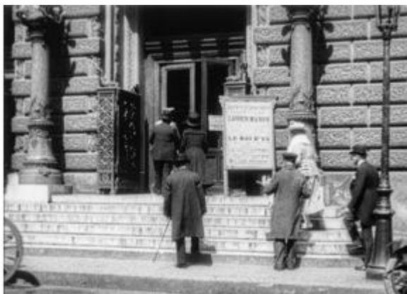
Paris pendant la guerre, scènes diverses : « L'Opéra-comique. » Anonyme, film négatif nitraté, 1917, musée Albert-Kahn, réf. AI 53528, inv. 111 514, TCI 07 : 42 : 36 : 14.