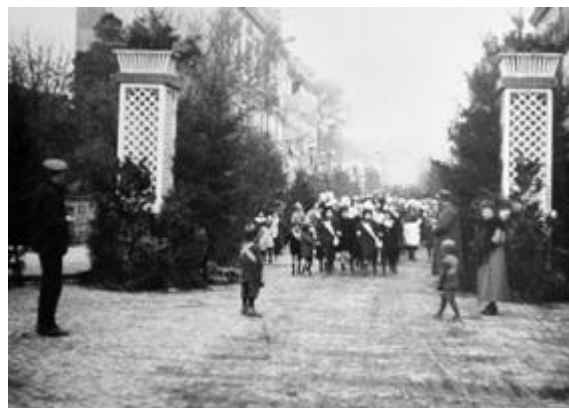
Alsace-Lorraine : entrée des troupes françaises . TCI 15 : 12 : 49 : 17.

Anonyme, film positif nitrate, [19 novembre] 1918, musée Albert-Kahn, réf. AI 83925, inv. 113 093