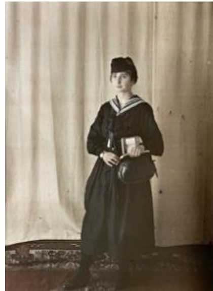
Mlle... receveuse de tramway, Auguste Léon, 17 octobre 1917, autochrome 9x12 cm, musée Albert Kahn, inv. A 12550.