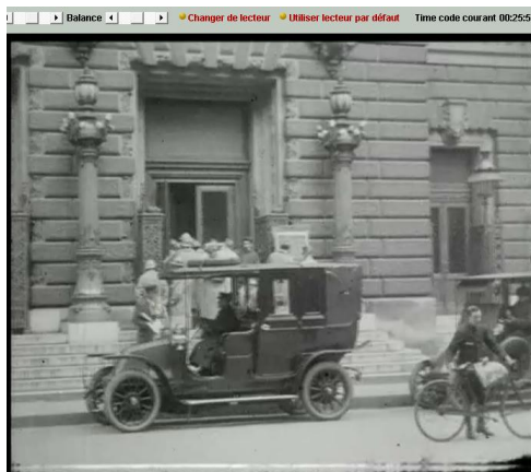
Paris après trois ans de guerre : « La foule est restée fidèle aux théâtres : (...) Massenet à l'opéra-comique. » Anonyme, film positif nitraté, 1917, ECPAD, réf. 14-18 B 369, TCI 00 :25 :59.