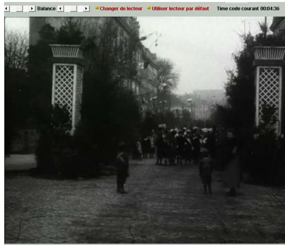
Entrée des troupes françaises en Alsace et en Lorraine : « À Sarrebourg (Moselle), des enfants en costume traditionnel font une farandole, tout comme à Saverne. » TCI : 00 : 04 : 36.

Anonyme, film négatif nitrate, 18-26 novembre 1918, ECPAD, réf. 14-18 190