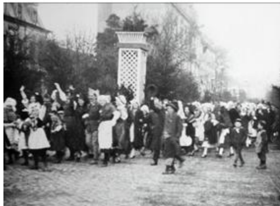
Alsace-Lorraine : entrée des troupes françaises. TCI 15 : 12 : 49 : 17.

Anonyme, film positif nitrate, 1918, musée Albert-Kahn, réf. AI 83925, inv. 113 093.