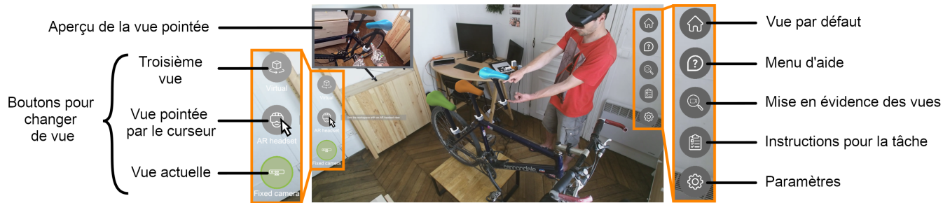
FIGURE 2 : Interface d'ARGus sur un ordinateur standard lors de la conception d'une selle de vélo avec un collaborateur en RA.