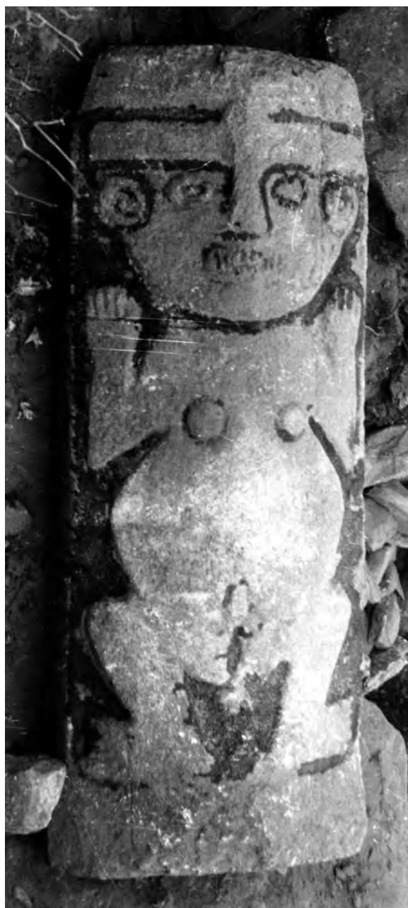
Figure 1. Bas-relief recuay d'un personnage bisexué

Le monolithe de Keka Marca est une dalle verticale sculptée en bas-relief sur une seule face et sur laquelle est représenté un personnage anthropomorphe aux attributs sexuels à la fois féminins et masculins (fig. 1). C'est au cours d'une mission de reconnaissance archéologique dans la région de Huaraz, département d'Áncash, que Julio Tello accompagné de deux étudiants nord-américains, Richard Cross et Cornelius Van Schaack Roosevelt, a fortuitement découvert le 3 août 1934 une sculpture recuay sur le site de Keka Marca 43 . Cette dalle sculptée, aujourd'hui disparue 44 , nous est parvenue grâce à une photographie prise par Cross le jour de sa découverte. Celle-ci nous offre une occasion unique d'observer un individu sculpté, représenté mains levées, jambes et bras fléchis et écartés. Il porte un couvre-chef de type turban ainsi que des ornements d'oreille concentriques. Les yeux et la bouche sont ouverts et les dents apparentes. Si ces éléments de parure et ces traits physiques de la tête sont particulièrement récurrents dans l'iconographie des sculptures recuay, les attributs sexuels féminins