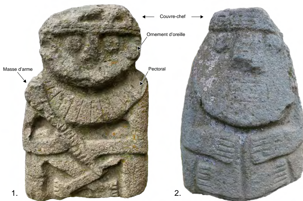
Figure 3. Deux statues recuay de personnages sans organes génitaux

Musée archéologique d'Áncash « Augusto Soriano Infante », Huaraz, Pérou