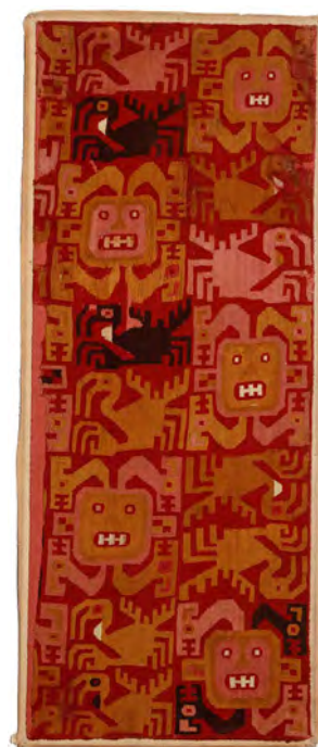
Figure 5. Fragment de tissu recuay