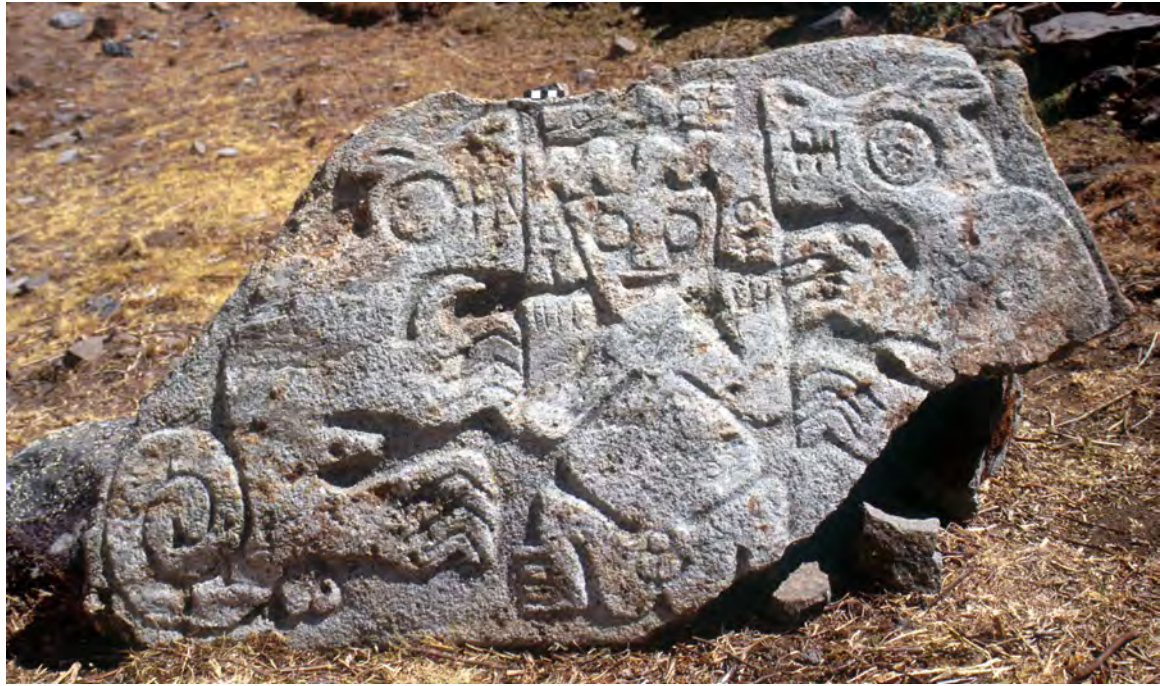
Figure 2. Bas-relief recuay d'un personnage en apparence bisexué accompagné de deux félins Dimension : H.66 L.128 (cm). Provenance : Site archéologique de Chinchawas, Pérou (disparu aujourd'hui)

clairement identifiables le sont moins ; la poitrine est représentée par deux cercles au niveau des aisselles et le sexe féminin par une forme ovoïde verticale bien reconnaissable 45 . Le sexe masculin, quant à lui, est plus difficile à discerner en raison de l'effacement des motifs sur cette partie inférieure de la sculpture, mais il est tout de même perceptible, en érection, au-dessus du sexe féminin. Bien qu'il ne soit malheureusement plus possible de vérifier l'ensemble de ces éléments de visu, le monolithe de Keka Marca semble bien représenter une figure anthropomorphe androgyne. C'est d'ailleurs ce que décrit Tello lorsqu'il regarde la sculpture pour la première fois : « A god with hands upraised and apparently bisexual 46 . »