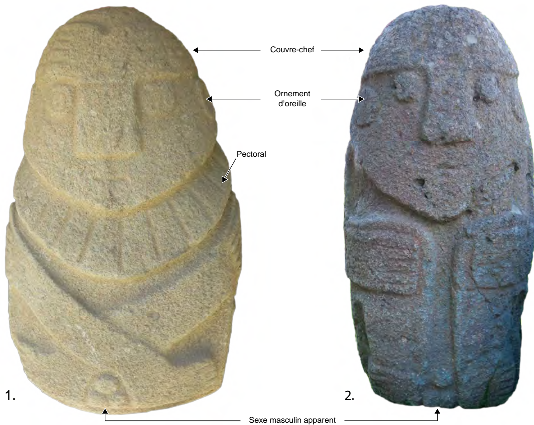
Figure 6. Deux statues recuay de personnages avec organes génitaux masculins

Ces personnages possèdent des caractéristiques morphologiques et des éléments de parure identiques à ceux des personnages sans organes génitaux illustrés en fig. 3. 1. Personnage recuay assis en tailleur, les mains sur les genoux. Provenance : Batan (Huaraz) 2. Personnage recuay assis, jambes repliées sur la poitrine et mains sur les genoux. Provenance inconnue