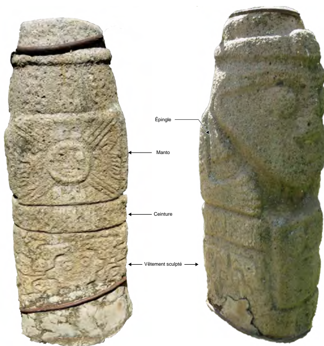
Figure 4. Statue recuay vêtue

Casa-museo Santiago Antúnez de Mayolo, Aija, Pérou.