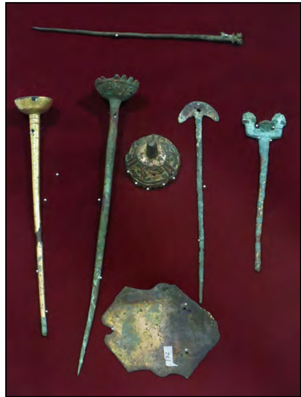
Figure 8. Variété d'épingles recuay en métal Musée archéologique d'Áncash « Augusto Soriano Infante », Huaraz, Pérou. Provenance inconnue