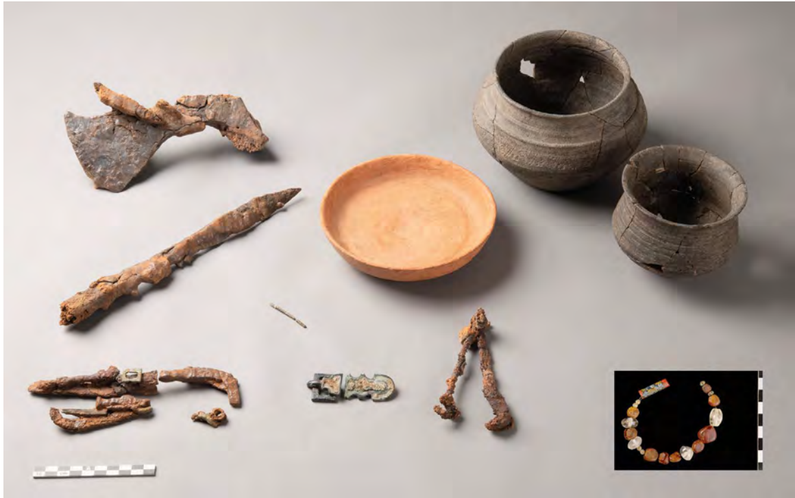
Figure 2. Mobilier de la tombe 137