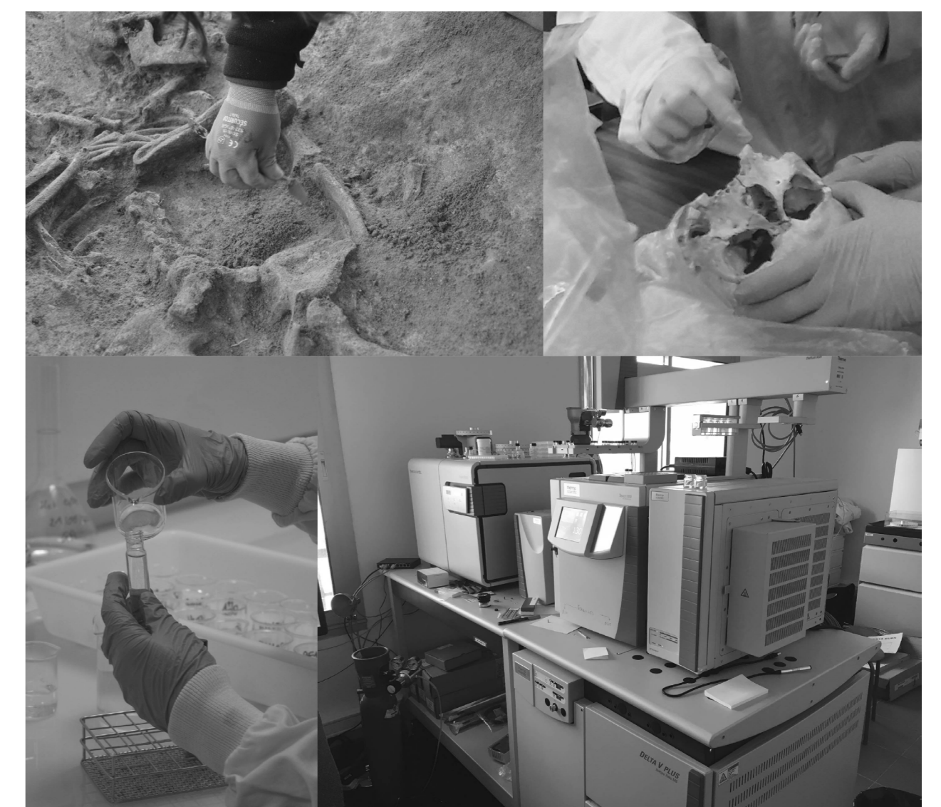
Figure 2. Du terrain au laboratoire : études multidisciplinaires autour de vestiges anthropologiques et de leurs environnements.