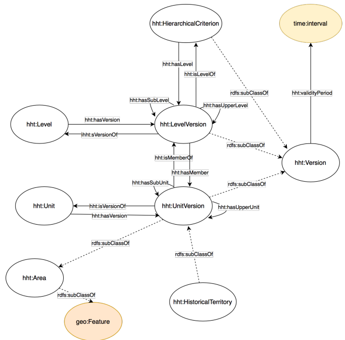
FIGURE 1 – Schéma de l'ontologie HHT

Cette deuxième partie de l'ontologie vise à représenter les changements ayant mené à la création d'une nouvelle version d'unité territoriale. Trois grands types de changements sont considérés :