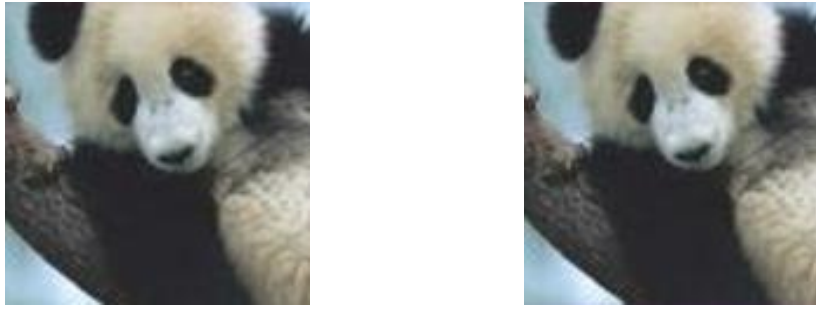
Figure 2 : un panda ou un singe ?