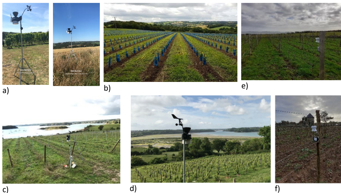
figure 2 : Photographies de stations météorologiques (Davis Vantage Pro) situées à : a) Quimper ; b) Merléac avant/après plantation ; c) Saint-Jouan-des-Guérets et d) Saint-Suliac ; et de capteurs (Tinytag et abri solaire) situés à e) l'île d'Arz et f) à Sarzeau.