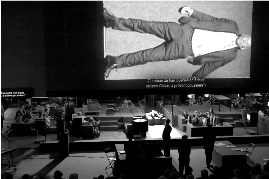
Ill. 4 – Tragédies romaines d'Ivo van Hove.