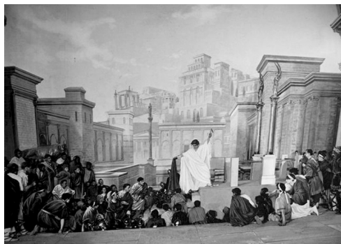
Ill. 1 – Mise en scène d'Antoine à l'Odéon, 1906. Le Théâtre, 1907

Magnificence et souci de reconstitution historique : tel est le double objectif d'Antoine, qui s'est rendu deux fois à Rome et a chargé un jeune chartiste, Georges-Gustave Toudouze, de fournir tous les détails sur la Curie 25 . Monter Jules César , c'est donc évoquer la Rome antique [ill. 1]. Pour ce faire, un modèle s'est imposé, celui d'une peinture pétrie de néoclassicisme, dont le tableau de Jean-Léon Gérôme, exposé au Salon de 1859, constitue l'archétype. La majesté des formes architecturales (colonnes et portique, statues et marbre du sol) renvoie à un passé glorieux. Et, pour toute une série de metteurs en scène, le recours à des décors faisant référence à ce type d'architecture se révélera indispensable. Même sur de petits plateaux, le souci de reconstitution sera présent. L'on songe, dans les années Trente à la mise en scène de Charles Dullin au Théâtre de l'Atelier en 1937, en écho à celle de William Bridges-Adams au Shakespeare Memorial Theatre en 1934. Pour jouer avec la petitesse de la scène, Pierre Sonrel utilise des arcs et des colonnes, figure les rues de Rome et les maisons des conjurés, fait s'imposer la statue de Pompée en face du siège de César, borne le champ de bataille de Philippes par des portants, des praticables et un escalier de fond, pour donner un effet de relief et de profondeur 26 .