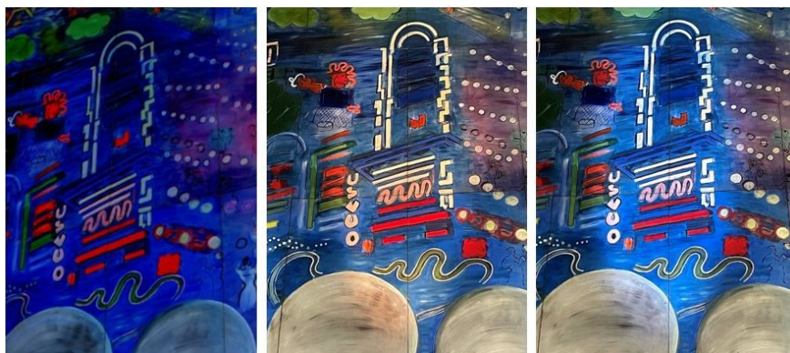
Figure 2. — De gauche à droite, essais de lumière sur l'enseigne de cinéma peinte par Raoul Dufy, 2021. À gauche, détail éclairé en lèche-mur par l'installation permanente. Au centre, essai de température de couleur de 3500 K. À droite, essai de température de couleur de 5000 K (température de couleur choisie pour l'expérience).