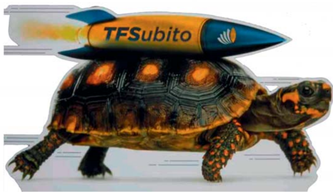
Abb. 2: Mit Geschwindigkeit gewinnt man Raum statt Zeit Werbeplakat für eine Kreditanstalt (Italien, Bologna, 8. Februar 2020).

Illich, „wäre eine Gesellschaft, die dem Menschen die Möglichkeit gibt, autonome und kreative Tätigkeiten mit Hilfe von Werkzeugen auszuüben, die durch andere weniger kontrollierbar sind.“ 16 Und ist es nicht genau dieses Prinzip, das in den Cittaslow-Städten, die es dem Menschen ermöglichen, die Geschwindigkeit zu kontrollieren, zur Anwendung kommt?