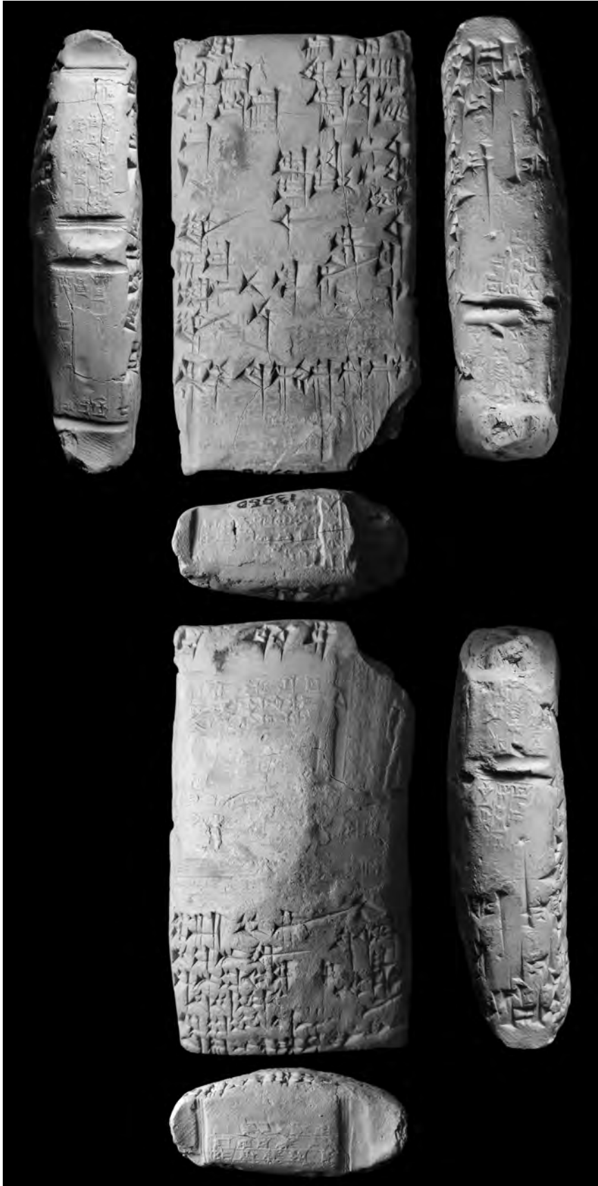
Fig. 3. La tablette BM 13960.