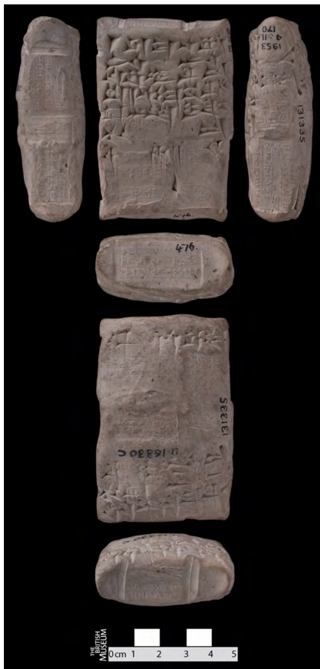
Fig. 6. La tablette UET 5 476.

préférer les céder à un voisin intéressé par une extension de sa maison 56 , et retirer de l'argent de cette vente.