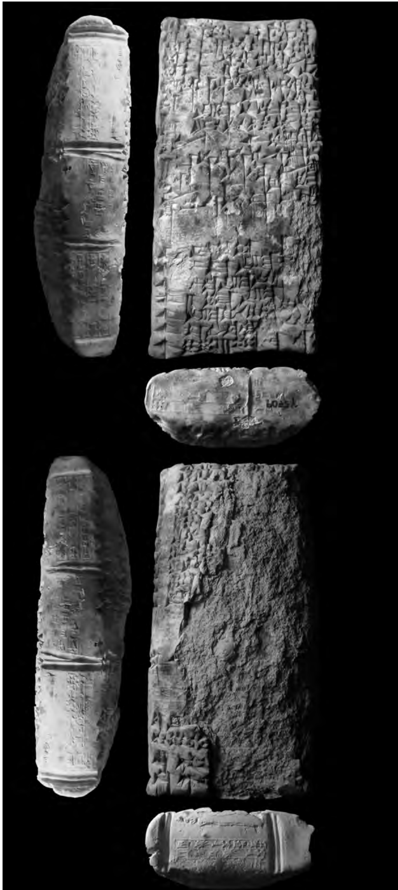
Fig. 5. La tablette YOS 5 122.