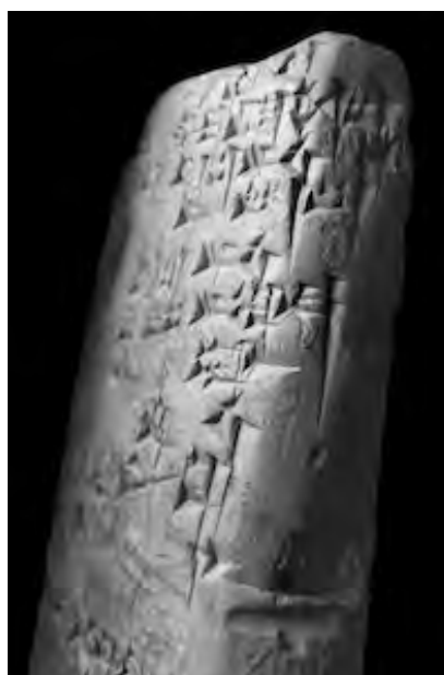
Fig. 2. Détail de BM 13960.