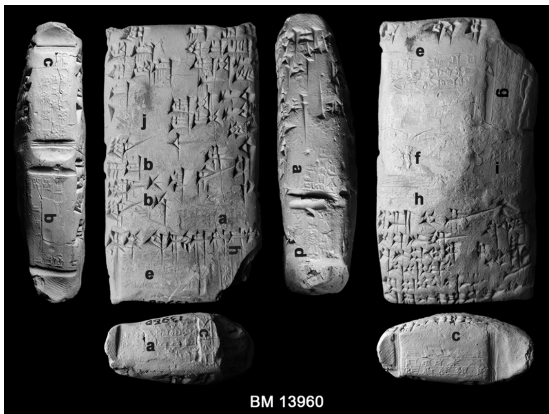
Fig. 4. Emplacement des empreintes de sceaux sur BM 13960 (clichés D. Charpin, montage V. Chalendar).

(5-7) Puzur-Šamaš fils d’Ibbi-Ilabrat a acheté (4) au temple de Nanna (1-3) 1 sar de maison en ruine, à côté de la maison d’Imgur-Sin, le ŠITA.ÈŠ, et à côté de la maison de Puzur-Šamaš. (8-10) Il lui a versé 6 sicles d’argent pour son prix complet. (11) Cet argent (a été versé) dans la caisse du Ganunmah. (12) Le sceau des šatammû . (Date).