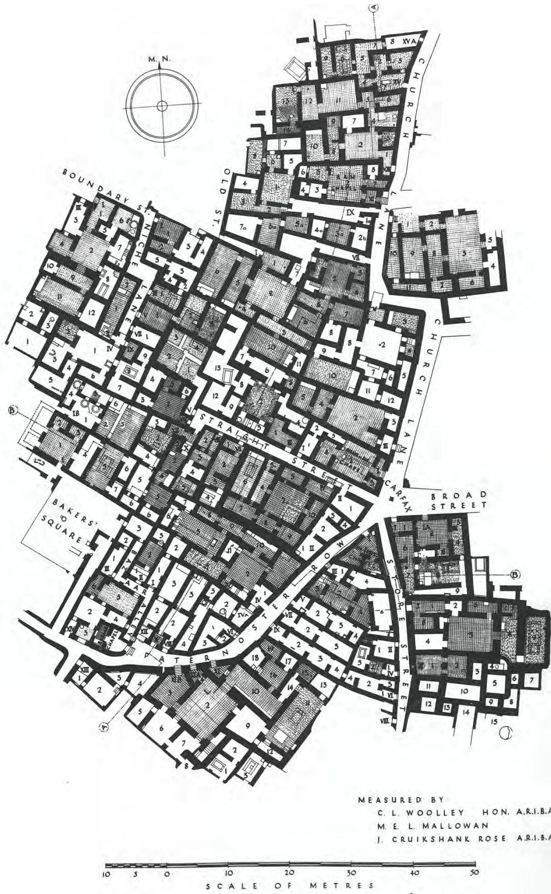
Fig. 2. Le quartier AH (d'après UE 7, pl. 124).