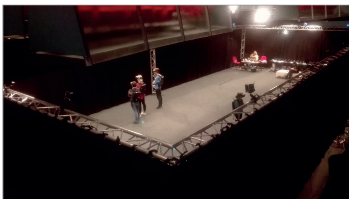
Figura 5. Fotografía tomada durante la experiencia del reportaje periodístico en realidad virtual The enemy , 2018.