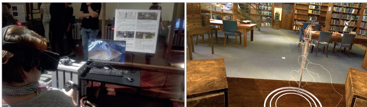
Figura 3. Imagen izquierda, fotografía tomada a una usuaria mientras visualiza e interactúa con un objeto 3D del documental Hold the world with David Attenborough (2018). Tomada durante el GIFF, 2018. Imagen derecha, captura de este mismo documental, 2019.

pectador e identificar los diferentes relatos interactivos retomando tipificaciones previas del documental interactivo o webdoc y obtendremos como resultado tipos de documental inmersivo interactivo. Un ejemplo de este modelo también lo tenemos en el tercer capítulo de la serie Hors-cadre . El funcionamiento técnico de estos documentales se basa, en definitiva, en utilizar un motor de juego como Unity para aprovechar la interactividad propia del videojuego en VR.