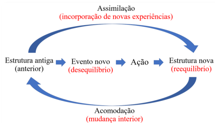
Figura 1 – Fenômeno de adaptação e equilibração proposto por Piaget.

assimiláveis deverão levar o sujeito às novas acomodações e aos novos equilíbrios (adaptações) cognitivos (MOREIRA, 1999). Esses processos podem ser visualizados na Figura 1.