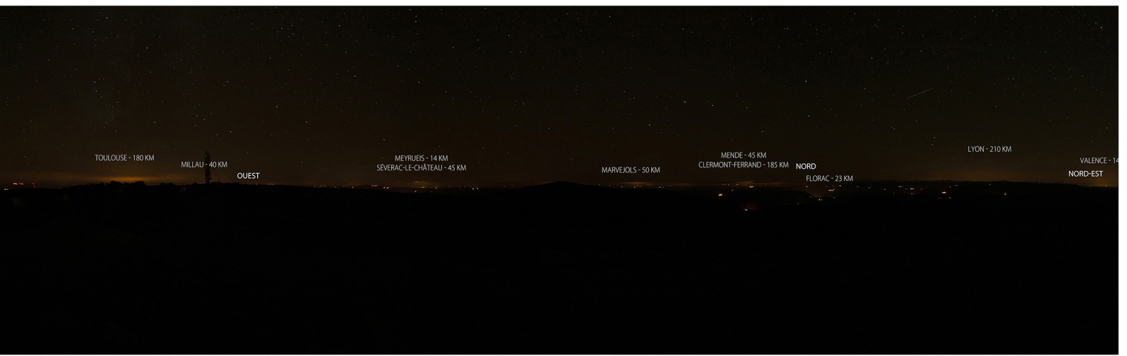
s halos. Date des images : 3 octobre 2018.