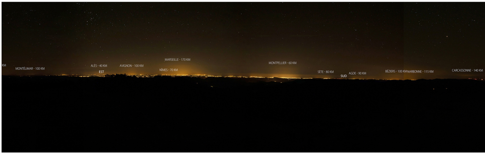
Panorama à 360° depuis le sommet du mont Aigoual (terrace du restaurant et nord-ouest du Météosite). Surexposition (+ 1) pour mieux révéler le