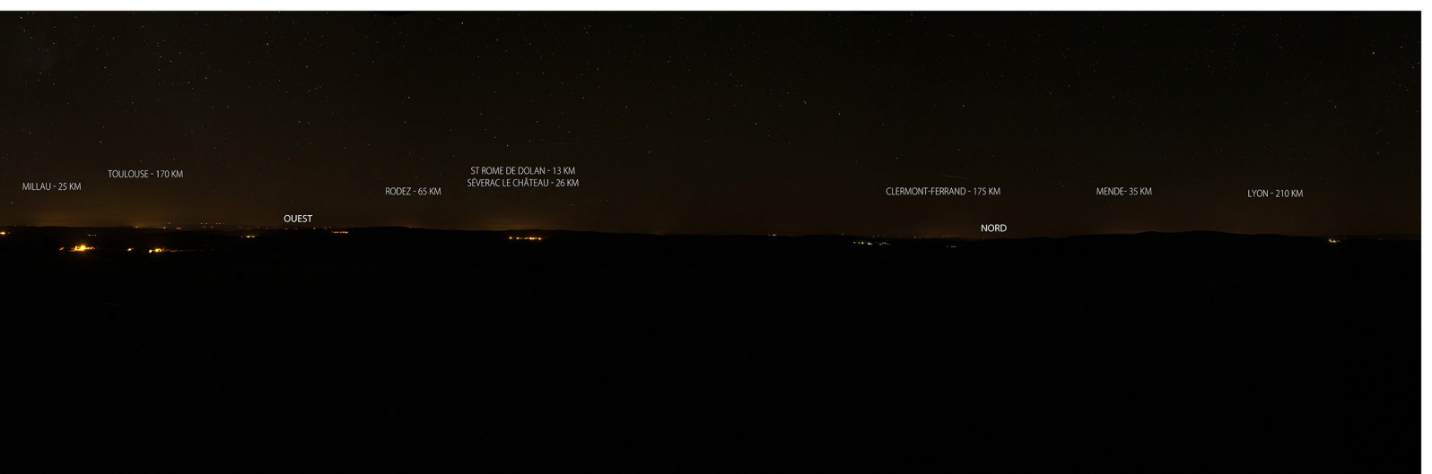
4 octobre 2018.