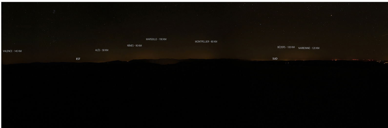
Panorama à 360° depuis le causeway Méjan (citerne au-dessus de l'Aven Armand). Surexposition (+ 1) pour mieux révéler les halos. Date des images :