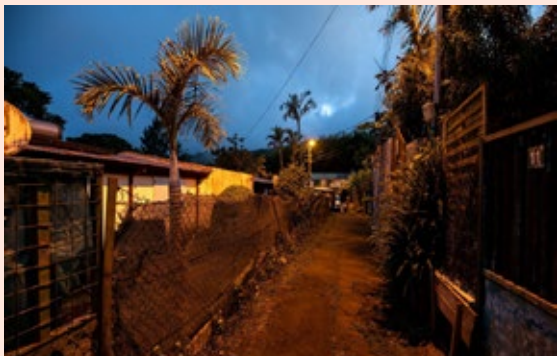
Parcours commenté nocturne avec des habitants de La Plaine des Palmistes.