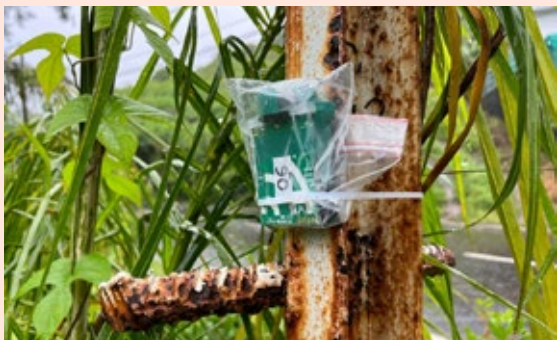
Enregistreur bioacoustique installé dans la commune de Saint-Joseph lors d'une expérimentation visant à étudier les effets de l'extinction de l'éclairage public sur l'utilisation des paysages par les chiroptères.

Fig.2. L'interdisciplinarité et la participation sont au fondement des démarches de recherche et de recherche interventionnelle déployées par les chercheurs de l'Observatoire de l'environnement nocturne pour un rapprochement des expertises scientifiques, techniques et d'usage, ici dans le cadre du programme pluriannuel FENOIR, à La Réunion.