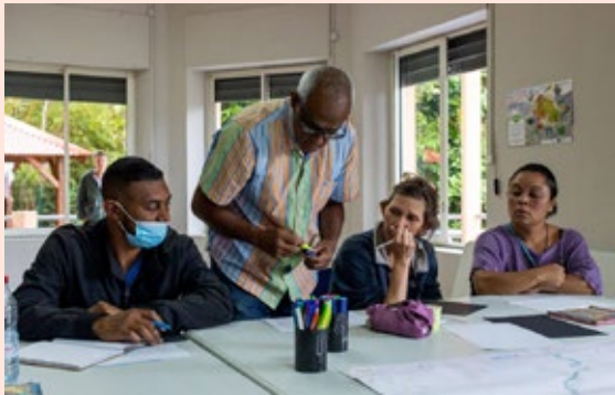
Atelier habitants dans le quartier du Brûlé (commune de Saint-Denis).