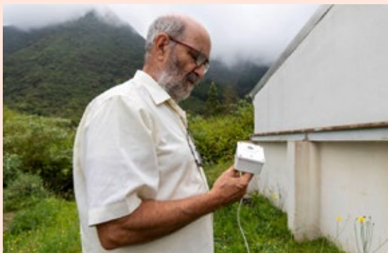
Installation d'un photomètre TESS-W à l'Observatoire astronomique des Makes dans le cadre du déploiement d'un réseau de capteurs pour le suivi long terme de la pression lumineuse sur l'île.