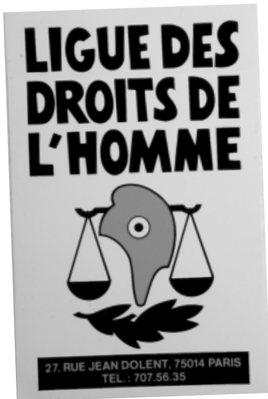
Fac-similé d'une affiche éditée par la LDH (fin des années soixante).