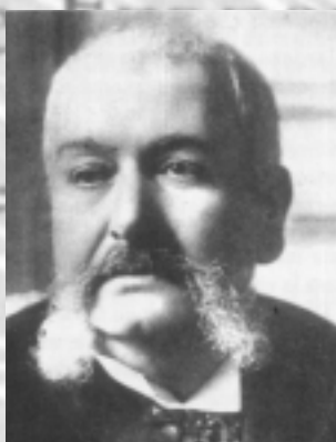
Francis de Pressensé (1903-1914)