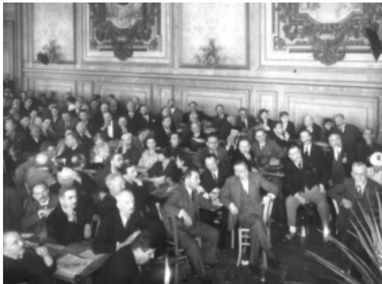
Scéance plénière lors du Congrès de la LDH des 17, 18 et 19 juillet 1937 à Tours.

Se réclamant d'un héritage, celui de la Révolution française et des déclarations de 1789 puis de 1793, patrimoine revivifié par elle grâce à l'affaire Dreyfus et au dreyfusisme, la LDH dépasse progressivement sa quête fondatrice, celle de la recherche de la Vérité, par l'éthique et la critique, pour plonger dans la poursuite d'un combat quotidien, celui du Droit et de la Justice, des droits et des justices et, à terme, celui d'une autre modalité d'agir en politique 101 . Prônant l'indivisibilité et la sacralité des droits naturels, débordant ceux-ci en embrassant la question sociale dans un État républicain, la Ligue des droits de l'homme et du citoyen agit donc sur la texture d'un droit lié à la vie de Cité, c'est-à-dire lié aux cultures, aux pratiques, aux politiques, aux idéologies. Avec des limites, naturellement et des divergences. L'originalité de la LDH réside aussi dans son refus d'en rester à une simple philosophie sociale ; elle revendique des droits sociaux en termes de droit positif et collectif. À cet égard, elle réfute la concep-