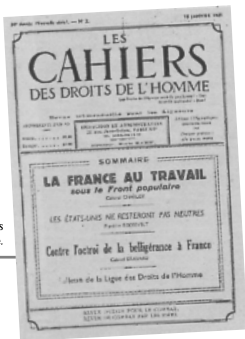
Fac-similé des Cahiers des droits de l'homme.

Le projet ligueur est plutôt d'imposer une exigence régulatrice dont le contenu n'est pas déterminé à l'avance, mais acquis, selon elle, par des principes intangibles et à appliquer au fur et à mesure ; et cela sans verser dans le moralisme ou le juridisme. Si, le fait est connu, la Ligue des droits de l'homme a fait de la politique à plusieurs reprises, dès lors qu'elle préfigure un rassemblement des gauches en supportant le Bloc des gauches avant 1914, en soutenant le Cartel des gauches en 1924 et, mieux, en participant à la formation et à la direction du Rassemblement populaire à partir de 1934-1935, l'association s'insère plus largement et plus profondément dans le politique, ne serait-ce que parce qu'elle est le reflet d'antagonismes sociaux et qu'elle produit « une certaine intégration de tous à la collectivité 10 ».