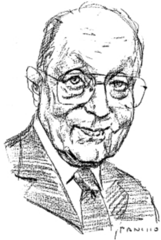
Portrait de Daniel Mayer réalisé par Pancho, décembre 1996.

Il n'en demeure pas moins que les propositions de la LDH aboutissent quand elles rejoignent la politique : le ligueur Marc Ruccart, devenu garde des Sceaux, adopte même des modifications préconisées par la Ligue des droits de l'homme. Un exemple : la Ligue lui demande d'abroger le décret retirant le droit au ministre de révoquer, de rétrograder ou déplacer d'office un magistrat du ministère public, considérant que « sous couleur d'accorder des garanties aux magistrats du Parquet, le ministre de la Justice renonçait à son droit fondamental de disposer de ses procureurs et substituts », que « c'était là une atteinte portée aux principes fondamentaux de la séparation des pouvoirs et des droits du souverain, en l'espèce la Nation française » et que « c'était méconnaître la distinction essentielle entre la magistrature assise et la magistrature debout ». Marc Ruccart, s'inspirant « des principes mêmes de la Ligue », répond positivement 24 .