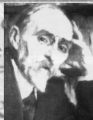
Ferdinand Buisson (1914-1926)