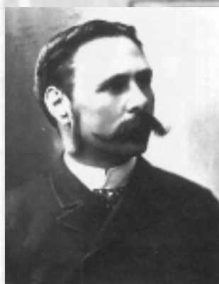
Ludovic Trarieux (1898-1903)