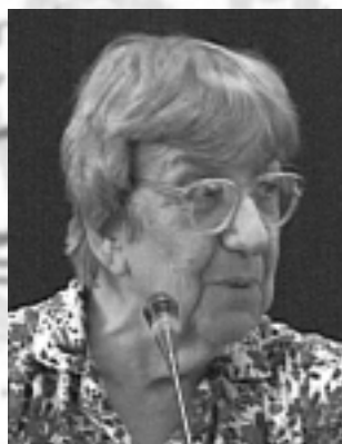
Madeleine Rebérioux (1991-1995)