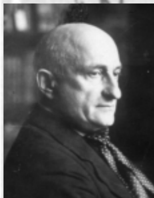
Victor Basch (1926-1944)